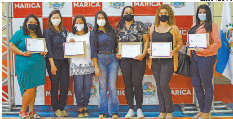
Oportunidade para que os moradores garantam os empregos dos sonhos

Para que todos os moradores tenham as mesmas opções de conquistar o emprego dos sonhos, a Prefeitura de Maricá conta com o Programa Municipal de Qualificação Profissional. Com ele, através da contratação do Instituto Embelleze, são oferecidos cursos gratuitos de manicure, cabeleireiro, maquiagem, designer de sobrancelhas, barbeiro e depilação.