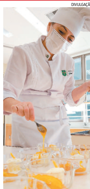
Chef de Maricá em Tóquio

"Lá, trocamos experiências de vida e profissionais. Por