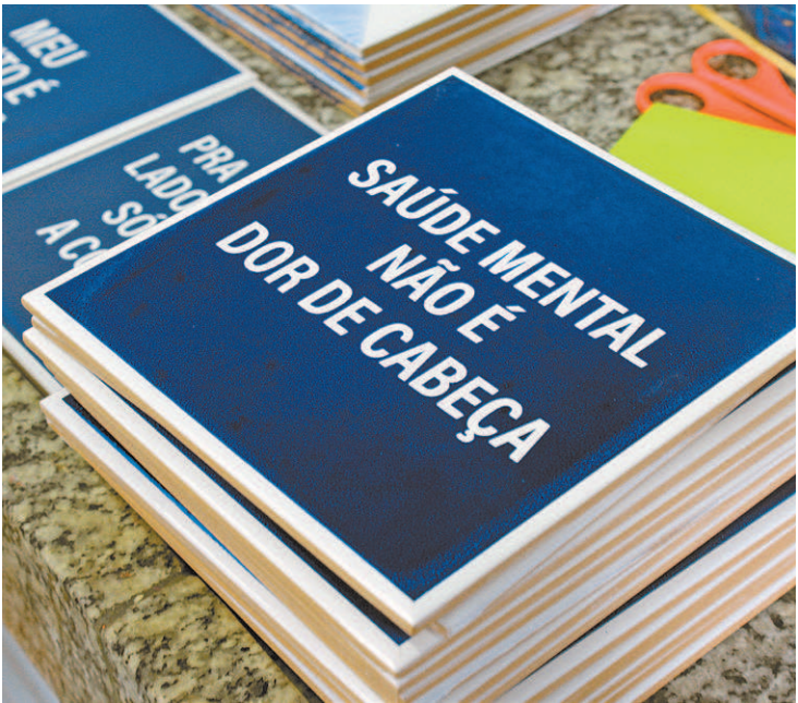
Saúde mental estará em debate em evento na Maré a partir de hoje