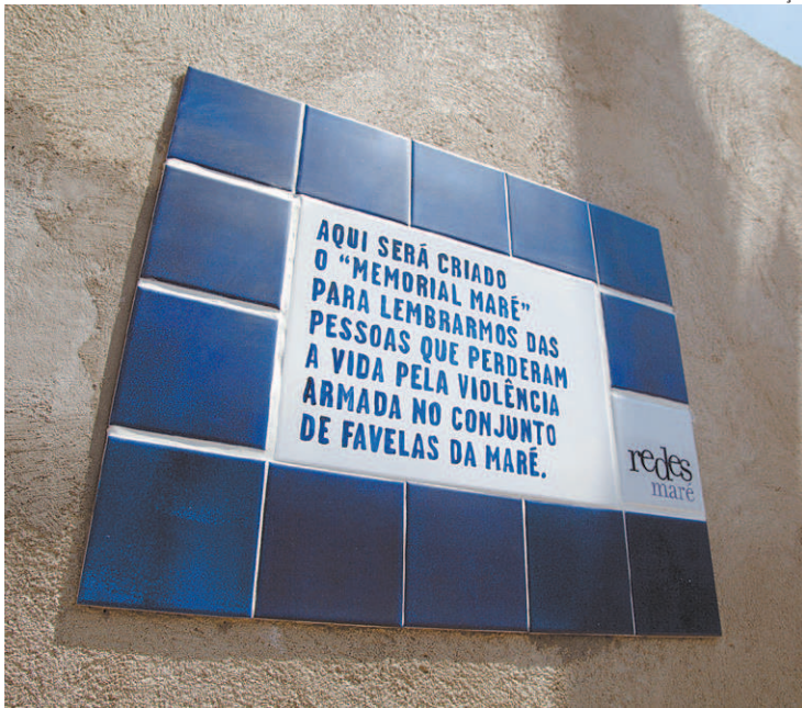
Placa do memorial às vítimas de violência do Complexo da Maré