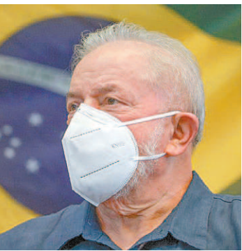
MPF denunciou Lula novamente

trário ao pedido de impeachment do ministro Alexandre de Moraes, do Supremo, apresentado por Bolsonaro, ao qual se referiu como “iniciativa sem qualquer fundamentação jurídica”. Já a Associação Nacional dos Membros do Ministério Público afirmou que “o Brasil precisa de harmonia e não de conflito” e que o Senado tem “todos os instrumentos” para defender a Democracia. Com Estadão Conteúdo e iG