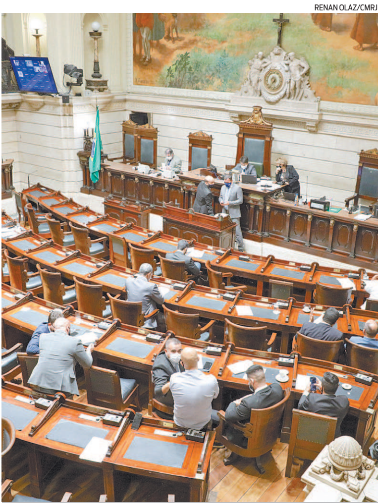
Lei aprovada na Câmara aproxima Executivo de associações.