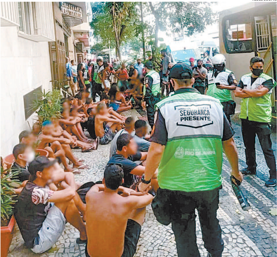
Agentes do Copacabana Presente fizeram o ônibus da linha 474 parar e abordaram o grupo

N a tarde de sábado, um grupo de jovens tomou um ônibus da linha 474 e criou uma confusão generalizada dentro do coletivo, causando medo em passageiros e moradores do bairro. Após a denúncia de um pedestre, agentes do Copacabana Presente fizeram o veículo parar e abordaram o grupo. De acordo com a Segurança Presente, agentes realizavam um patrulhamento na Avenida Figueiredo Magalhães com Rua Barata Ribeiro quando foram abordados por um homem que informou que um ônibus estava sendo roubado. Ao abordar o veículo, a equipe constatou várias pessoas em atitude suspeita e um deles pulou do coletivo, pela janela, deixando Nas redes sociais, moradores de Copacabana mostraram medo e indignação