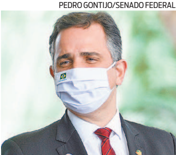
Pacheco afastou possibilidade