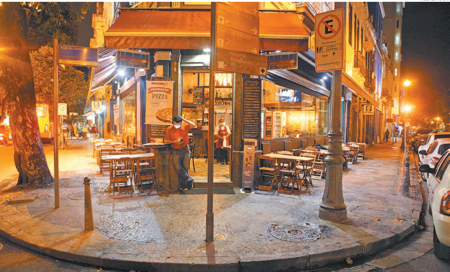
De acordo com o Sindicato de Bares e Restaurantes do Rio, estabelecimentos funcionam, em média, com 20% a menos de receita

Apesar dos desafios que ainda são enfrentados pelo setor, expectativa de empresários e empregos para os próximos meses é de crescimento da demanda