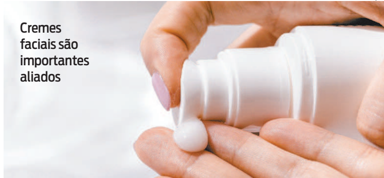
Cremes faciais são importantes aliados

“Beber água no inverno é tão importante quanto no verão. Nessa época, o organismo gasta mais energia para realizar as atividades do dia a dia e manter o corpo aquecido. Consequentemente, há uma perda de água maior, ao contrário do que se imagina. A ingestão adequada de água é ‘superimportante’ para auxiliar na re-