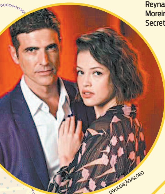
Reynaldo Gianecchini e Agatha Moreira contracenaram em 'Verdades Secretas' e em 'A Dona do Pedaço'