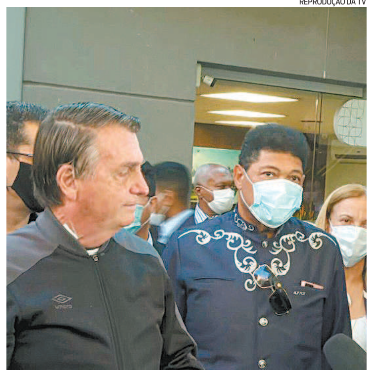
Ao sair de hospital, Bolsonaro fala da baixa efetividade da Coronavac