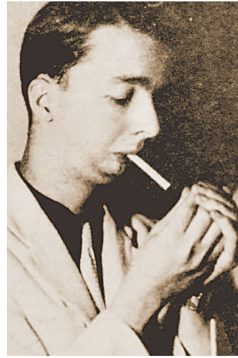
Noel Rosa: mais de 250 canções

uma Biografia', considerado até hoje o melhor livro sobre o bamba. A trajetória de Noel virou, ainda, tema de peças, filmes e desfile de escola de samba, como em 2010, quando a Unidos de Vila Isabel homenageou o filho mais ilustre do bairro com o enredo 'Noel: a Presença do Poeta da Vila', ficando em quarto lugar. O samba-enredo trazia a assinatura de Martinho.