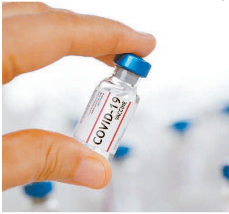
Vacinação contra covid-19 segue avançando em todo o estado

vid-19, divulgado na última sexta-feira, pela Subsecretaria de Vigilância e Atenção Primária à Saúde (SVAPS), mostra também uma redução de 26% nas internações por síndrome respiratória aguda grave (SRAG) na