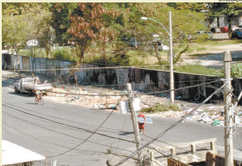
Calçada ao lado do muro do PAM de Bangu virou um lixo a céu aberto

Em nota a Comlurb informou que realiza regularmente o serviço de remoção dos entulhos e