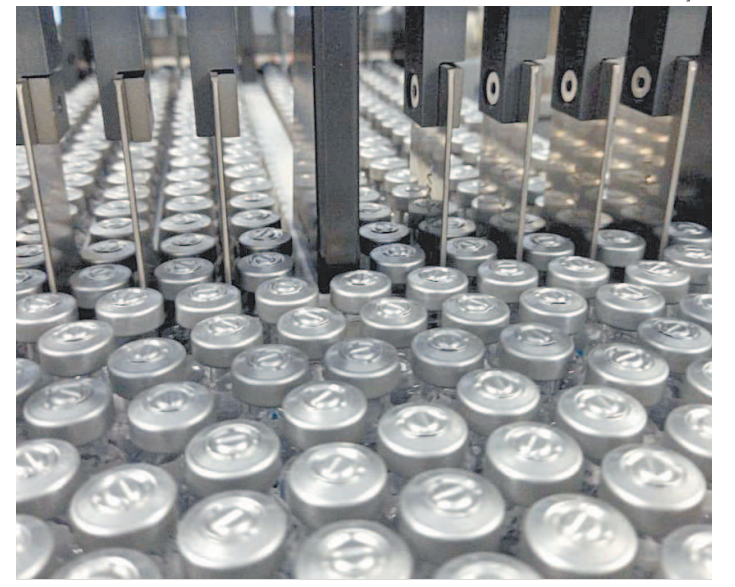
Carga de IFA chegou ao Rio de Janeiro na noite de sábado

A Prefeitura acelerou o calendário da vacinação contra a covid-19 e prevê toda a população carioca, a partir de 12 anos, imunizada com as duas doses até o fim novembro deste ano. Veja o calendário da semana: Hoje: Pessoas de 36 anos; Terça-feira (20/07): Pessoas de 36 anos; Quarta-feira (21/07): Pessoas de 36 anos; Quinta-feira (22/07): Pessoas de 35 anos; Sexta-feira (23/07): Pessoas de 35 anos; Sábado (24/07): Pessoas de 35 anos.