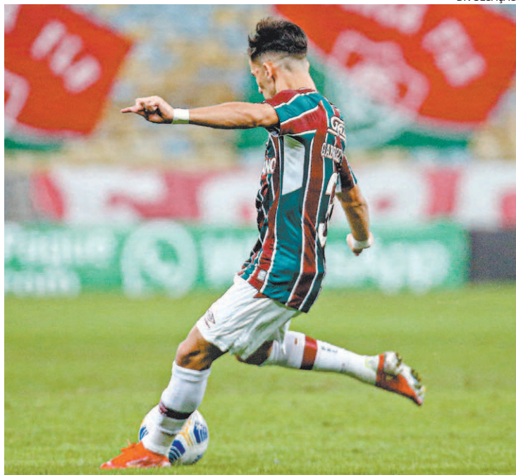
Fluminense enfrenta o Cerro Porteño, de Arce, amanhã, no Maracanã