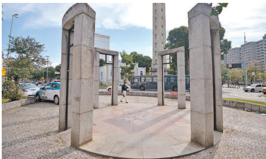
Monumento a Noel, na entrada do Boulevard 28 de Setembro, está vazio desde 2019

"Noel é o ícone maior do nosso bairro e representa muito para nós. A estátua foi retirada, e simplesmente ninguém fala mais nada.