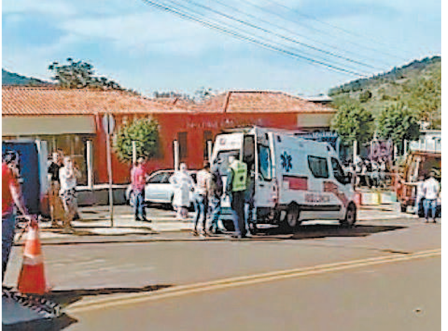
No ataque à creche de Saudades, em Santa Catarina, três crianças e duas professoras morreram. Assassino sobreviveu

para cá? Tem gente que ele estava falando que diz que é terrorista. E tem gente que ele está falando que pode ser terrorista e não está dizendo’. O delegado me contou um monte de história, de cara que sai da Armênia, e sai pelo mundo cooptando. Muito bem, pensei: ‘acabou’, nada mais. E, então, maio agora, a mãe dele me liga,