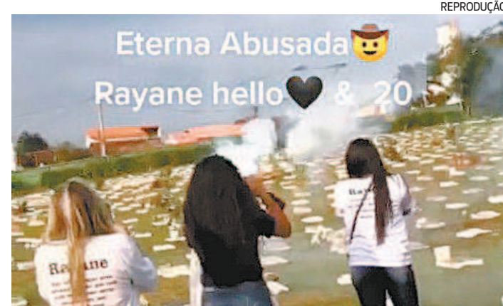
Foguetório marca o enterro em cemitério de São Gonçalo