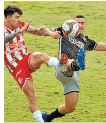
Vasco fez o gol no fim do jogo

Cruzmallino não soube lidar com a intensidade do Timbu e sofreu