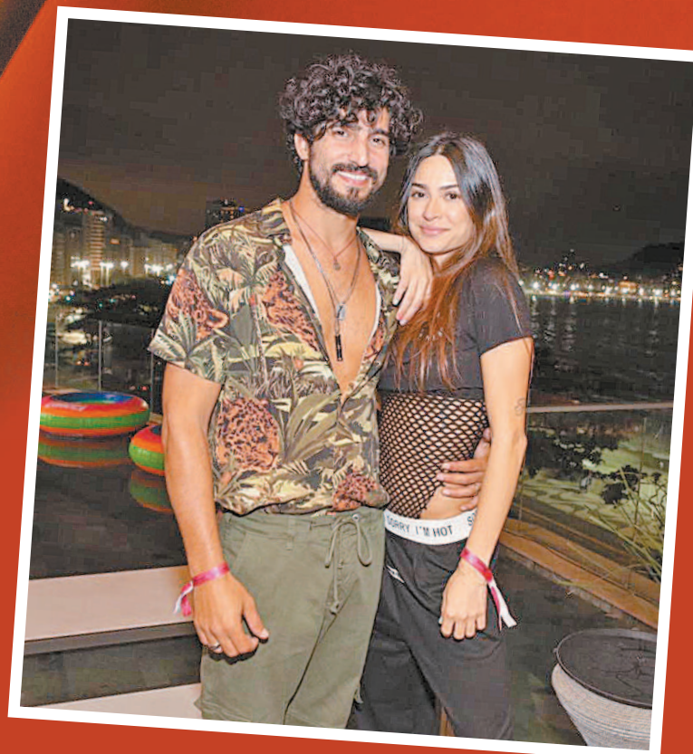
Thaila Ayala em cenas como a rebelde modelo Amanda de 'Ti Ti Ti'; abaixo, a atriz com o marido, Renato Góes