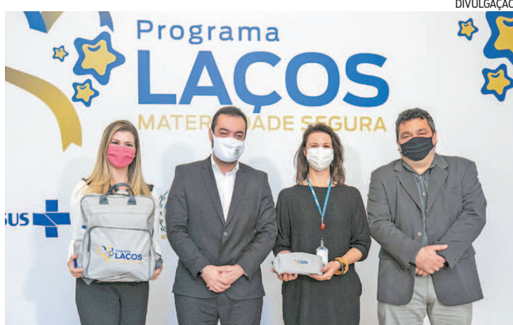
Maternidade Segura promete investir R$ 150 milhões por ano

“O cuidado com a mulher deve ser algo pensado em primeiro plano. Nesse processo de retomada do Rio, em que falamos tanto de desenvolvimento econômico, a gente não podia deixar de ter uma política eficaz para a mulher e seu bebê. Estamos focados nas questões hospitalares, de saúde de um modo geral, e vejo esse programa com muita alegria, pois tenho certeza que a mulher vai se