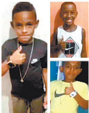
TJRJ aceitou denúncia do MP