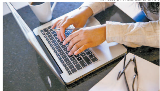
Aulas das instituições serão on-line e ministradas em tempo real