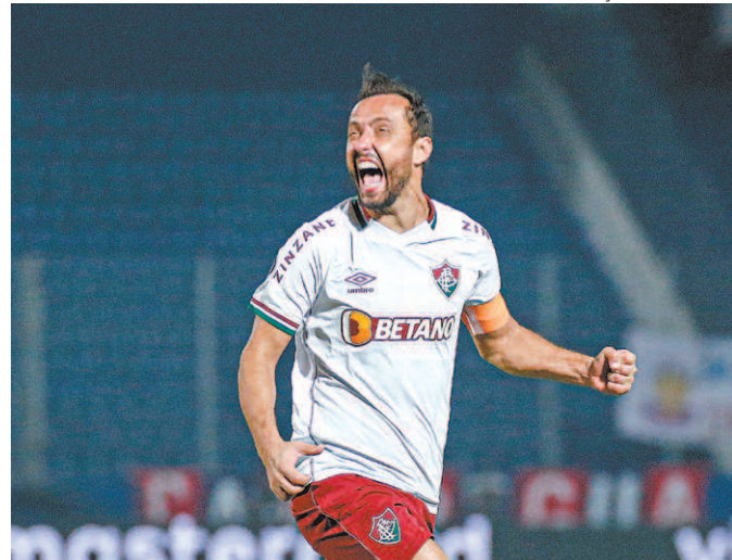
Nenê segue quebrando paradigmas e mostrando sua importância