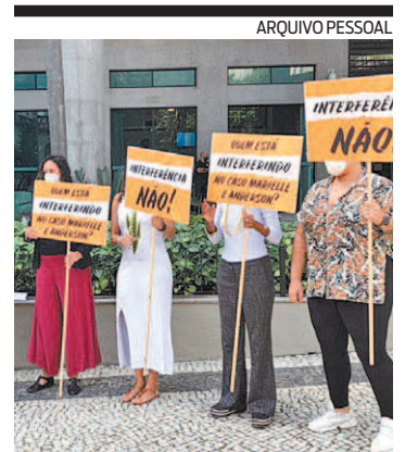
Famílias reunidas no MP