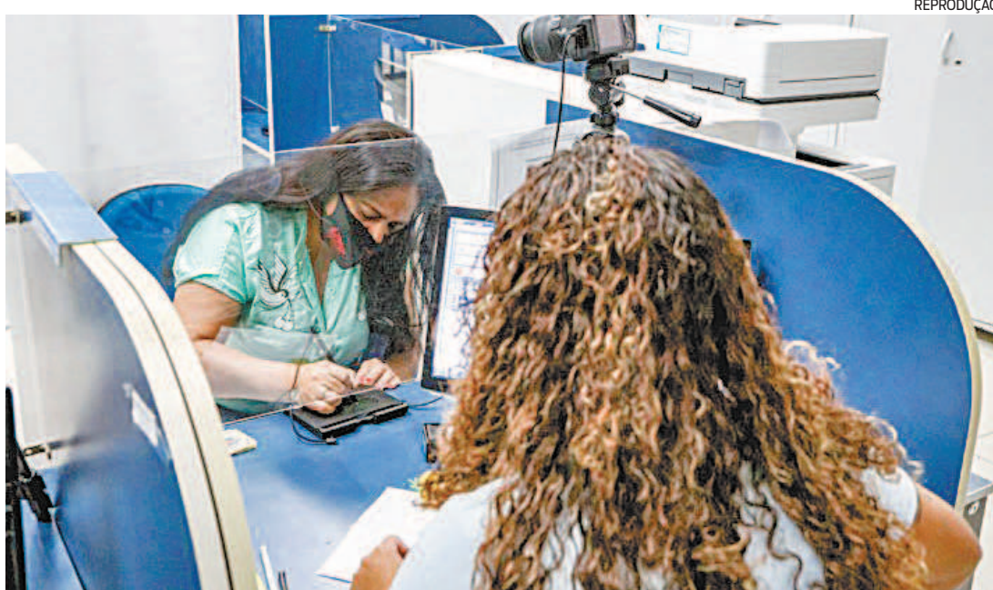
O Detran pede aos usuários que desmarquem com antecedência se não puderem ir no dia agendado

Serão disponibilizados serviços de identificação civil, veículos e habilitação