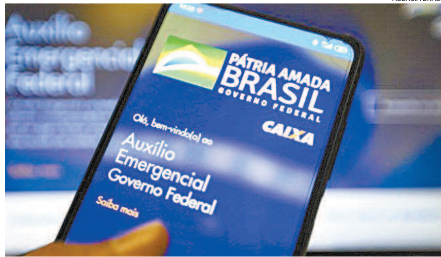
Quem recebe qualquer tipo de benefício do governo, com exceção do Bolsa Família e o abono salarial, não tem direito ao auxílio emergencial

Segundo as regras estabelecidas pela portaria, o desconto será, no máximo, de 30% sobre o pagamento feito mensalmente pelo INSS. “Os débitos serão apurados por competência de recebimento acumulado, corrigidos monetariamente pelo mesmo índice utilizado para os reajustamentos dos benefícios do Regime Geral de Previdência Social – RGPS e lançados na forma de consignação automática”, diz um trecho do texto da portaria.