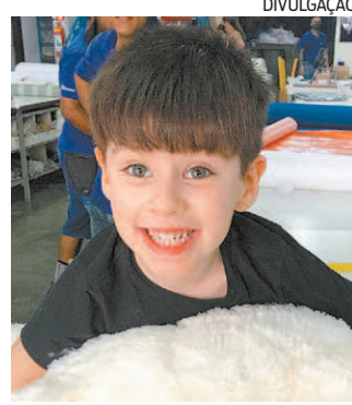
Homenagem para Henry

Para aderir ao novo projeto, os municípios devem assinar um termo e se comprometer a fazer um monitoramento quinzenal de crianças nascidas expostas ao HIV ou à sífilis. Também devem inserir leitos de alto risco no sistema de regulação estadual.