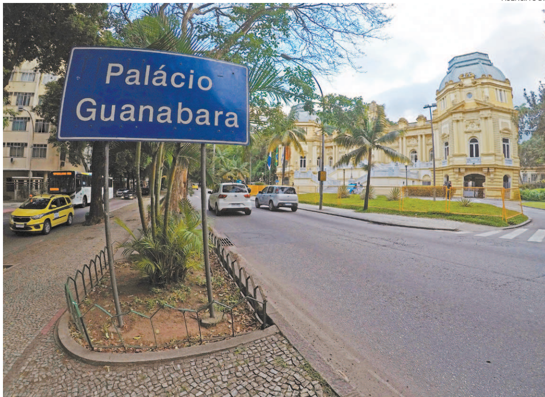
Entrega da declaração é obrigatória para os servidores públicos do Poder Executivo do Estado do Rio

PESSOAL DA ATIVA O Sispatri foi instituído pelo Decreto estadual 46.364, publicado em 2018. A obrigatoriedade da declaração de bens vale apenas para o pessoal da ativa: servidores públicos estáveis e comissionados.