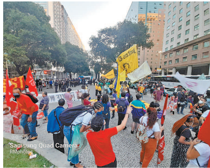
Pessoas também seguravam cartazes pedindo o impeachment

Um vídeo feito pelo DIA mostra os protestantes carregando diversas bandeiras enquanto gritam: “Povo na rua, Bolsonaro vai cair.”