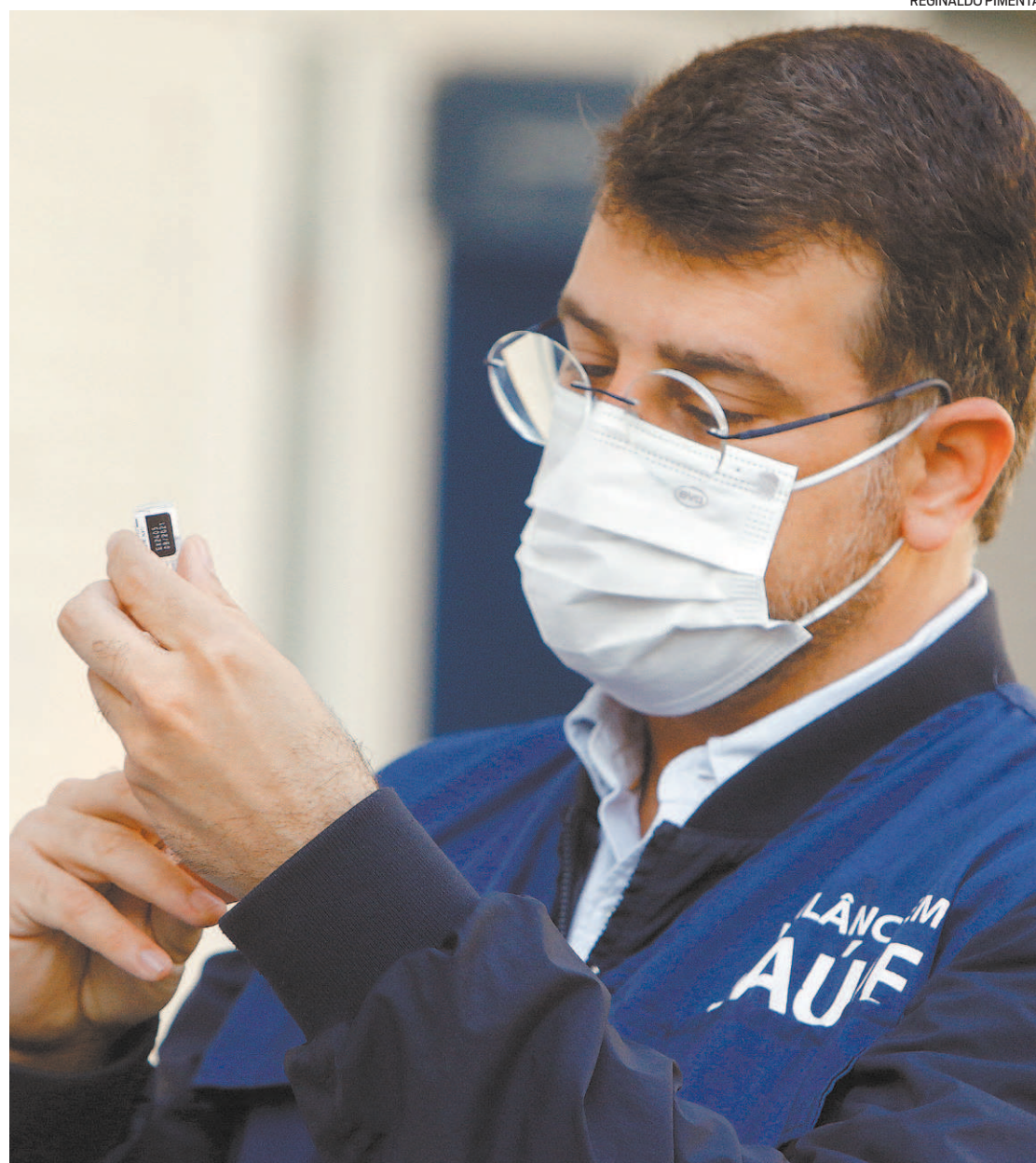
Soranz descartou a possibilidade de antecipar a vacina contra a covid-19 para idosos e comorbidades