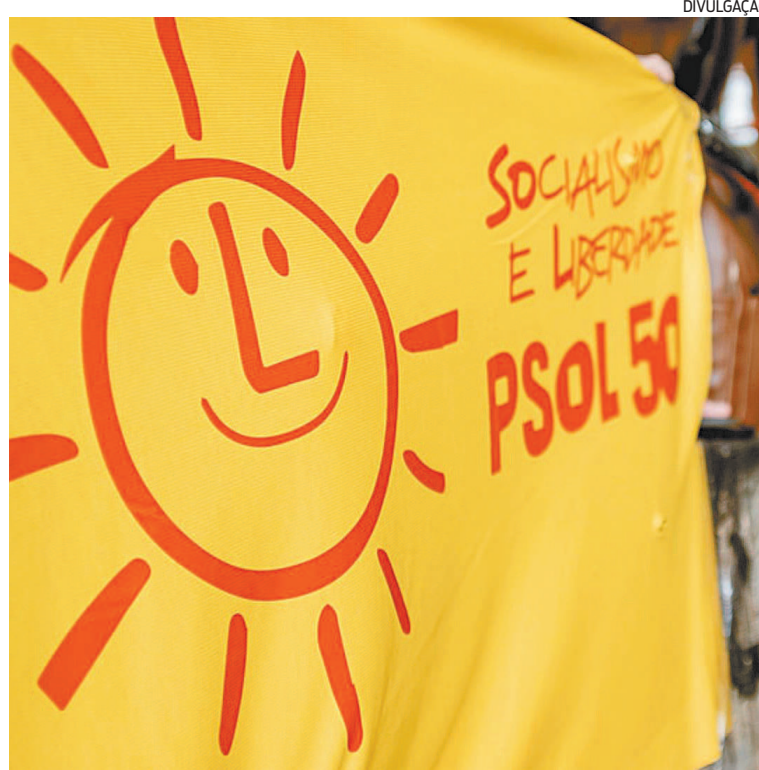
PSOL ainda não definiu se terá candidato a governador em 2022

A legenda só deverá definir seu posicionamento para o governo do estado na véspera do início da campanha. Até lá, muitos debates, assembleias e congressos para definir como o PSOL vem. Segundo uma fonte psolista ouvida pela coluna, há um grupo no partido que defende apoio a uma candidatura de frente ampla no Rio, mas mantendo Guilherme Boulos como cabeça de chapa em São Paulo. No entanto, pode depender de até onde essa frente vai. “Se abrir muito, incluindo partidos de direita, as chances do PSOL não entrar são muito grandes”.