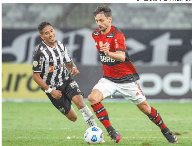
O jogo no Mineirão começou agitado, mas o Galo soube definir o duelo