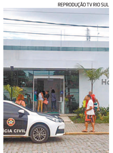
A 167ª (Paraty) investiga caso

De acordo com a vítima, após ser rendido, ela foi levada para a região conhecida como Ilha das