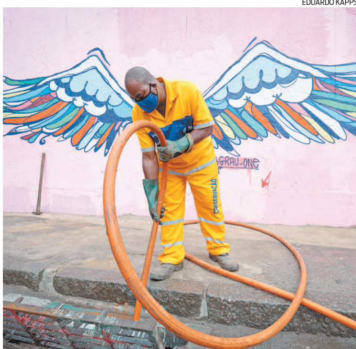
Operação ajuda na prevenção de alagamentos na cidade do Rio

Com 16 garis e o apoio da Secretaria Municipal de Conservação, a Comlurb limpou 83 ralos na Avenida Presidente Vargas, no Centro; 60 na Avenida Armando Lombardi, na Barra da Tijuca; 15 na Rua Silva Freire, e