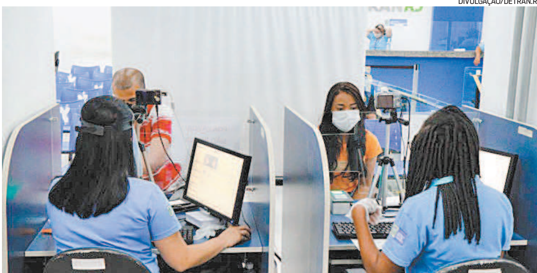
Serão oferecidas 8.090 vagas para serviços de identidade, habilitação e registro de veículos

Para ser atendido, o usuário deve marcar os serviços pelo site do Detran ( www.detrans.rj.gov.br ) ou pelo teleatendimento, nos