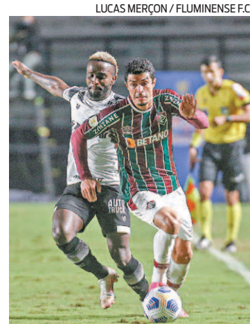
Ceará soube resistir à pressão

No intervalo, Roger Machado tentou aparar