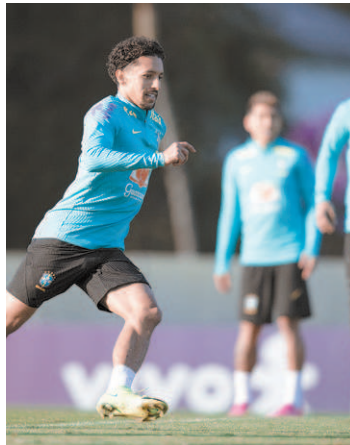
Marquinhos atento a Messi

“É uma fera (Messi), um grande jogador, que pode desequilibrar o jogo, tem que ter um cuidado muito grande, não só com ele, mas com to-