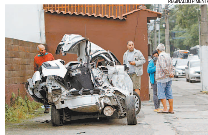
Carro do casal ficou destruído após acidente em via de Niterói