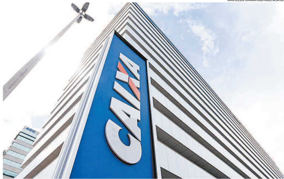
Aqueles que preferirem podem comparecer a uma das agências da Caixa para solicitar o encerramento

A conta Poupança Social Digital é uma poupança simplificada, sem tarifas de manutenção, com limite mensal de movimentação de R$ 5 mil. A movimentação do valor pode ser realizada