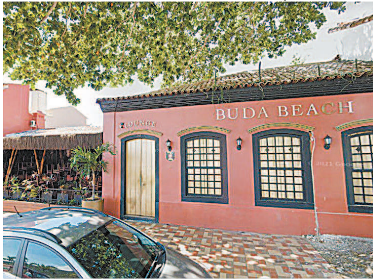
Mulher diz que crime ocorreu na 'área vip' da boate, em Cabo Frio

O deputado Poubel gravou vídeo em que afirma não ter visto "qualquer tipo de agressão", e que não é homofóbico. "Tenho pessoas no meu gabinete que são homossexuais", disse. Poubel disse não ter sido notificado para depor, mas que irá procurar a polícia para esclarecimentos. "Estava no local, sim, cuidando de questões administrativas. Não presenciei qualquer tipo de agressão e repúdio violência".