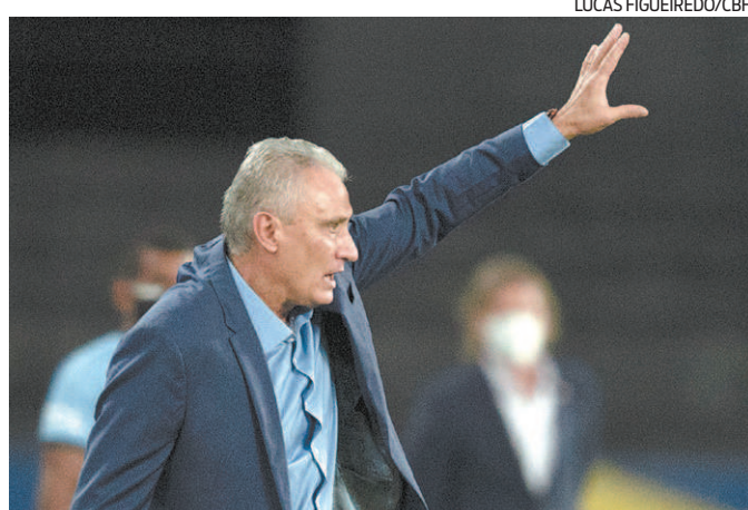
Tite comanda a seleção brasileira contra a Argentina, no sábado