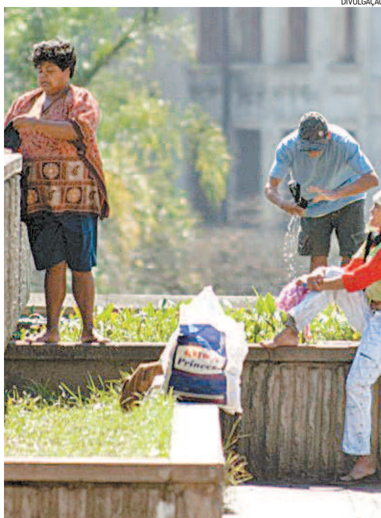
Estudo mostra maior queda da felicidade entre população mais pobre

Sobre medidas subjetivas de bem-estar, resultado de respostas diretas das pessoas sobre a sua vida, o levantamento indaga, numa escala 0 a 10, a opinião dos pesquisados. O Brasil tem uma queda de 0,4 pontos, em 2020, chegando a 6,1, o menor ponto da série histórica desde 2006. A queda da felicidade se dá nos 40% mais pobres (-0,8%) e no grupo do meio (-0,2) situados entre 40% a 60% da renda. Já os grupos mais abastados mantiveram a satisfação com a vida. Ou seja, há aumento da desigualdade de felicidade na pandemia. A diferença de satisfação com a vida entre os extremos de renda era de 7,9%, em 2019, e sobe para 25,5%.