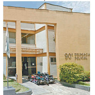
Operação com parceria da 90ª DP

O Ministério Público do Rio, por meio do Grupo de Atuação Especial de Combate ao Crime Organizado (GAECO/MPRJ) e da Promotoria de Investigação Penal de Barra Mansa, em parceria com a 90ª DP (Barra Mansa), promoveu ontem operação contra o tráfico de drogas em municípios do Sul Fluminense e da Costa Verde. A ação, nomeada de ‘Futebol Clandestino’, cumpriu 87 mandados de prisão preventiva e 112 de busca e apreensão em diversos municípios. Até o início da manhã, 36 pessoas foram presas. Entre os denunciados estão 20 mulheres e 67 homens.