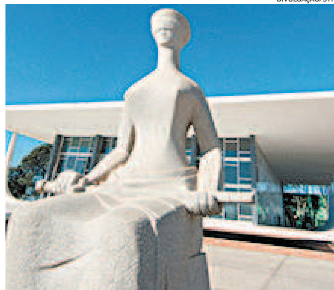
Ação foi apresentada na semana passada ao Supremo