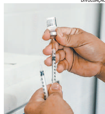
Município aguarda novas doses

Segundo a prefeitura, todos que receberam a 1ª dose em 14 de abril deveriam comparecer a um dos postos de Saúde para completar o programa vacinal ontem. O Estado do Rio distribuiria mais de um milhão de doses da vacina Oxford/Astrazeneca. No entanto, a quantidade deve ser usada para a continuidade da aplicação da segunda dose do imunizante em todos os municípios.