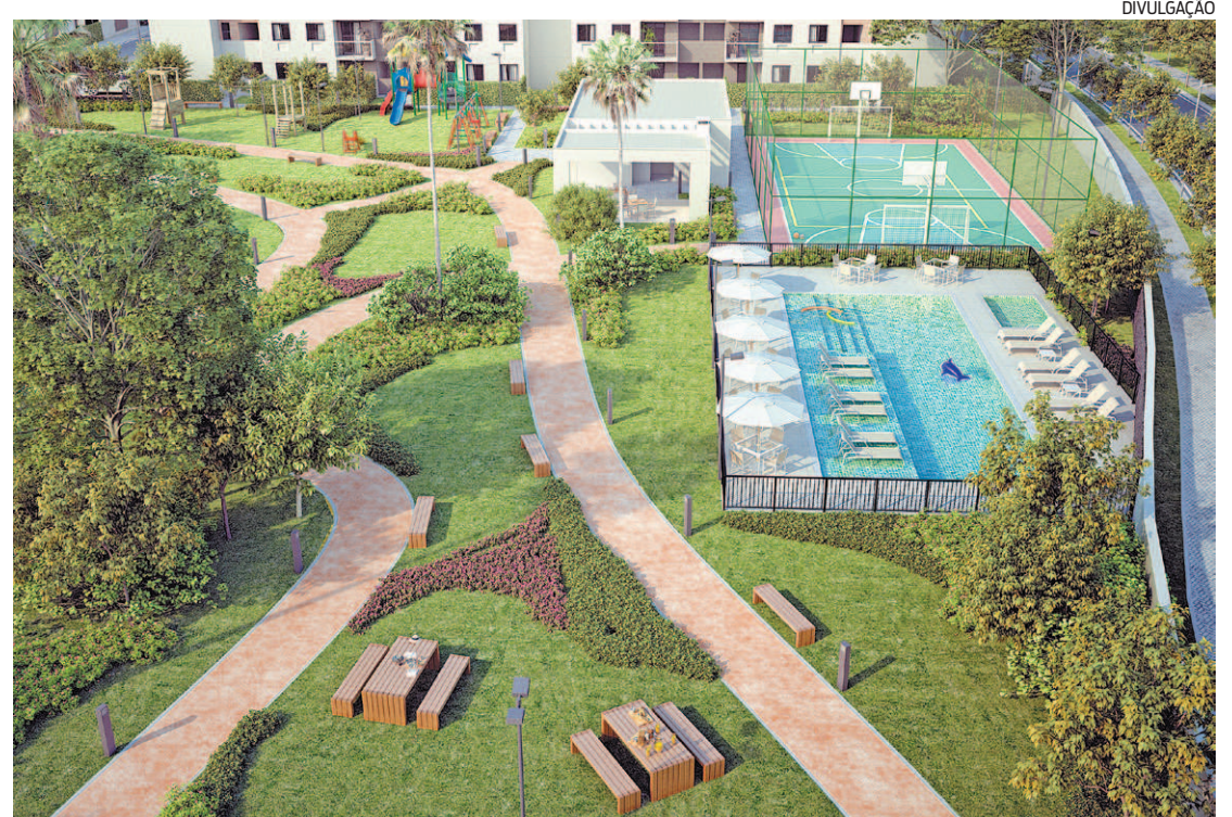
Empreendimento Vitale Eco, em Campo Grande, Zona Oeste, tem unidades a partir de R$ 193 mil

“O valor de R$ 180 mil vale tanto para apartamentos quanto para as unidades gardens”, comenta.