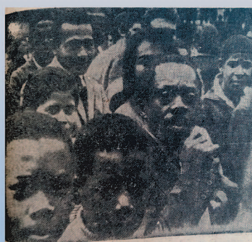
Grande Otelo levou seus filhos e cantou o Hino Nacional na Avenida Rio Branco