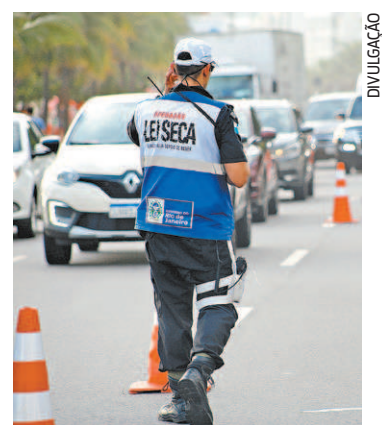
Blitz: medida depende de sanção