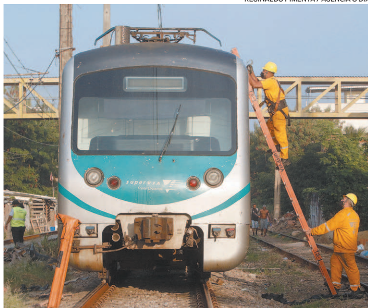
Incêndio no trem da Supervia em maio: serviço sofre com interrupções

Ontem, as partidas dos trens da Central ficaram 25 minutos paralisadas. Segundo relatos, os agentes tentavam localizar um homem que furtava grampos de trilhos próximo à Praça da Bandeira. Nos cinco primeiros meses do ano, a SuperVia registrou 125 casos de furtos de cabos de sinalização e de rede aérea. De janeiro a maio, foram furtados mais de 12 mil metros de cabos, segundo a empresa.