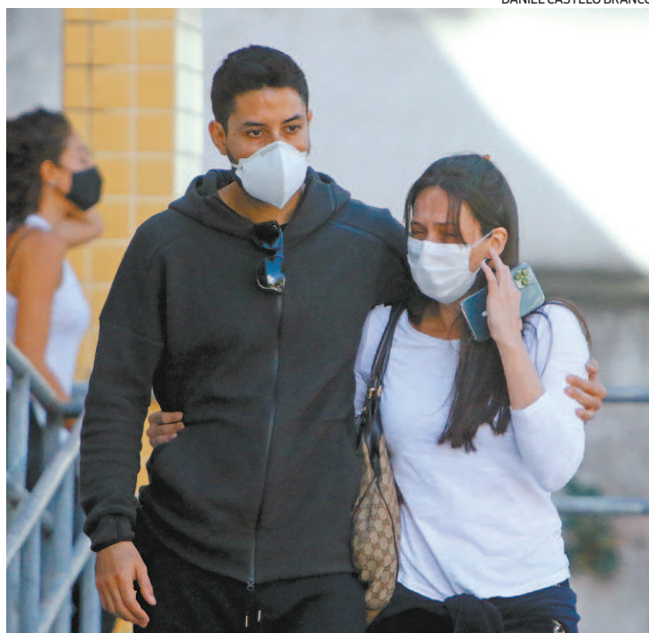
Família Nathalia foram ao IML para o reconhecimento do corpo

De acordo com o especialista em Gestão de Riscos, Gustavo Mello, o cheiro, uso de sabão nas válvulas e observar o medidor podem salvar vidas. “Vá no medidor de gás e verifique se está contando ou girando, se ele ainda está consumindo gás é porque você tem um vazamento na tubulação”, ensina Gustavo Mello.