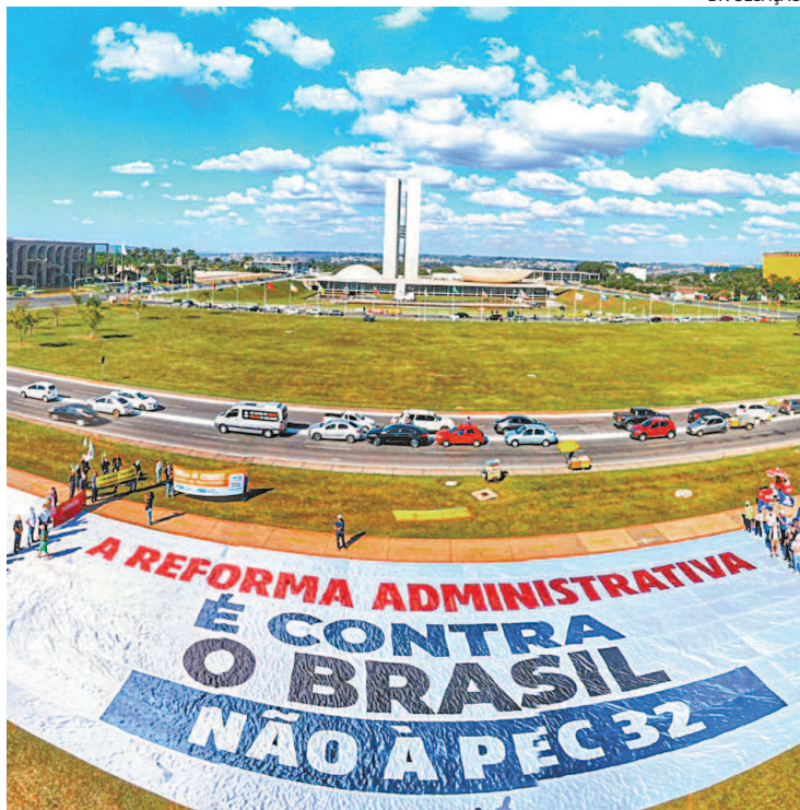
Servidores protestaram ontem contra a PEC em Brasília e outros locais

De acordo com o levantamento, serão pelo menos mais 207 mil cargos de livre nomeação em relação ao cenário atual. Segundo o estudo, há hoje, na União, 174.987 cargos em comissão e funções de confiança englobando todos os Poderes. Nos estados, são 180.702, e nos municípios, 559.642.