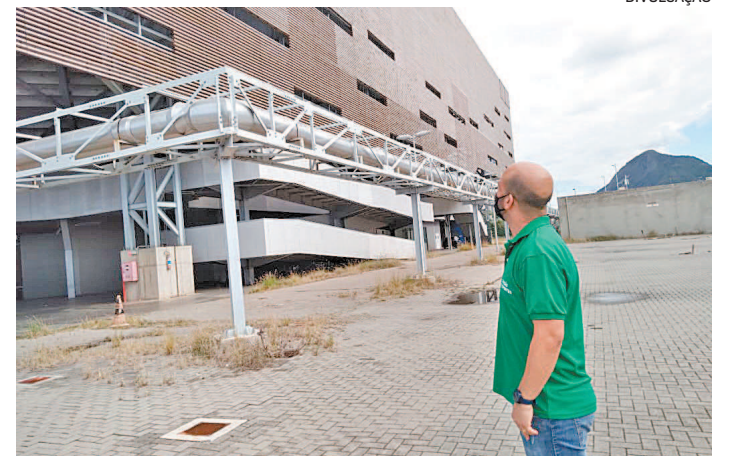
A Comissão de Esportes visitou as instalações do Parque Olímpico