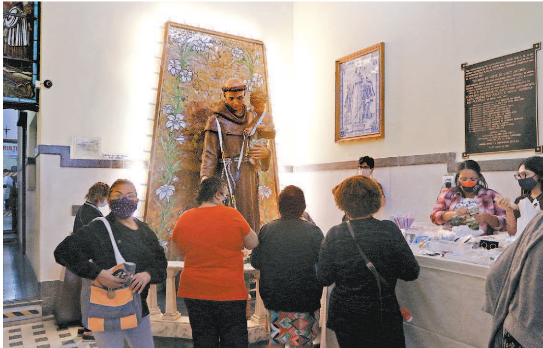
Nem a pandemia impediu que fiéis lotassem as igrejas do santo 'Casamenteiro' e 'Pai dos Pobres'

"A representatividade deles (pãezinhos) é porque Santo Antônio, em Coimbra, Portugal, abdicou de sua fortuna para se dedicar aos pobres, ajudando no milagre da multiplicação dos pães, com a ajuda de Jesus Cristo. Então as pessoas que buscam o pãozinho, não falta o pão nosso de cada dia. É o pão bento de