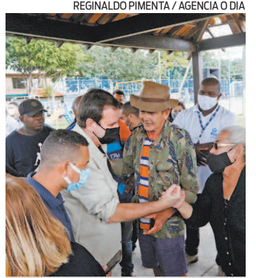
Paes esteve em Senador Camará

O prefeito Eduardo Paes afirmou que espera ver toda a população do Rio vacinada até o começo de setembro, um mês antes do previsto pela Secretaria Municipal de Saúde. Segundo Paes, a estimativa é devido a aceleração na entrega de vacinas contra a covid-19. "A gente tinha dado uma data de final ou meados de outubro, mas se continuar chegando vacina do jeito que está chegando agora, acho que no começo de setembro já esteja todo mundo vacinado", disse Paes ontem durante vistoria de praça em Senador Camará,