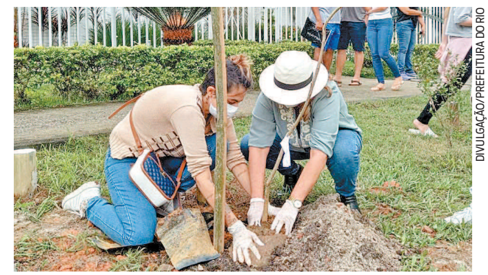
Ontem foram plantadas mais 20 árvores no primeiro Bosque da Memória do Rio, em homenagem às vítimas da covid-19 e aos profissionais de Saúde. O espaço foi inaugurado no sábado.

Chegou o SuperaRJ, o auxílio emergencial do Governo do Estado. É comida na mesa de quem mais precisa.