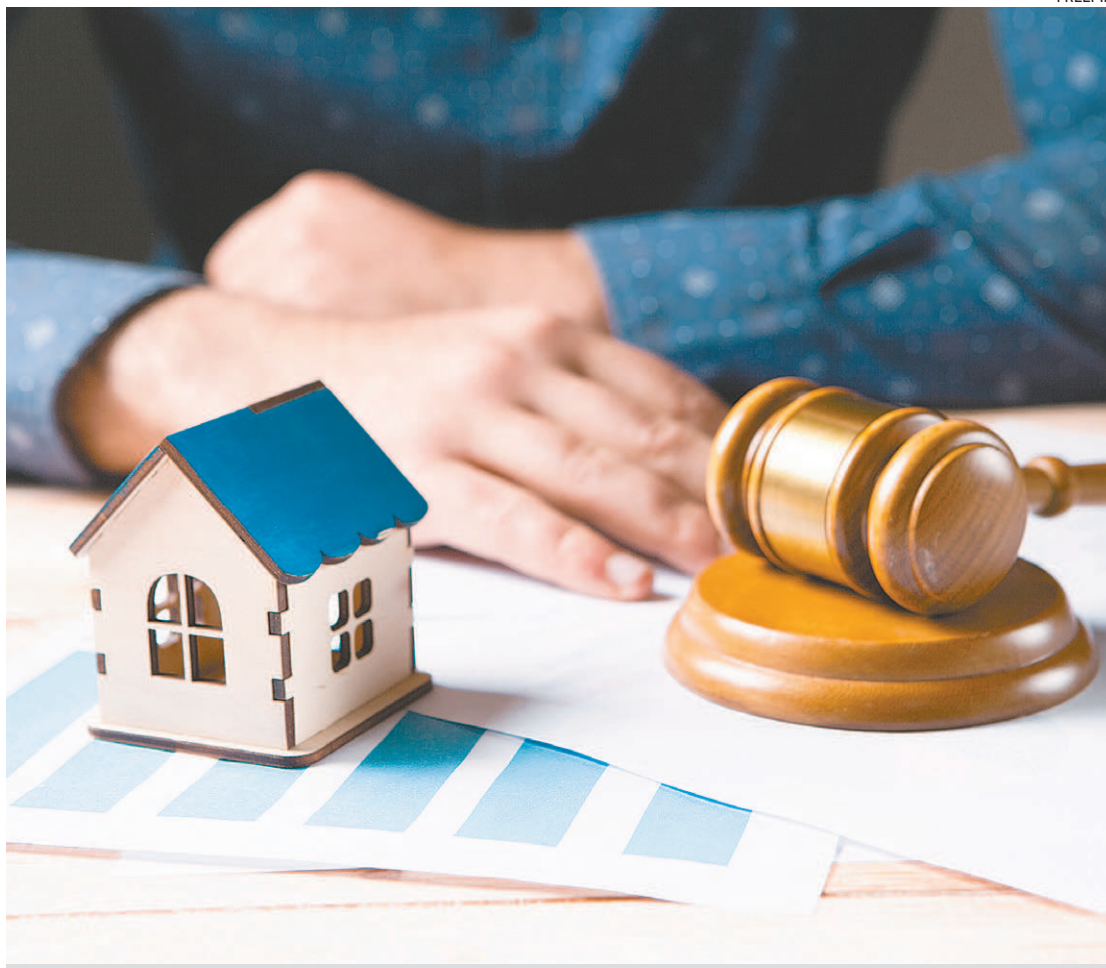
O patrimônio vira espólio: conjunto de bens, direitos e obrigações que integram o patrimônio do falecido

Barroso adverte que “é importante ter conhecimento da existência de seguros de vida, contas bancárias e situação do falecido no INSS.