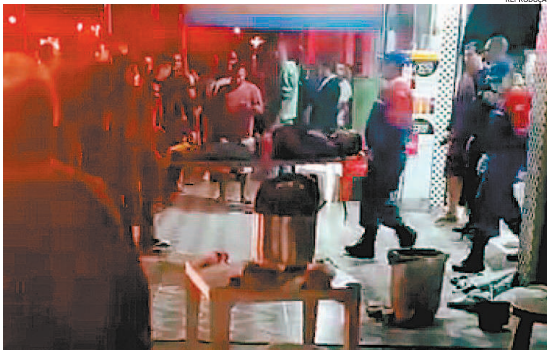
Segundo testemunhas, homens armados passaram em um carro não identificado e efetuaram os disparos

As investigações estão sob responsabilidade da 121ª DP (Casimiro de Abreu). A polícia apura a motivação do ataque. Ainda não se sabe quem era o alvo dos bandidos. A polícia não divulgou