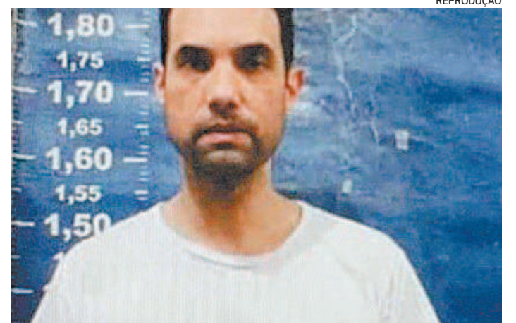
Jairinho é acusado de homicídio qualificado contra o enteado Henry

A demolição é totalmente manual por conta das limitações de acesso de máquinas ao trecho da via. O trabalho deve ser retomado hoje, às 9h. Os agentes da Defesa Civil interditaram de forma preventiva um prédio de quatro pavimentos ao lado. As famílias impactadas pelas interdições estão sendo cadastradas na Secretaria de Assistência Social, que avalia as necessidades dos moradores.