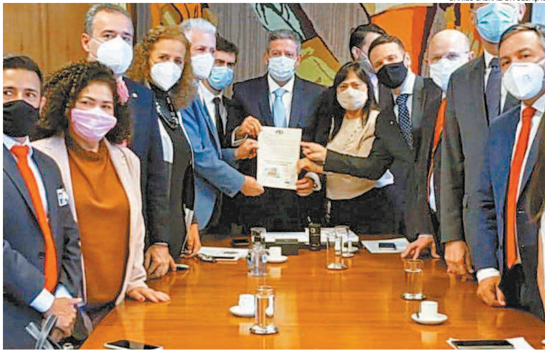
Oposição entregou a Arthur Lira documento com mais de 100 mil assinaturas contra a reforma administrativa

Ainda assim, congressistas apontam a pressão das categorias, principalmente das forças de segurança, como crucial para atrasar os trabalhos na comissão. O poder de articulação e influência das categorias no Parlamento vem sendo motivo de preocupação entre os deputados.