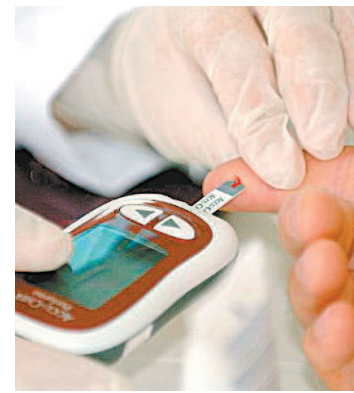
Vigilância do diabetes

Para Malafaia, a lei é um importante instrumento de saúde pública, inclusive na pandemia da covid-19, que poderá identificar antecipadamente as pessoas com maiores riscos de complicações e óbitos. Ainda de acordo com Samuel, o Rio é o primeiro estado do Brasil a legislar com esta metodologia, sendo que Nova Iorque já o faz desde 2005.