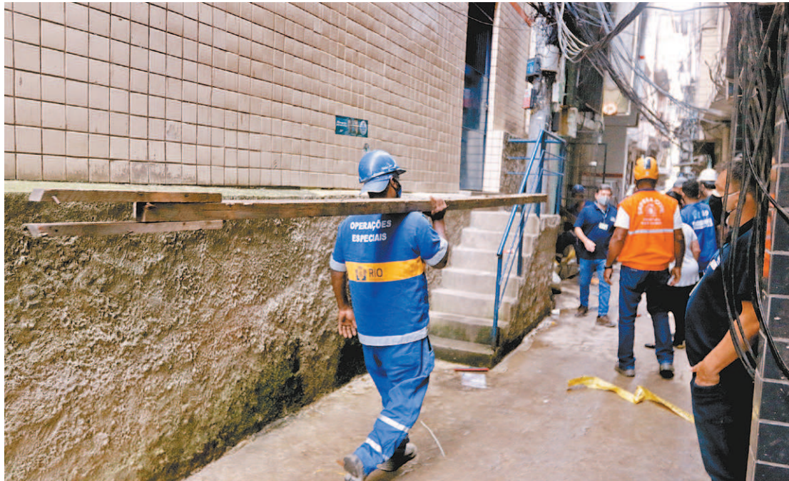
Prédio em Rio das Pedras, na Zona Oeste, foi interditado para demolição de dois pavimentos