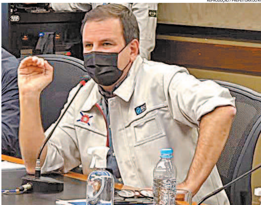
“Vamos usar máscara neste período de chuva e inverno, nós contraímos doenças respiratórias”, disse Paes

“É o seguinte, eu não tenho comentário político sobre máscaras, eu tenho comentário técnico. A Secretaria de Saúde e as autoridades sanitárias do município recomendam o uso da máscara. Eu não tenho opinião política, por mim a minha opinião política era fazer um Carnaval amanhã e não ter que usar mais nada e estar todo mundo se abraçando no meio da rua, é isso que eu desejo. Mas esse desejo não pode ser maior do que o que dizem as autoridades sanitárias no município, então minha opinião não é política. A