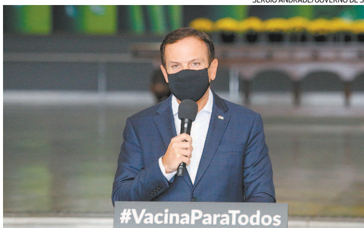
Doria: “São Paulo cresceu quase o dobro do crescimento do Brasil”

“Como é o estado mais populoso do país, há um efeito direto no dinamismo da Economia nacional, impulsionado tanto pela demanda quanto pela oferta. O estado abriga a maior parte da produção industrial nacional”, esclarece Thiago Sayão, economista e professor do Ibmec RJ.