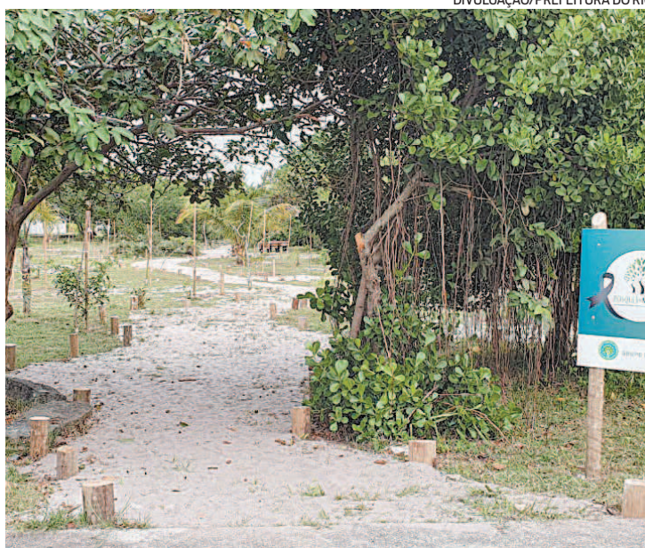
Cerimônias serão hoje e amanhã (10h às 11h30) sem aglomeração

Mudas de ipê amarelo, guirri, pau-brasil, pitanga, grumixama, graviola, caju, acerola, aroeira e amora foram doadas por parentes e amigos das vítimas, respeitando o bioma local da Alameda, a vegetação nativa de restinga. Segundo a arquiteta Isabelle de Loys,