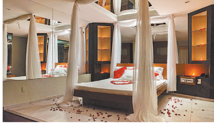
Suíte do Shalimar, em São Conrado: protocolos serão seguidos