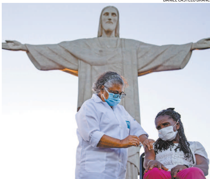
Especialistas alertam para riscos de não tomar a segunda dose

Reportagem do estagiário Jorge Costa , sob supervisão de Thiago Antunes