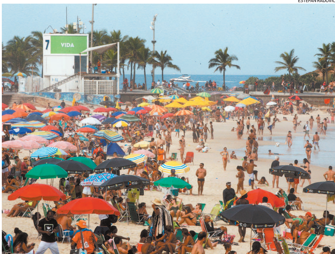
Desrespeito ao distanciamento: praias do Arpoador e Ipanema, na Zona Sul, ficaram lotadas ontem

"Muitas razões podem ser responsáveis por essa abstenção. Talvez alguns tenham tido covid-19 entre uma e outra dose e estejam completando o prazo de 30 dias pós-covid. Outros