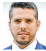
Rodrigo Amorim deputado estadual do PSL-RJ

No início de maio, o governador Cláudio Castro sancionou a lei 9.264, de minha autoria, que estabelece a prioridade na vacinação contra covid-19 daqueles que são responsáveis por cuidar de pessoas com transtornos, deficiências e condições genéticas que demandem atenção especial. Desde o início da pandemia que sabemos haver grupos mais vulneráveis – além dos idosos, primeiro grupo vulnerável a ser identificado, devido aos acontecimentos trágicos na Itália.