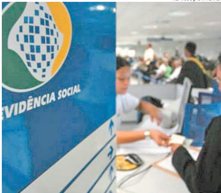
Valor de benefício pode ficar abaixo do esperado devido à escolha errada

Para quem já chegou a receber o primeiro pagamento, o advogado informa que mesmo na Justiça não se consegue o direito à desistência nesses casos. Mas ele explica que o segurado pode