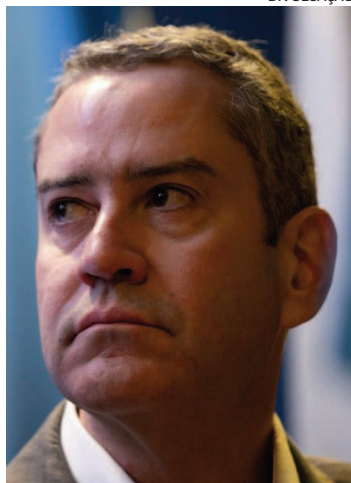
Caboclo: afastado por 30 dias

Na reportagem do 'Ge.com', a funcionária afirma, em documento, que tem como pro-