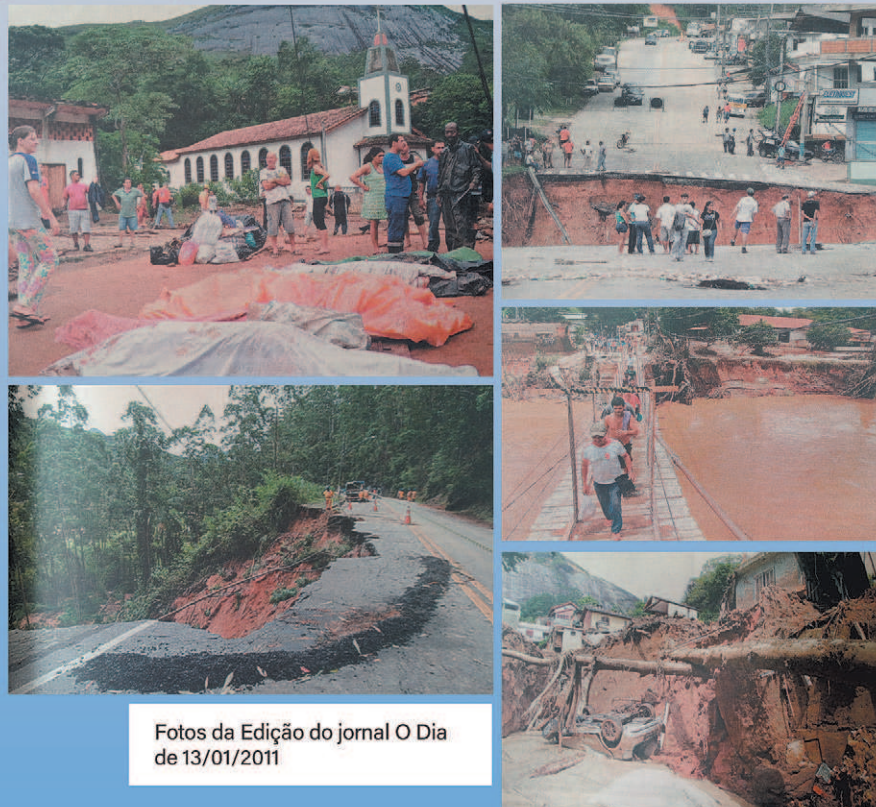
Fotos da Edição do jornal O Dia de 13/01/2011