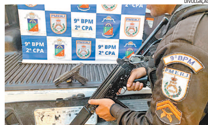
PMs apreenderam arma na comunidade do Jorge Turco