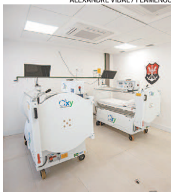
Investimento em estrutura