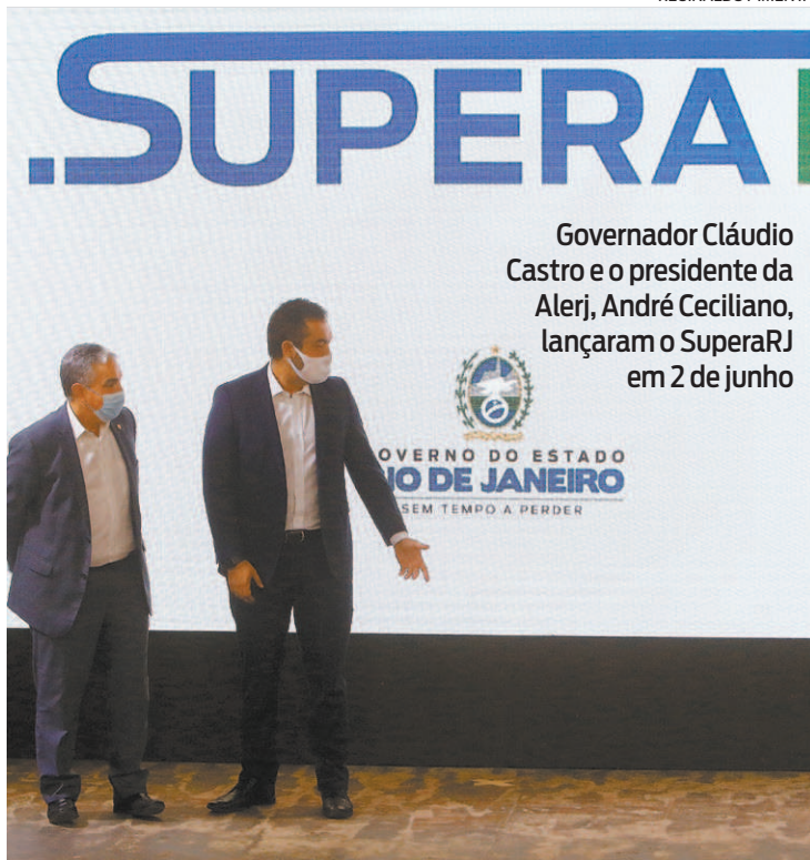
Governador Cláudio Castro e o presidente da Alerj, André Ceciliano, lançaram o SuperaRJ em 2 de junho

A previsão inicial de investimentos é de mais de R$ 86 milhões por mês. A partir do próximo dia 25, o estado inicia o pagamento