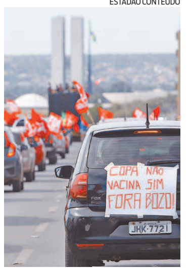
Manifestação tomou a capital

Manifestantes criticaram evento no país em meio à pandemia