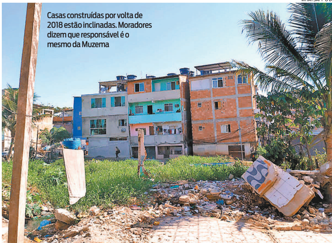
Casas construídas por volta de 2018 estão inclinadas. Moradores dizem que responsável é o mesmo da Muzema