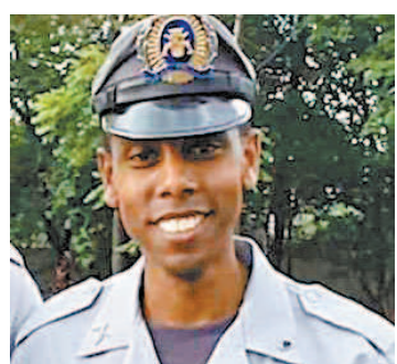
Soldado desapareceu em maio

A realização da competição se tornou uma questão política no Brasil em um momento em que os índices de mortes pelo novo coronavírus seguem altos.