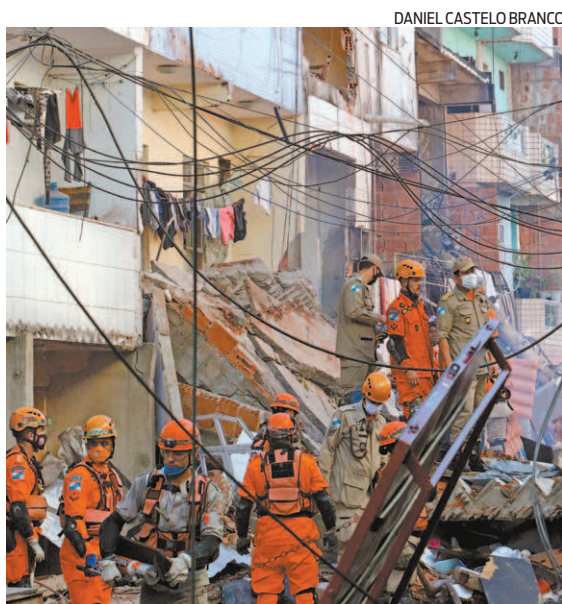
Prédio desaba em Rio das Pedras, na Zona Oeste

Rio das Pedras é um bairro de pessoas que