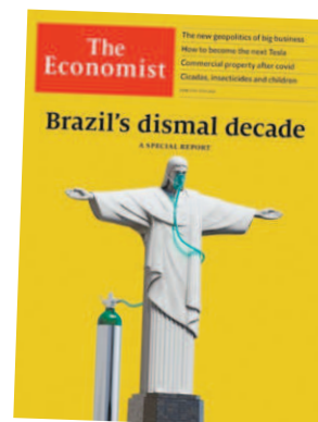
Capa da revista The Economist

Década sombria do Brasil. Lamentável o Brasil ser retratado dessa forma para o mundo. Ruim para a imagem, péssimo para atrair investimentos, que tanto precisamos para uma retomada econômica.