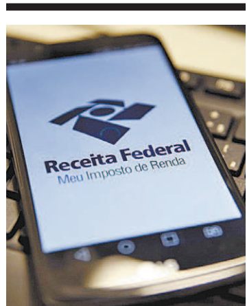
Consulta é feita pela internet

Os golpes mencionados acima são exemplos de fraudes que usam engenharia social, que consiste na manipulação psicológica do usuário para que ele forneça informações confidenciais, como senhas e números de cartões, para os criminosos, ou faça transações em favor das quadrilhas. Atualmente, 70% das fraudes estão vinculadas à engenharia social.