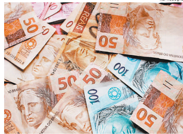
Entrega começa amanhã para moradores da Região Metropolitana