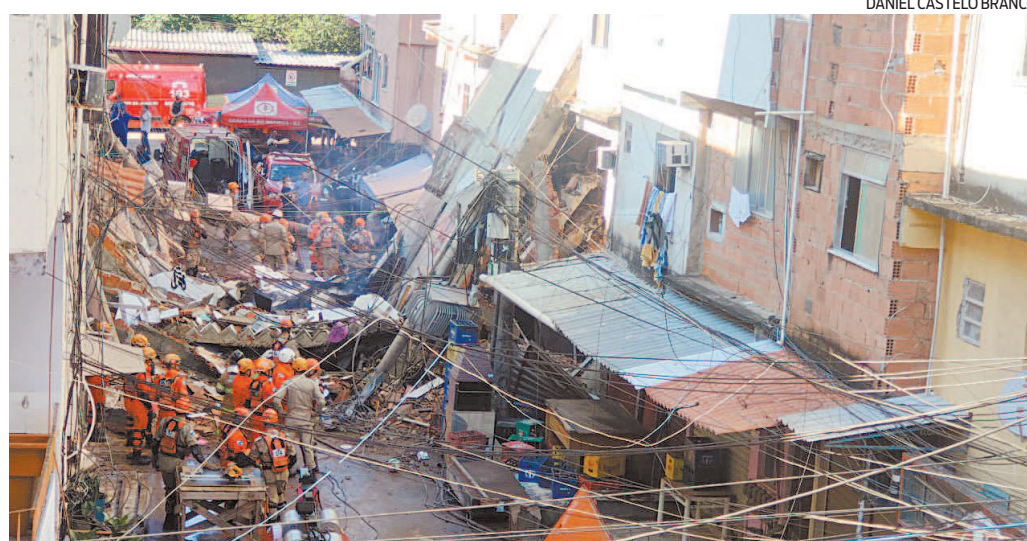
Desabamento de prédio em Rio das Pedras deixou pai e filha mortos sob os escombros