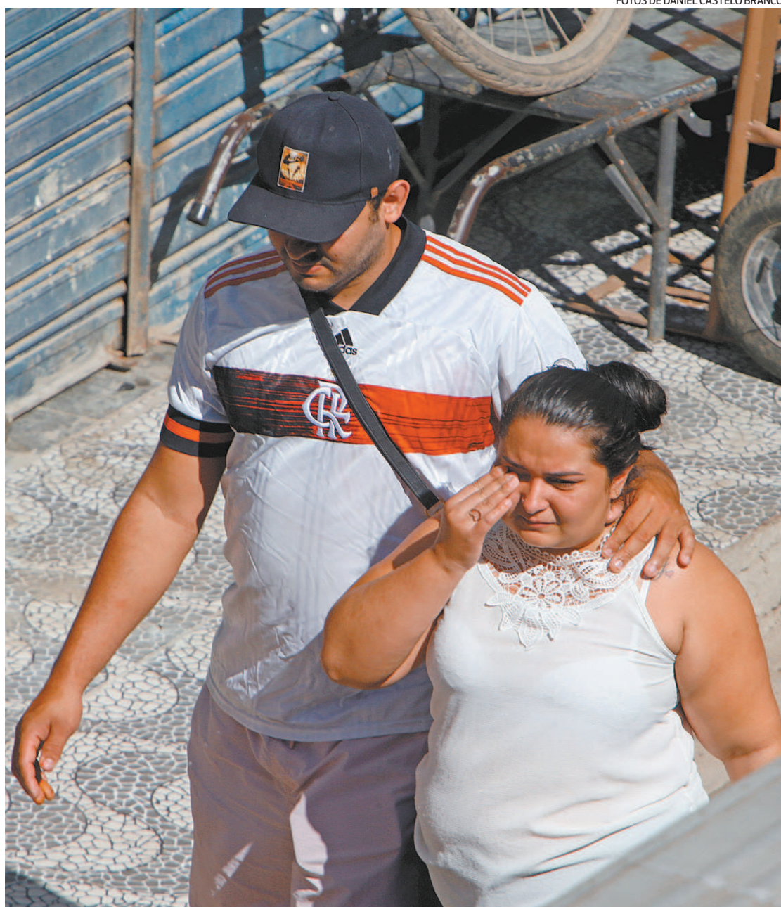
Familiares e amigos das vítimas se emocionaram e acompanharam resgate feito pelos bombeiros