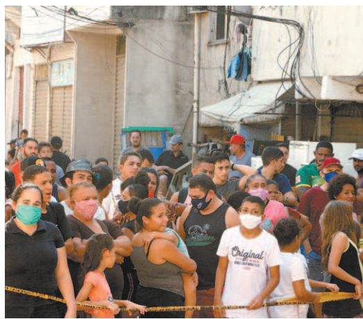
Vias próximas à Rua das Uvas foram bloqueadas