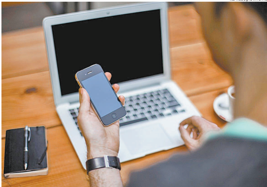
Falsas premiações, falsas vagas de emprego e golpes bancários estão nas categorias que fizeram mais vítimas

Entre ações criminosas que agora serão punidas com a lei estão as fraudes por meio de transações digitais, além dos golpes, como o da clonagem do WhatsApp, do