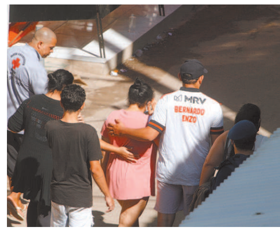
Moradores também foram atendidos em ambulâncias