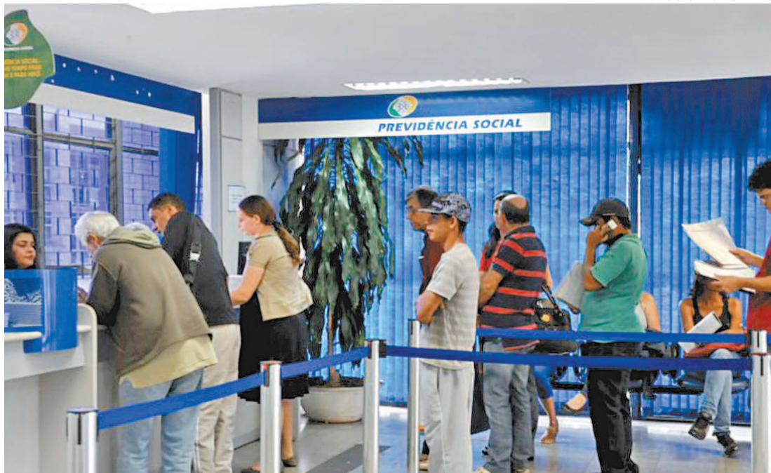
A partir do dia 10 deste mês, a alteração vai começar a valer para os segurados que fizerem a solicitação

Com a definição em dezembro, com a relatoria do STF do ministro Alexandre de Moraes, os novos prazos para o INSS colocar em prática passam a valer em seis