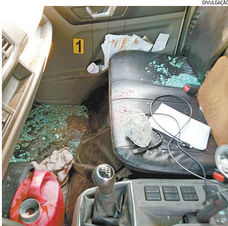
Empresa repudia a atitude e está dando toda assistência à equipe

Em nota, a Light informou que repudia os episódios de agressões contra prestadores de serviço.