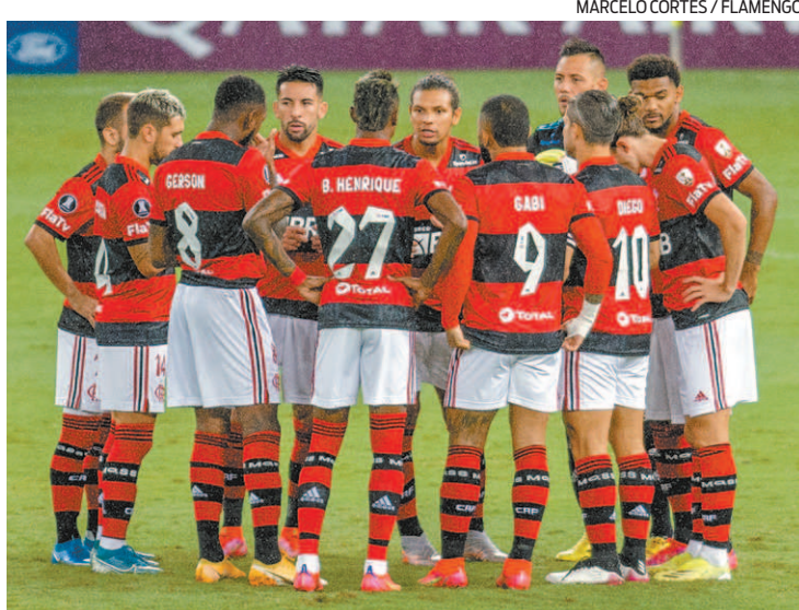
Flamengo aparece como favorito para conquistar seu nono título

é grande, já que as duas equipes se enfrentaram em abril, na Supercopa do Brasil, e fizeram o melhor jogo da temporada no futebol brasileiro até aqui. Após o empate em 2 a 2 no tempo normal, Diego Alves brilhou na cobrança de pênaltis e garantiu o título do time carioca no Estádio Mané