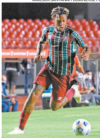
Placar em branco no Morumbi