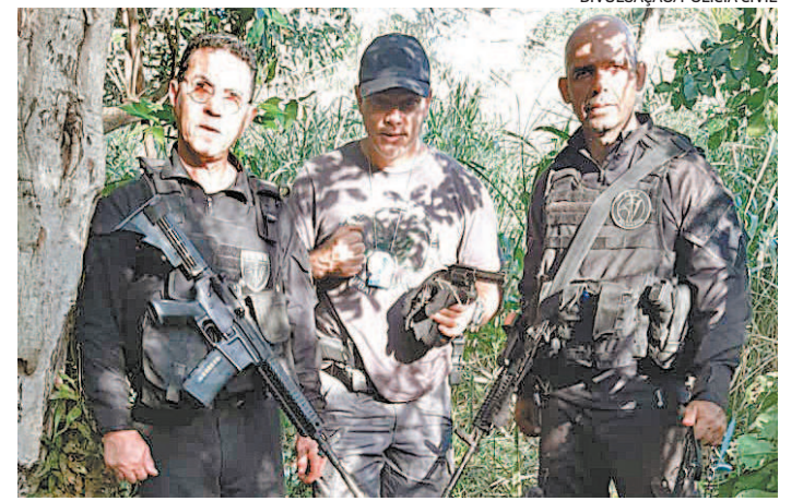
Ação ontem foi realizada por agentes da 124ª DP (Saquarema)

A ocorrência foi registrada na 128ª (Rio da Ostras). O grupo irá responder por tráfico de drogas, posse ilegal de arma compartilhada e associação para o tráfico.