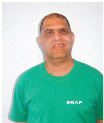
Pastor comemorou absolvição