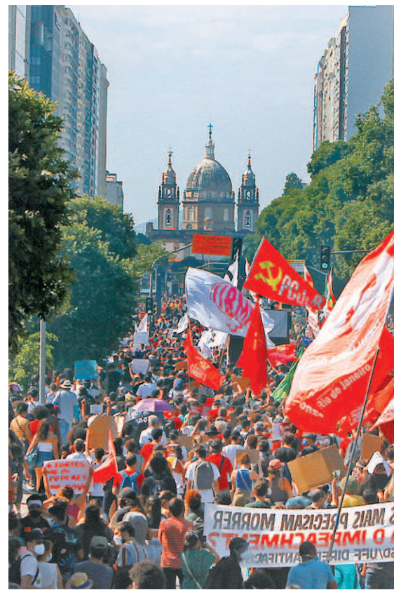
Manifestantes se reuniram ontem no Centro do Rio para protestarem contra o presidente Bolsonaro

A Prefeitura do Rio finalizou ontem a imunização contra a covid-19 dos grupos prioritários, destinada a pessoas com comorbidades, segundo a lista do Plano Nacional de Imunização (PNI), pessoas com deficiência permanente, trabalhadores da saúde, trabalhadores envolvidos diretamente nas ações de combate à covid-19 e guardas municipais.