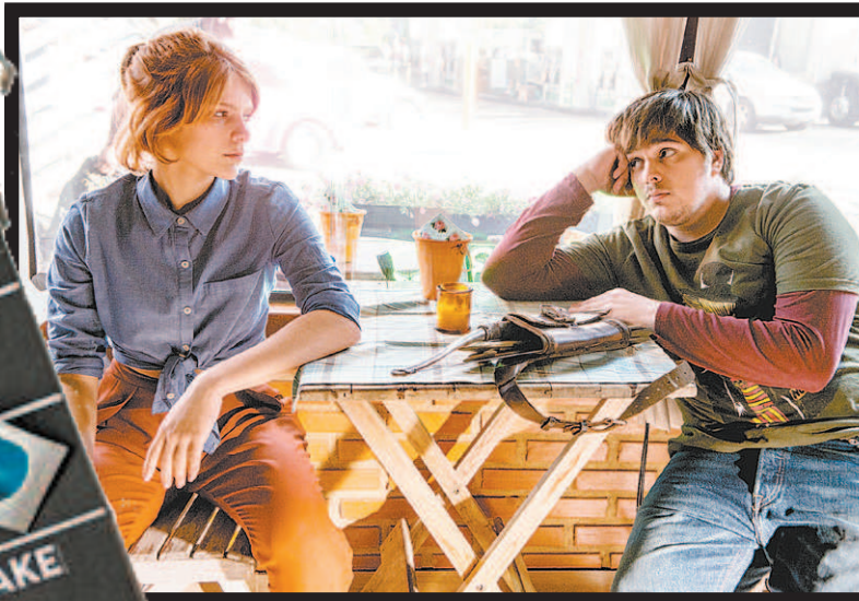
Isabella Santoni e Lucas Salles no filme 'Missão Cupido'