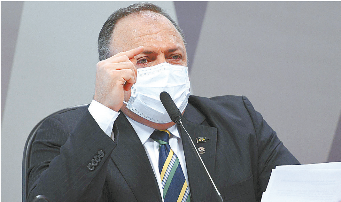
Ex-ministro da Saúde, Eduardo Pazuello, volta a depor hoje na CPI da Covid no Senado, em Brasília

Em depoimento, Pazuello afirmou que o presidente Jair Bolsonaro nunca lhe orientou a fazer nada diferente da forma como já estava atuando na gestão da Saúde. Ele