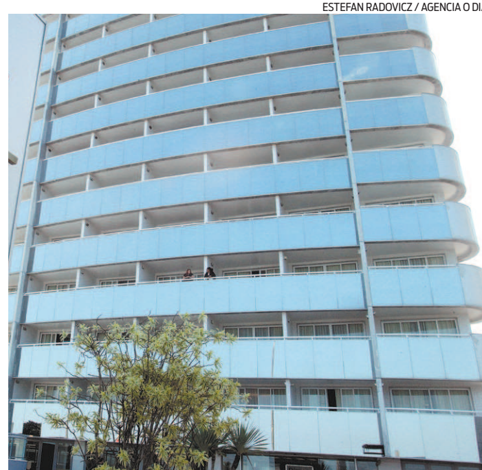
Hotel na Barra da Tijuca onde MC Kevin estava hospedado