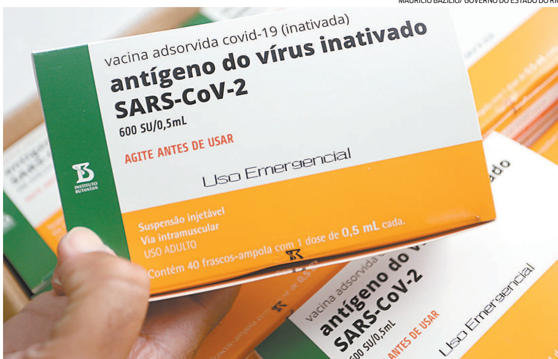
Vacinação: desde ontem, cidade do Rio faz a campanha com a chamada de duas faixas etárias por dia