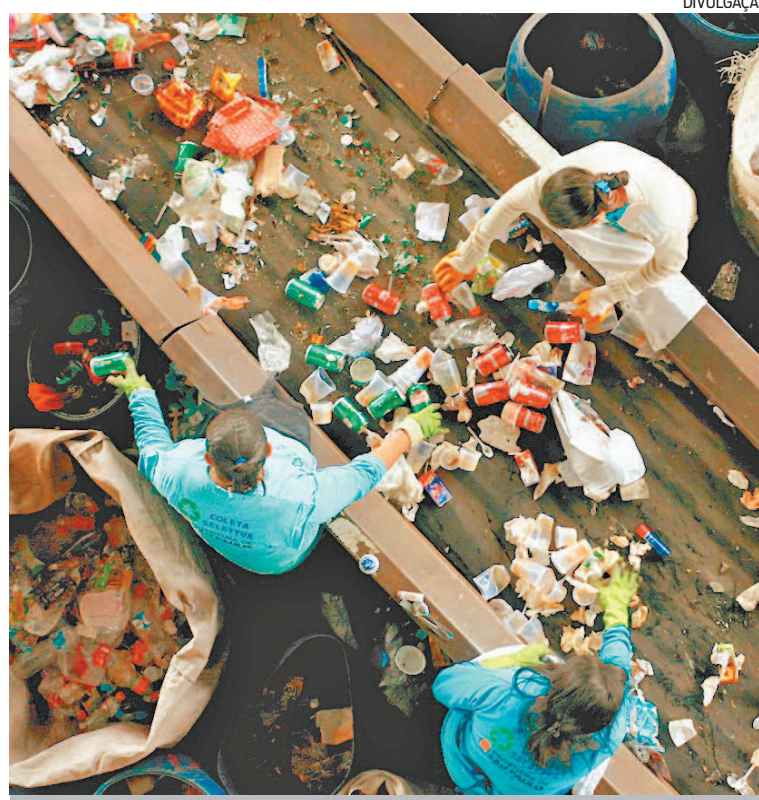
Catadores de material reciclável viram renda cair com pandemia.

Para o ambientalista Sérgio Ricardo, “estamos muito longe de ter uma cidade lixo zero”. Convidado durante a CPI do Lixo na Alerj há duas legislaturas, ele conta que nesse período nada foi feito. O ambientalista exemplificou com os catadores de material reciclável, categoria que viu a situação piorar na pandemia. “Eles não têm apoio, política pública. Na região metropolitana, são produzidas 17 mil toneladas de lixo por dia, sendo 10 mil só na capital. Desse montante, apenas 1% é reciclado, graças aos catadores. Chega menos material reciclável do que antes da pandemia, o que significa menos renda. Os catadores estão mais empobrecidos”.