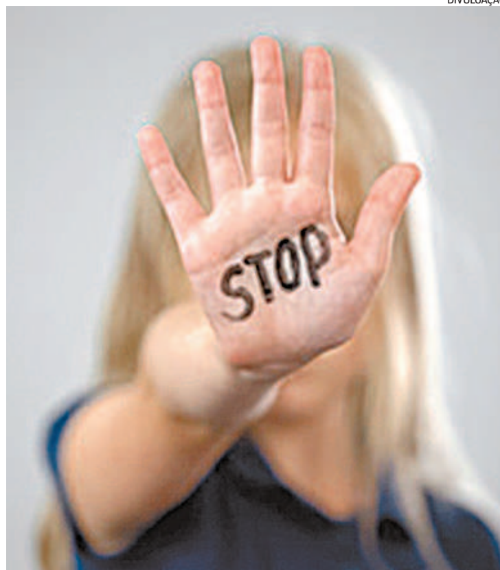
Psicóloga diz que as crianças dão sinais de algum tipo de violência