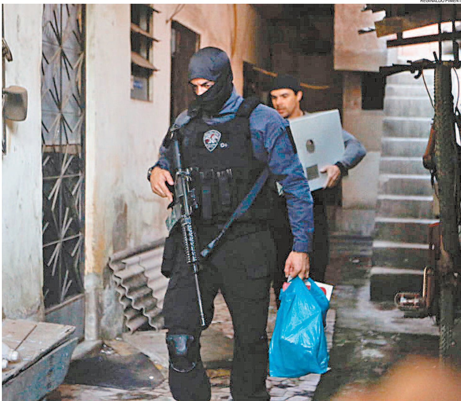
Ação da Delegacia da Criança e Adolescente Vítima (Dcav) ontem cumpriu mandados de prisão em diversos pontos do Rio de Janeiro

Até o ano de 2019, no Disque 100, 86 mil denúncias foram registradas, sendo 17 mil de abusos sexuais, ou seja, 11% dos crimes. Segundo a polícia, há indicadores de que na pandemia houve aumento de casos.