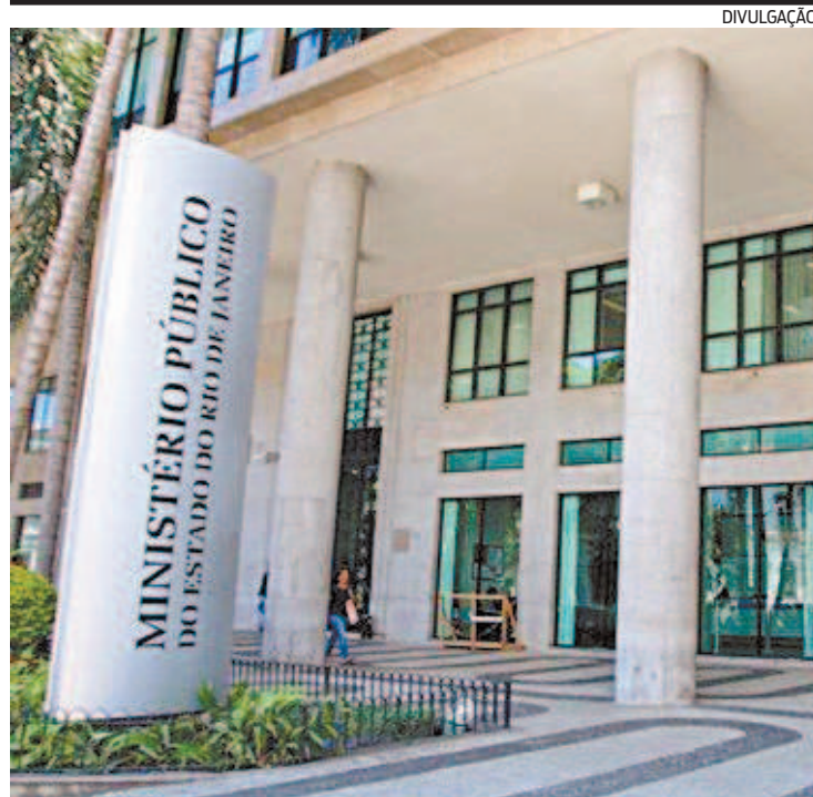
O MPRJ havia pedido a redução da tarifa, sob pena de multa diária

Reportagem do estagiário Jorge Costa , sob supervisão de Thiago Antunes