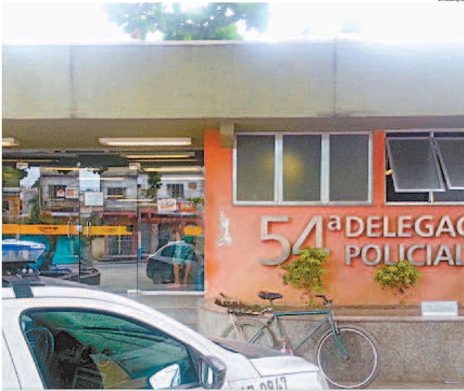
De acordo com os relatos, a vítima foi encontrada trancada em um canil. Mãe e avó da criança foram encaminhadas ao sistema prisional

As duas mulheres foram encaminhadas ao sistema prisional e ficarão à disposição da Justiça.