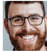
Renato Cozzolino prefeito de Magé

O mundo vive, hoje, um momento muito delicado, onde vidas estão sendo levadas por um vírus minúsculo. Regiões mais carentes sofrem mais. É por isso que nós, como autoridades públicas, temos o dever de fazer com que a qualidade de vida da população seja afetada o menos possível na pandemia. Vacina, distanciamento social, uso de máscara, álcool-gel, enfim, são cuidados que já sabemos de cor.