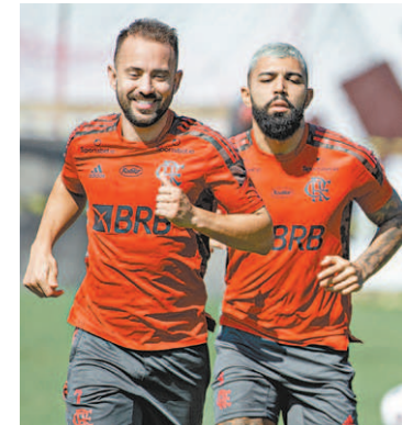
Flamengo joga em casa

Rubro-Negro pode se classificar e garantir o primeiro lugar do grupo