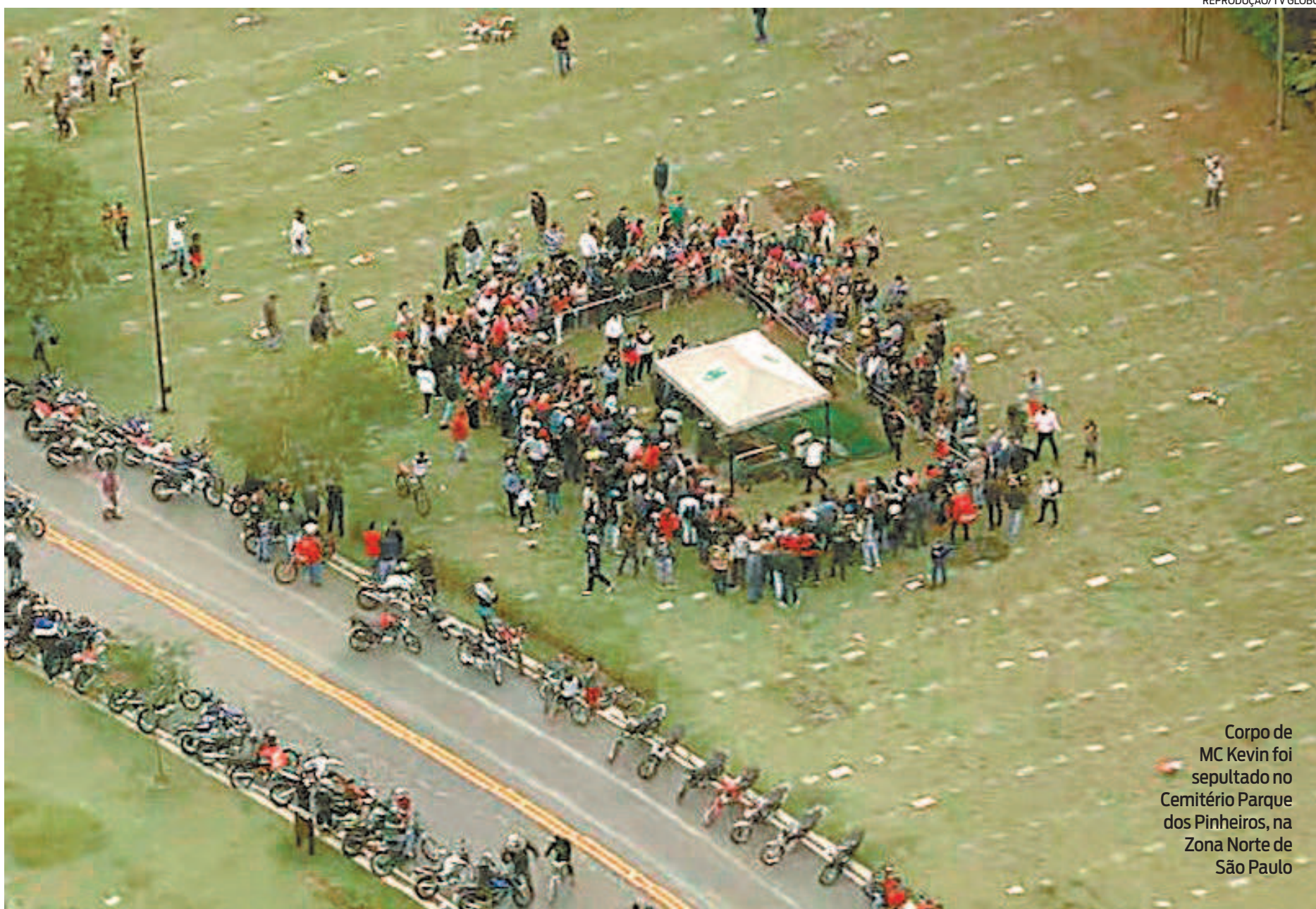
Corpo de MC Kevin foi sepultado no Cemitério Parque dos Pinheiros, na Zona Norte de São Paulo