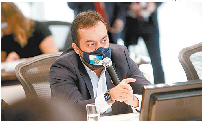
Governador Cláudio Castro antecipa os pagamentos mais uma vez

o inquilino deve aproveitar o momento para entender o cenário do imóvel e usar essa informação como uma “carta na manga”: “O básico de qualquer negociação é a oferta X demanda. Como ainda estamos dentro de um cenário de muita instabilidade, muitos proprietários não querem deixar os seus imóveis vazios, arcando com altos custos, na maioria das vezes, de condomínio e as demais despesas básicas”.