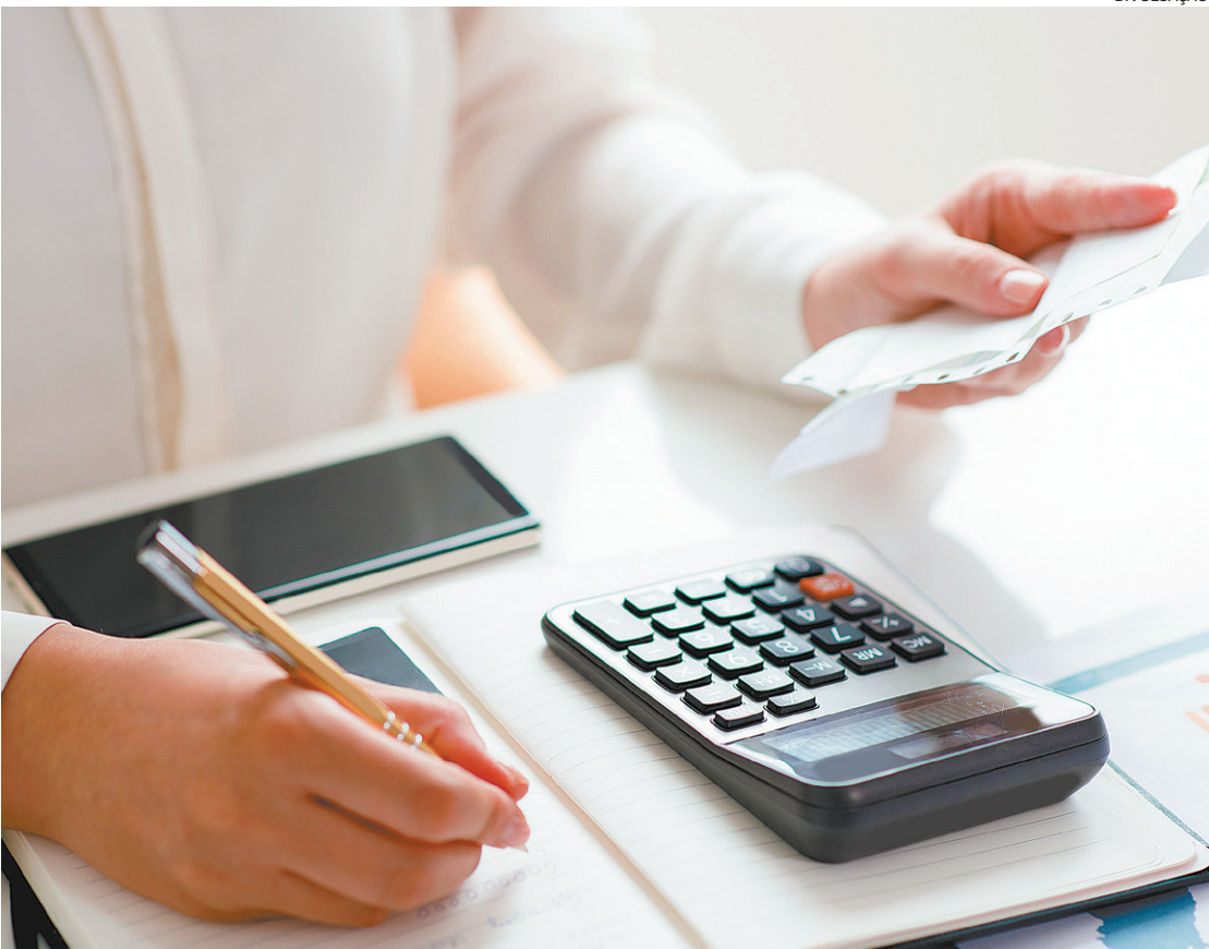
Especialista diz que o básico de qualquer negociação é oferta x procura e que cenário é de instabilidade

Na Zona Norte do Rio, entre os seis bairros analisados, três tiveram subida de valores. O maior destaque foi para o Rio Comprido, com 8,11%, e m² a 19,47. Vila Isabel (2,25%) e preços em R$ 22,27, e Maracanã (2,23%), com alugueis médios em R$ 24,25 por m². Os três bairros que tiveram queda nos valores anunciados são Tijuca