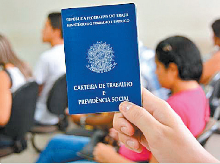
A Feira Virtual oferece, por exemplo, vagas para o primeiro emprego

Os interessados em uma das vagas da Feira de Emprego devem fazer um cadastro no link (n8qhg.app.goo.gl/UruJ) e identificar qual oportunidade se encaixa no seu perfil. A equipe da Secretaria de Trabalho analisa as informações e encaminha para as chances disponíveis. Entre as empresas participantes estão Ambev, McDonald's e Sinaf.