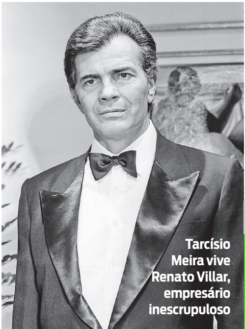
Tarcísio Meira vive Renato Villar, empresário inescrupuloso