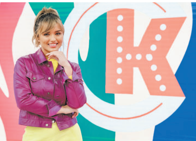
Rafa Kalimann no palco de seu programa e nos bastidores de gravação: desafio assumido