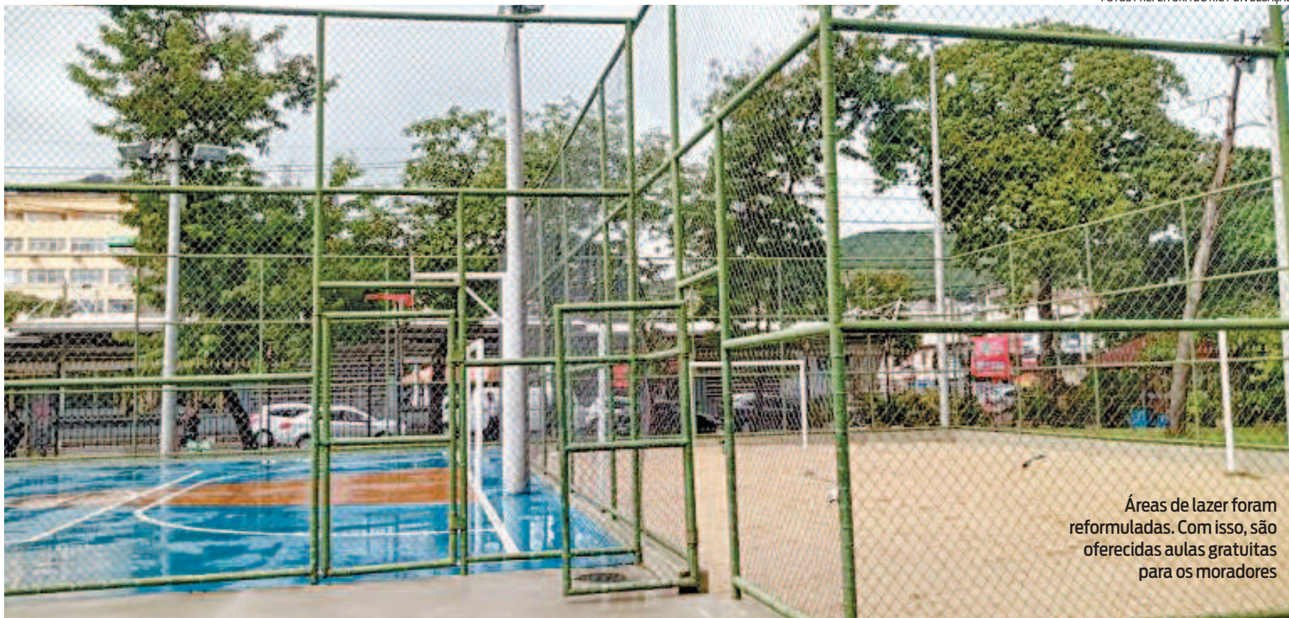
Áreas de lazer foram reformuladas. Com isso, são oferecidas aulas gratuitas para os moradores

Confira as atividades e horários: Zumba (segundas e sextas-feiras, das 9h20 às 10h20 e das 17h às 18h); treino Funcional (segundas e quartas, das 7h às 8h e das 8h às 9h; e terças e quintas,