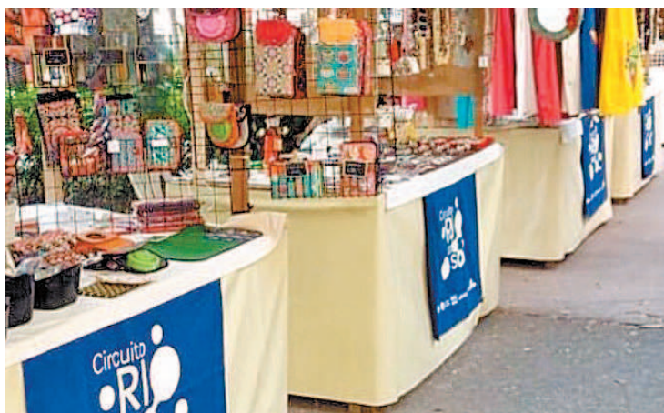
Secretaria de Fazenda e Planejamento incluiu novos grupos no auxílio

O benefício está disponível desde a última quinta-feira, para quem recebe a segunda parcela e, a partir de hoje, para quem recebe a primeira. Para saber mais e checar quem tem direito à ajuda, basta acessar o portal carioca.rio.