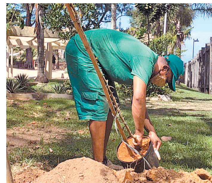
Diversas áreas da cidade receberam mudas de diversas espécies

Para tirar dúvidas, entre em contato com a prefeitura pelo telefone 1746.