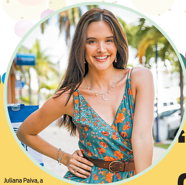
Juliana Paiva, a Luna de 'Salve-se Quem Puder'