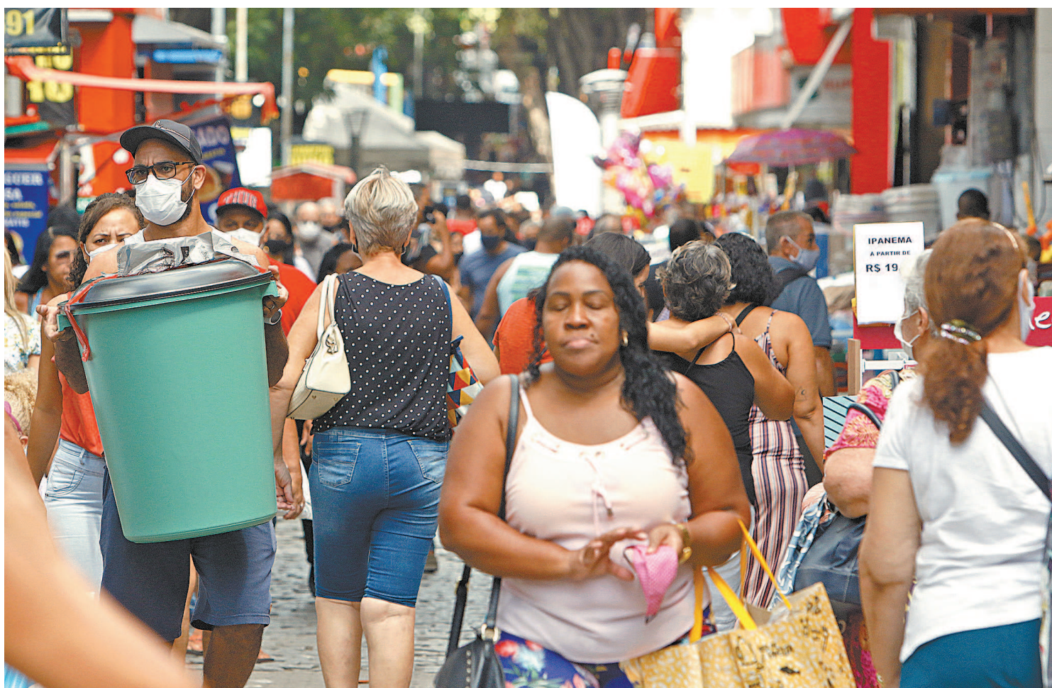
Grande número de pessoas circula pelo calçadão de Campo Grande: na Zona Oeste, 54,6% acham que os vizinhos não respeitam as regras

Orla da Zona Sul com grande movimento mesmo num momento de preocupação com a covid