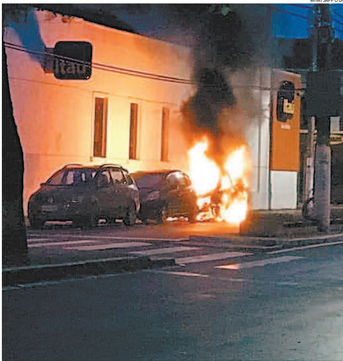
Em 2016, tentativa de roubo a banco teve intenso tiroteio e carros incendiados, em Angra dos Reis