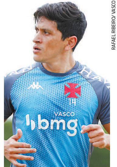
Cano: artilheiro em campo

Com menos derrotas que o Fluminense e com o mesmo número que o Flamengo, o Cruzmaltino acabou ficando fora do G-4 da competição por ter empatado muito. Ao todo, foram cinco empates, com apenas três vitórias e duas derrotas.