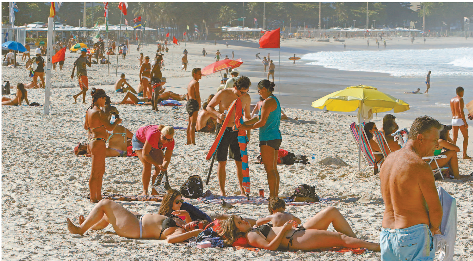
Apesar de a liberação do banho de mar e a permanência nas areias só valerem a partir de segunda, muitas pessoas desrespeitaram ontem as normas em Copacabana

veitaram o dia ensolarado e lotaram a orla de Copacabana, na Zona Sul. Apesar da flexibilização das medidas de restrição que libera o banho de mar e permanência nas areias só valerem a partir de segunda, muitas pessoas desrespeitaram as normas. A areia e o mar estavam cheios de banhistas, que não se preocupavam em manter o distanciamento ou usar máscara.