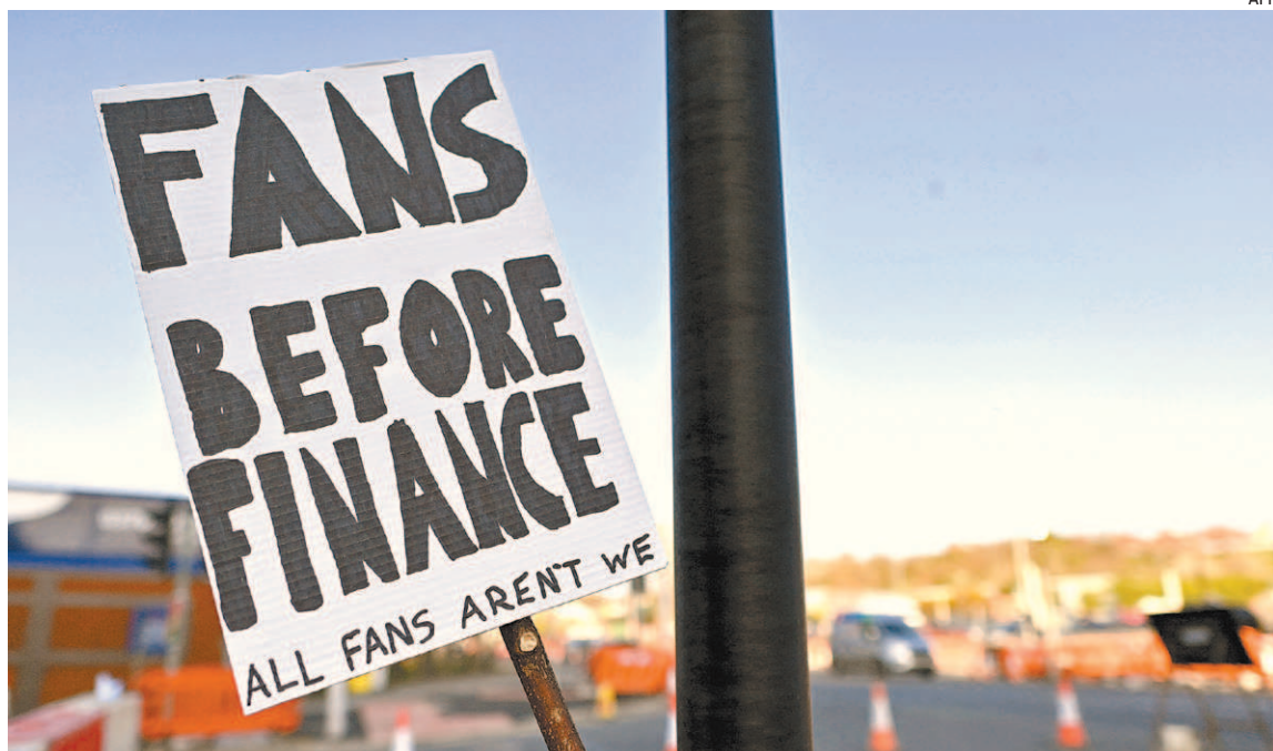
A repercussão da criação da Superliga de clubes gerou críticas e protestos por toda a Europa