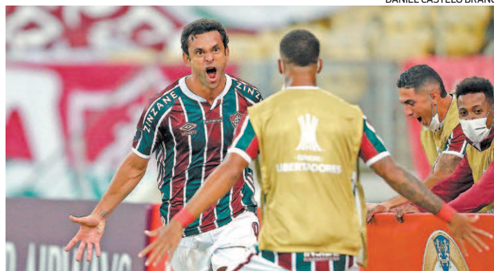
O ídolo Fred marcou na estreia na Libertadores 2021