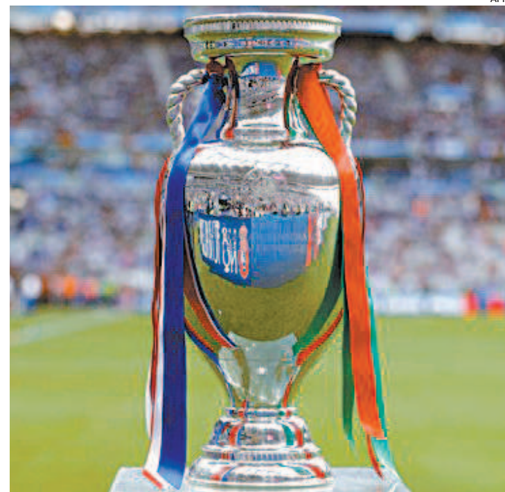
Os jogos estão marcados para o período de 11 de junho a 11 de julho

A capacidade máxima de público nos estádios vai variar de acordo com a liberação e da situação sanitária de cada país. Budapeste foi a única que levantou a possibilidade de capacidade de 100% dos estádios. Baku e São Petersburgo estipularam 50%, enquanto Amsterdã, Bucareste, Copenhague e Glasgow de 25% a 33%. Já Londres inicialmente estima 25% de público, mas pretende ampliar esse número. A Eurocopa será entre os dias 11 de junho e 11 de julho.