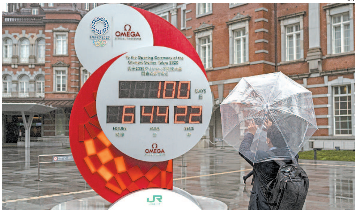
Homem fotografa relógio que marcava ontem a contagem regressiva de 100 dias para os Jogos Olímpicos