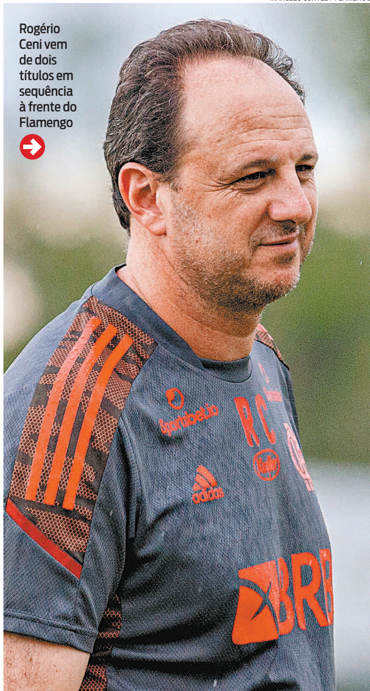
MARCELO CORTES / FLAMENGO