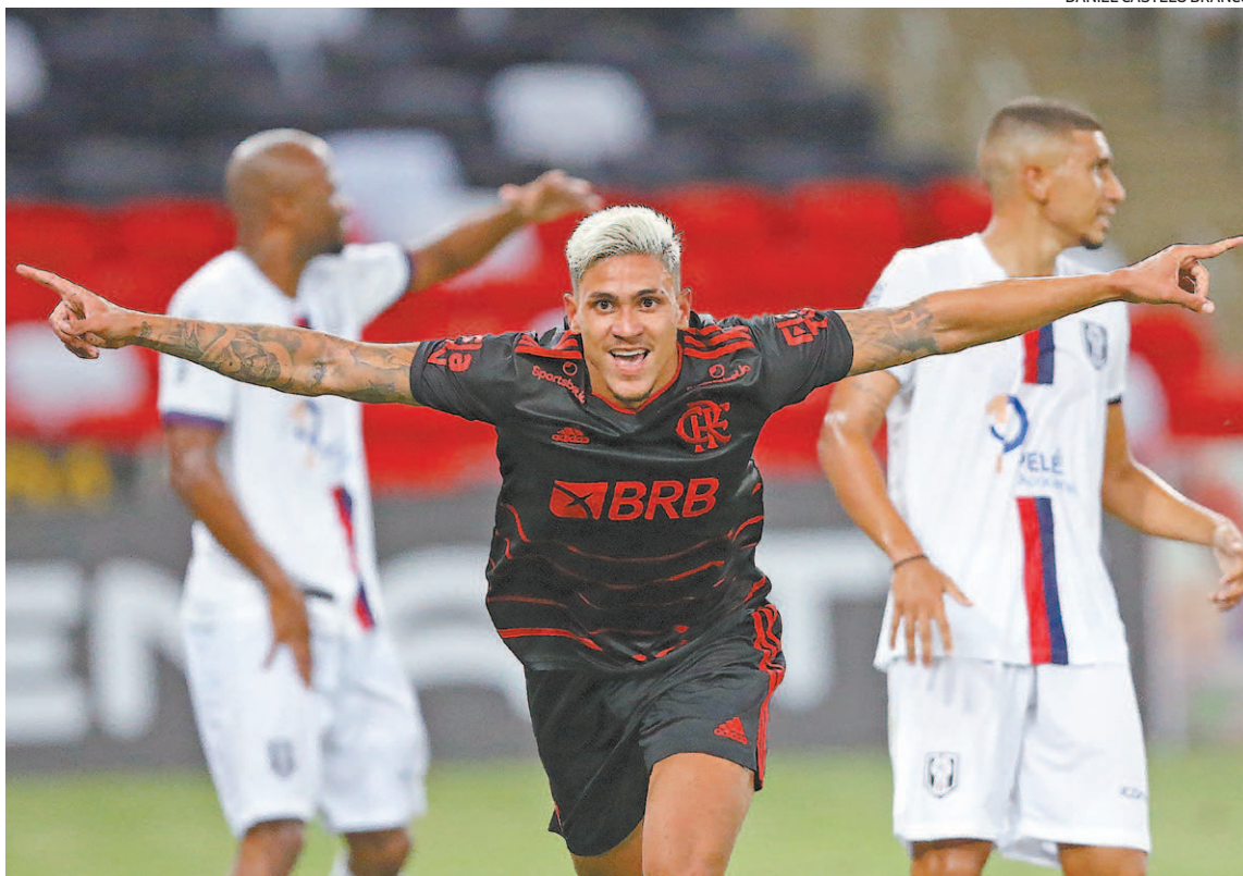
Pedro ainda não foi liberado para voltar ao time do Flamengo: atacante tem chance de jogar no sábado