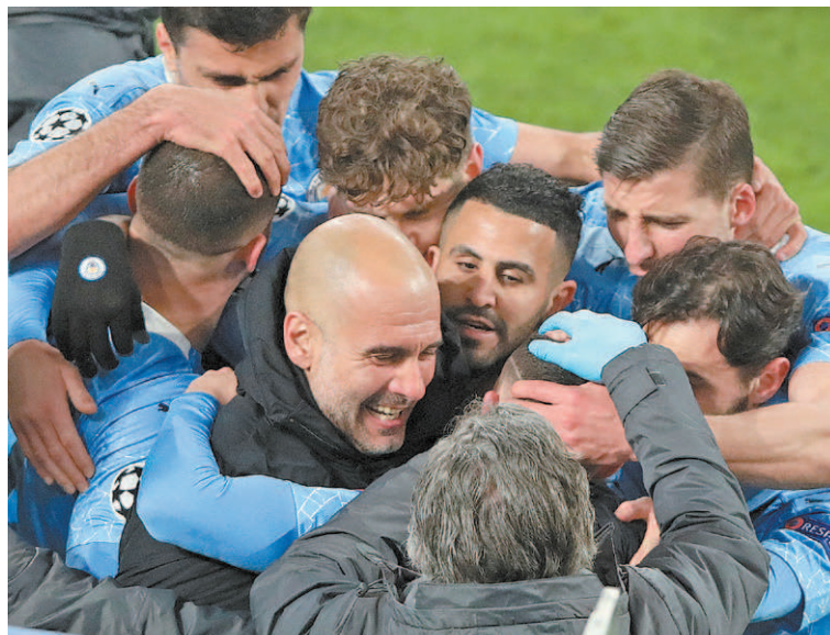
Jogadores festejam gol do Manchester City com o técnico Pep Guardiola

cou Diogo Jota em campo, deixando o time com quatro atacantes. No meio, trocou Milner por Thiago Alcântara. A aposta reanimou o Liverpool, que retomou a pressão.