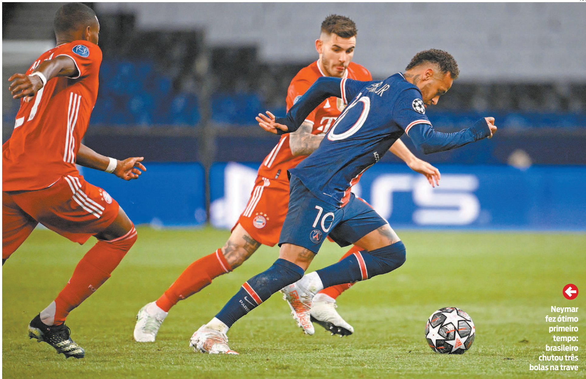
← Neymar fez ótimo primeiro tempo: brasileiro chutou três bolas na trave