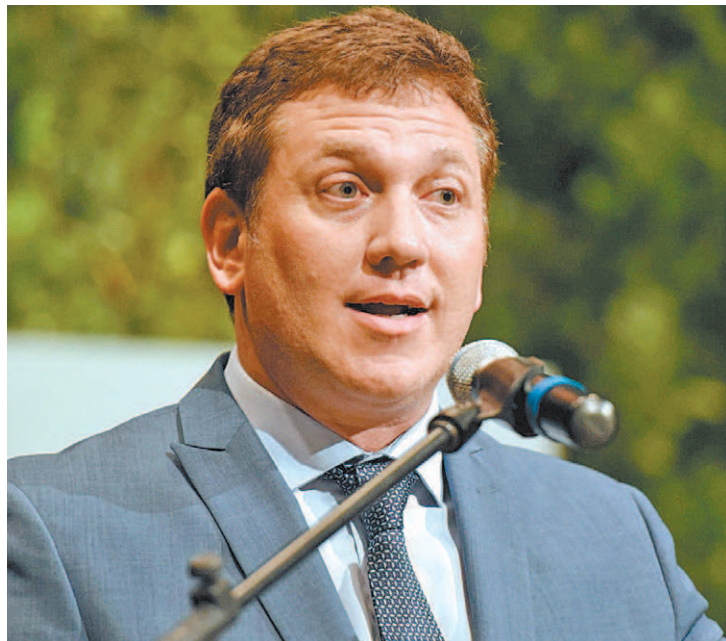
Alejandro Domínguez, presidente da Conmebol: 'Um grande passo'