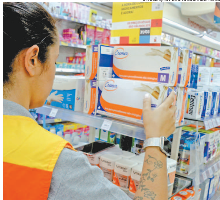
Farmácias estão autorizadas a funcionar com 40% da capacidade