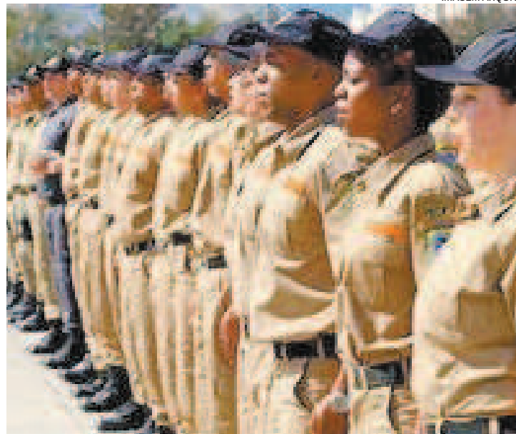
Os novos guardas municipais foram selecionados entre 53 mil inscritos