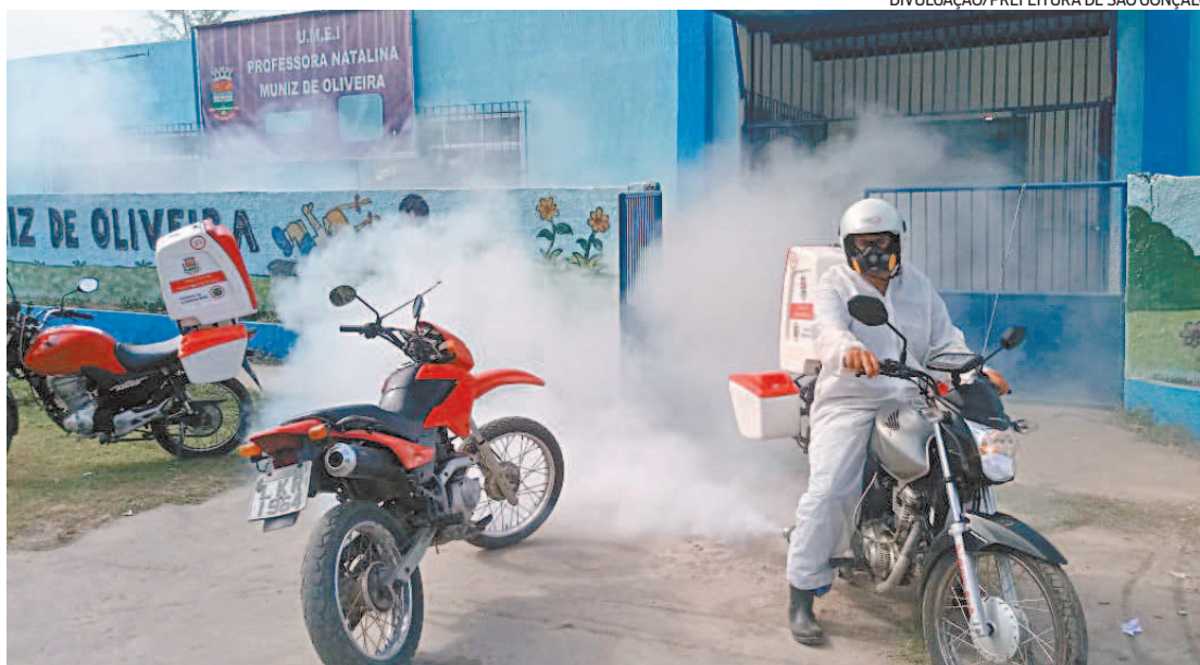
Equipes de sanitização estarão em ação hoje contra o coronavírus em vários bairros de São Gonçalo

A Vigilância em Saúde Ambiental da Secretaria Municipal de Saúde define os bairros para a sanitização através das informações repassadas pelo setor de Vigilância Epidemiológica, que faz o levantamento de quais são aqueles com maior número de casos da doença. O órgão conta com dois tipos de equipamentos para desinfetar os ambientes com o quaternário de amônio de 5ª geração: as motobombas e a motobomba (acoplada em uma picape)