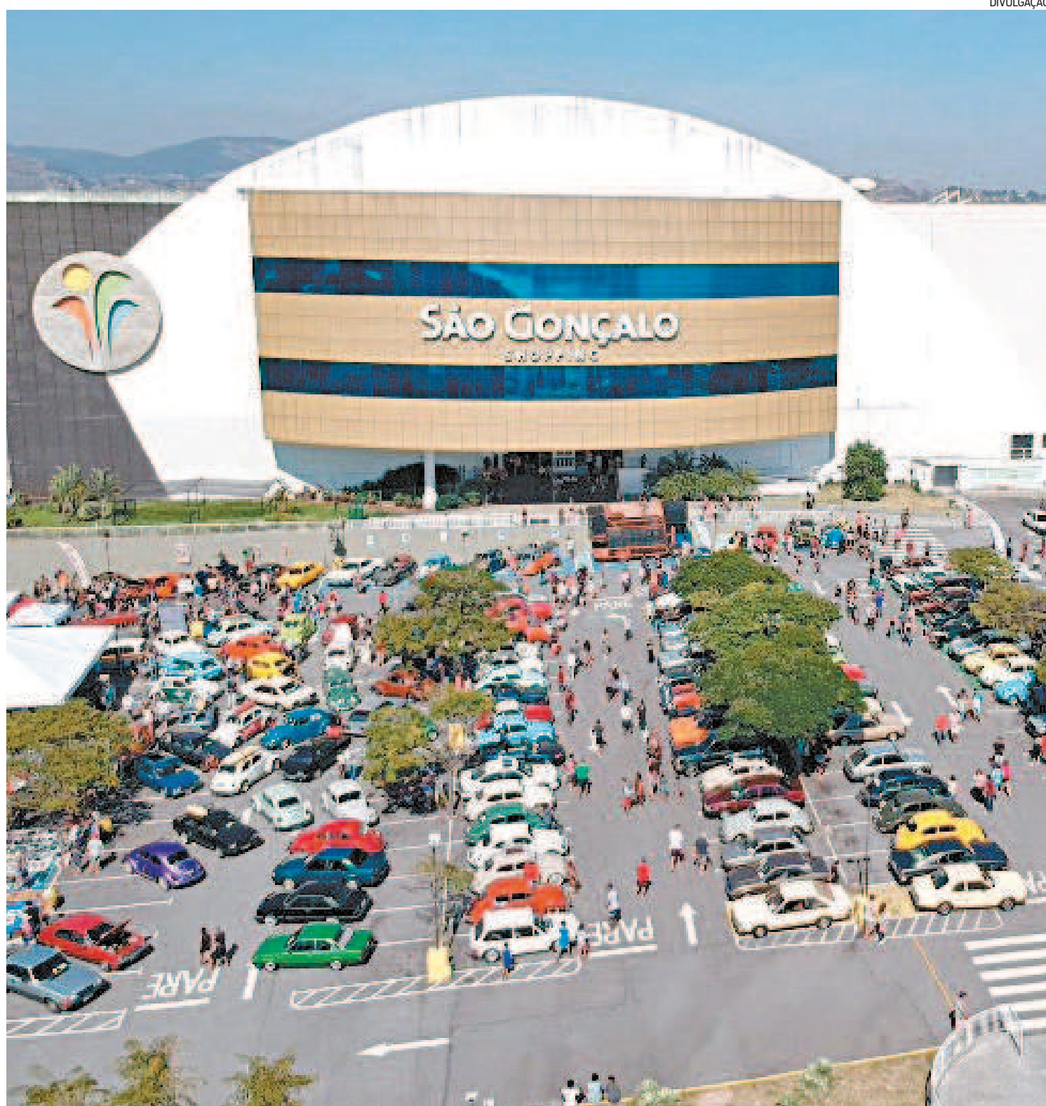
Shoppings, incluindo as praças de alimentação, poderão funcionar, exclusivamente, no período entre 12h e 20h, com regras específicas

e comércio de autopeças podem abrir das 9h às 17h, também com 40% da capacidade.