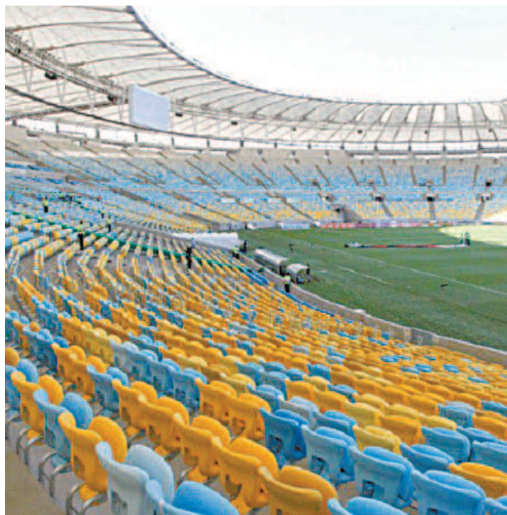
Um dos jogos da nona rodada no Maraca será o clássico Fla x Vasco

Os dois jogos que completam a nona rodada serão em outras cidades. O Volta Redonda vai receber o Botafogo, sábado, às 21h30, no Estádio Raulino de Oliveira, e o Macaé jogará contra o Resende, em Bacaxá, também no sábado, às 15h30.