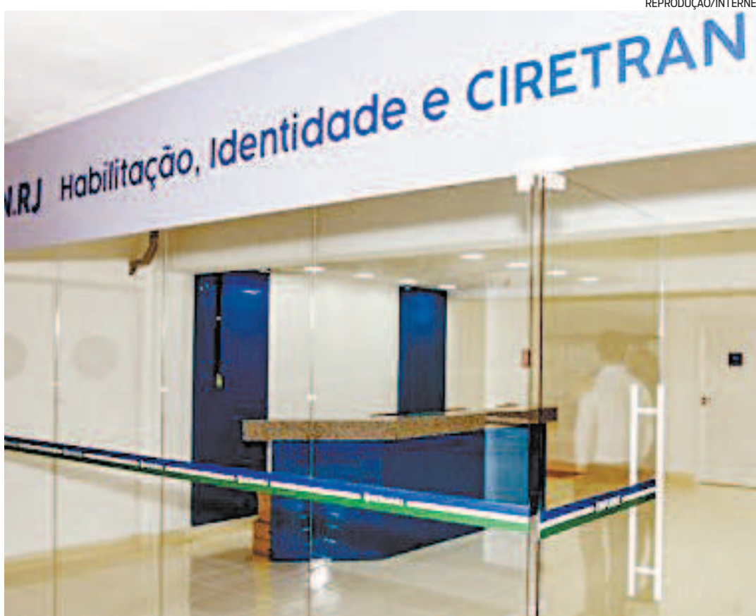
Após período de recesso, Detran-RJ retoma as atividades com capacidade reduzida

Durante o recesso para conter o avanço da covid-19, o Detran-RJ realizou 156 atendimentos emergenciais. Foram oferecidos serviços de emissão de segunda via da identidade e da carteira de habilitação para quem teve o documento roubado ou furtado. Além da sede do departamento, as unidades de Petrópolis, Volta Redonda, Cabo Frio e Campos dos Goytacazes abriram para o atendimento de urgência.