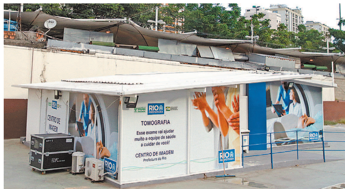
Tomógrafo da Rocinha, que fica na Igreja Universal do bairro, é um dos 12 que estão fora de operação

empresa, na gestão do ex-prefeito Marcelo Crivella, teve valores de R$ 1.680.000 e depois um aditivo de R$ 700 mil, que, segundo a empresa, expandia o serviço para outras unidades de saúde do município. O objeto dos contratos: contratação de empresa especializada para emissão de laudos remotos — telerradiologia — para exames de tomografia computadorizada.