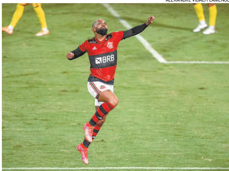
O artilheiro Gabigol chegou a 73 gols com a camisa do Flamengo

O primeiro tempo serviu de treino de luxo. O Madureira não viu a bola e foi massacrado. Aos sete, Gabigol balançou a rede, mas o gol foi mal anulado por impedimento inexistente de Gerson. Aos 16, o Flamengo abriu a porteira. Bruno