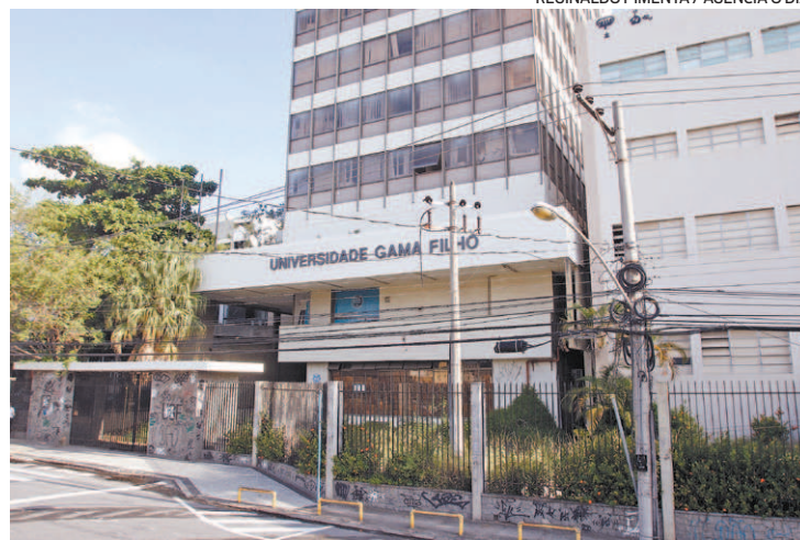
Universidade Gama Filho, na Piedade, foi fechada em 2014