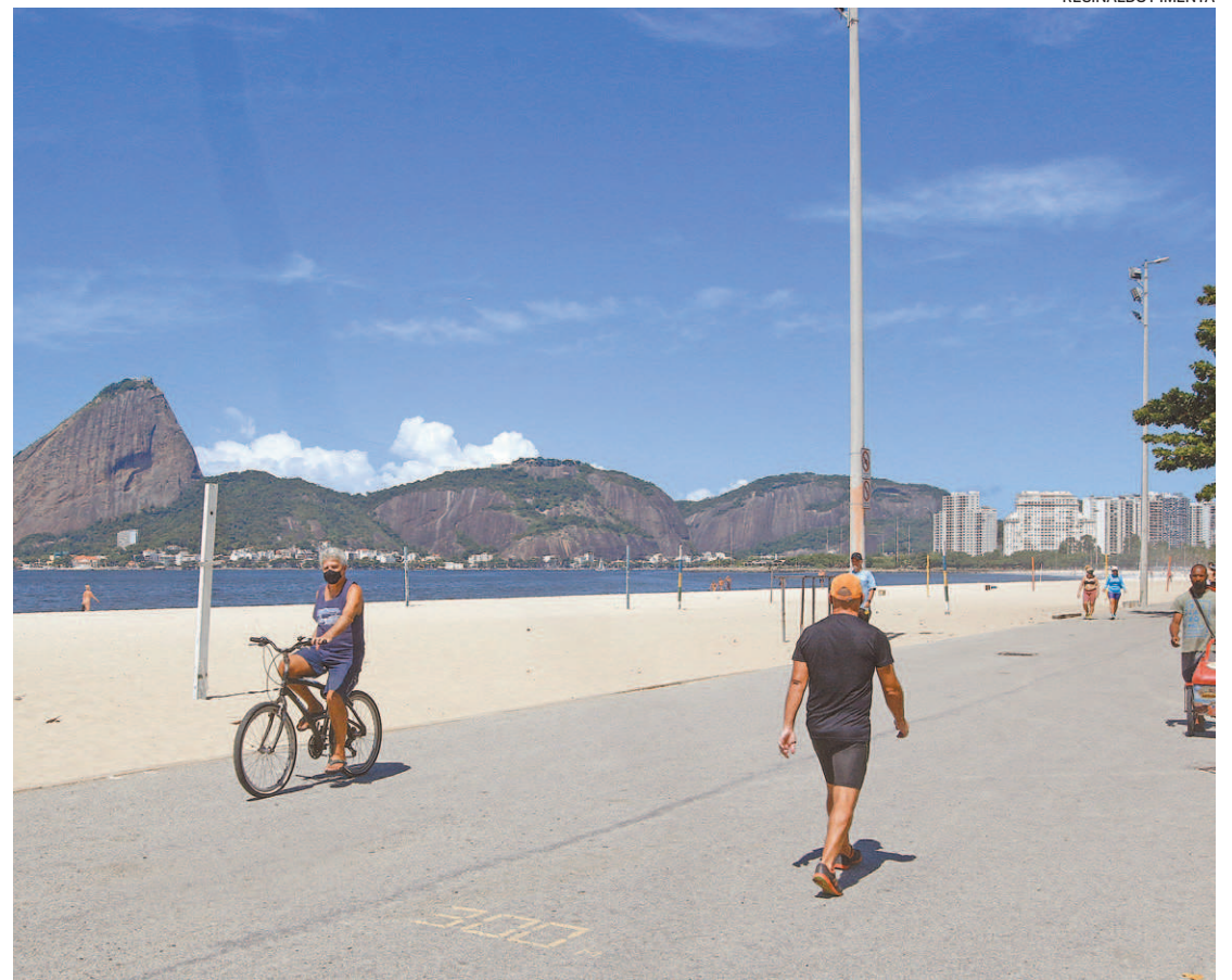
A cidade do Rio segue na faixa de risco muito alto, e atividades devem funcionar sob medidas de proteção