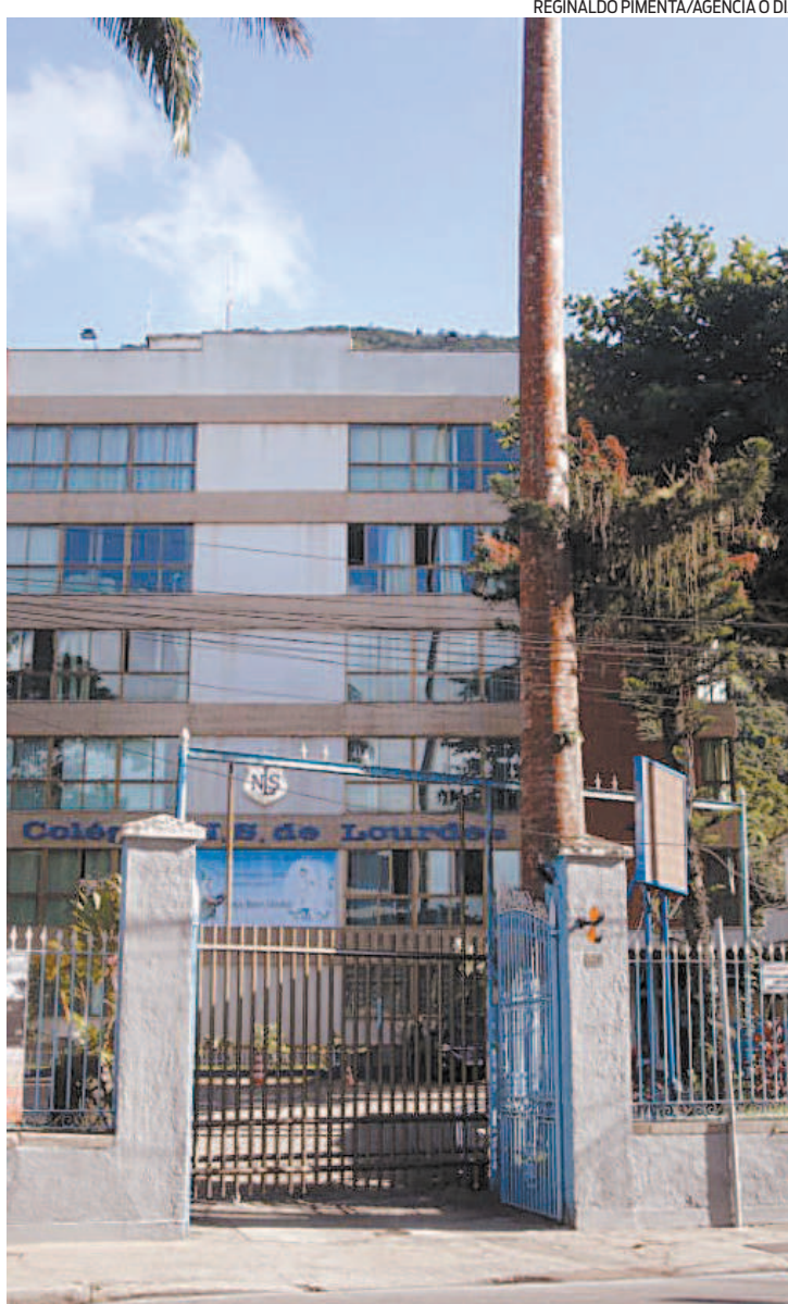
Especialistas defendem que o momento ainda não é para retornar

O Sepe reafirmou que as aulas remotas devem continuar, de acordo com decisão de assembleia em 30 de março. “Esperamos, no entanto, que antes de buscar derrubar essa liminar, a SME RJ e a prefeitura reabram a discussão com o Sepe e vereadores, em busca de consenso em que a vida de toda a comunidade escolar, antes de tudo, seja respeitada”, finaliza.