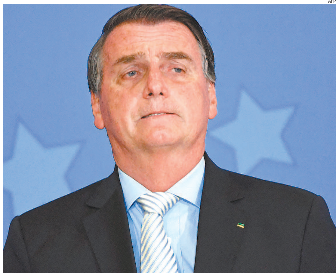
Bolsonaro promoveu, desde o início da pandemia, pelo menos 41 cerimônias com aglomeração no Palácio