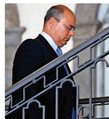
Witzel: governador afastado

Advogados alegam que não tiveram acesso à toda delação