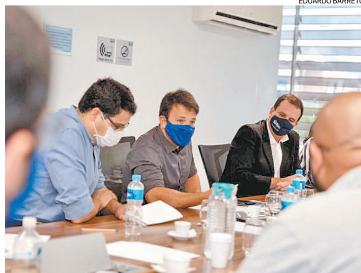
Carlo Caiado e Eduardo Paes e reuniram ontem para tratar BRT