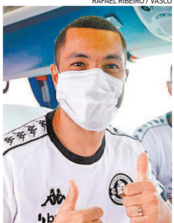
Morato deve estreiar amanhã

Desde que assumiu o comando do Vasco, o técnico Marcelo Cabo nunca teve tantas opções para escalar o time. Com exceção do goleiro Vanderlei, anunciado como reforço no domingo, o técnico terá todo o grupo à disposição. Após escalar uma