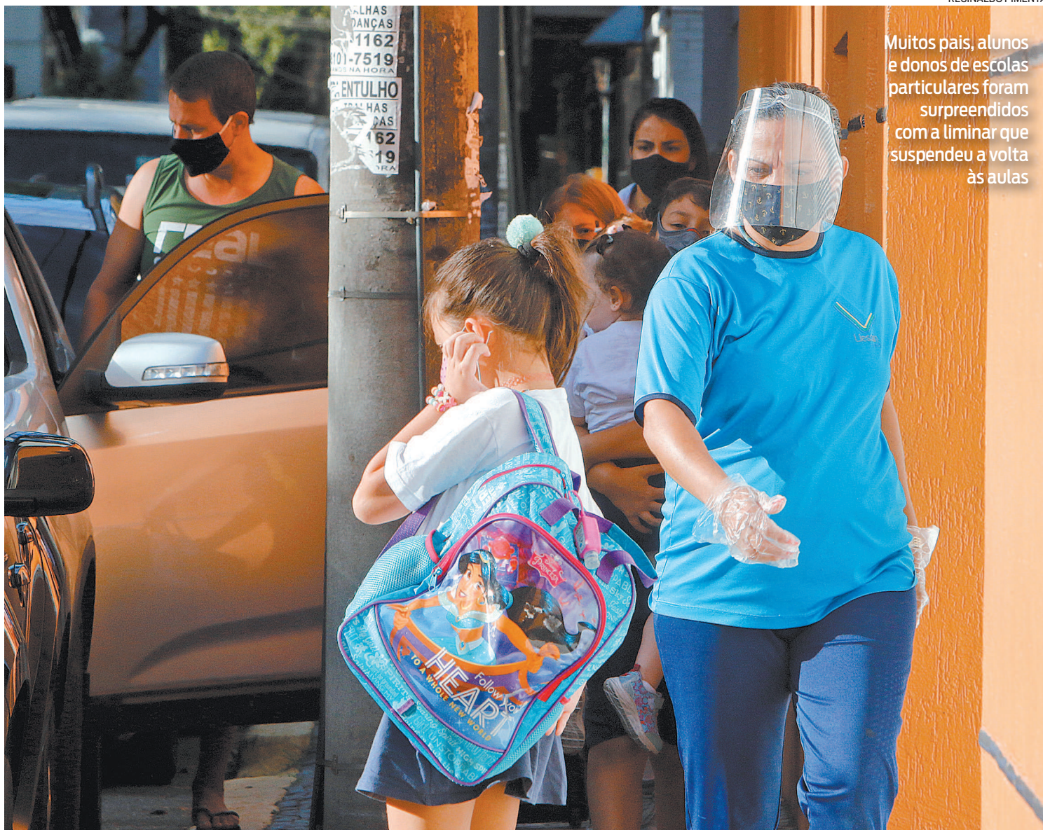
Muitos pais, alunos e donos de escolas particulares foram surpreendidos com a liminar que suspendeu a volta às aulas

Ao todo, 409 escolas municipais reabririam as portas para os alunos nesta terça-feira, caso não houvesse a liminar.