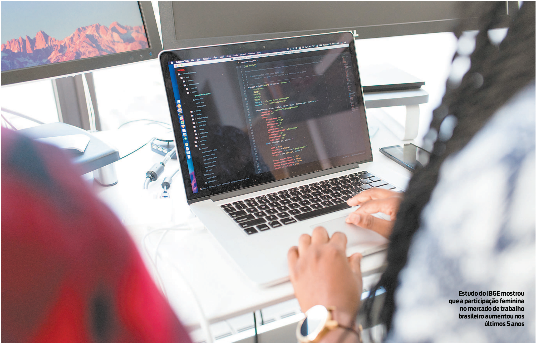
Estudo do IBGE mostrou que a participação feminina no mercado de trabalho brasileiro aumentou nos últimos 5 anos

A participação feminina nos setores de Negócios e Tecnologia está aumentando no decorrer dos anos. Com isso, a diferença entre os gêneros nas áreas vem diminuindo. P.3