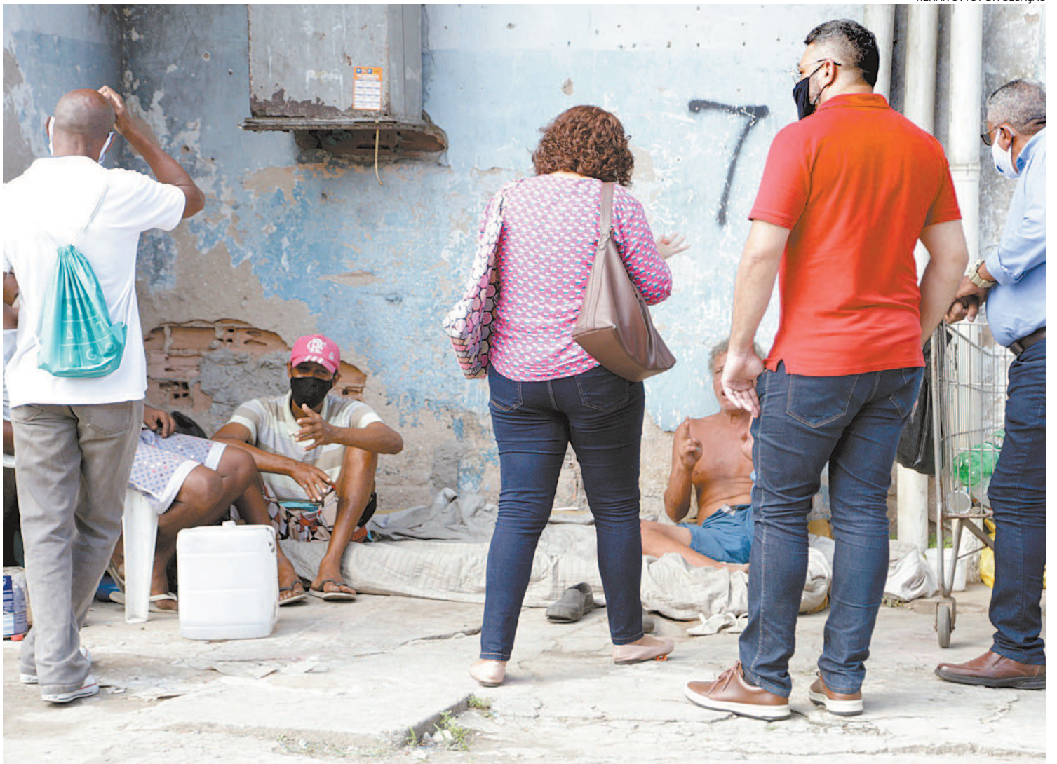
Muitos dependentes químicos e moradores de rua não concordam em voltar para suas casas ou para comunidades terapêuticas e abrigos