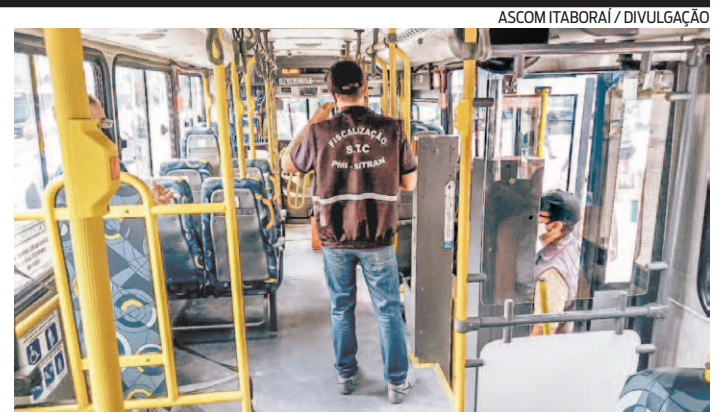
Fiscais estão de olho no uso de máscaras e na lotação dos coletivos

O livro do autor niteroiense já está à venda no site da Máquina de Livros ( https://maquinadelivros.com.br/ ) e na Amazon. Na próxima semana começa a chegar às principais livrarias.