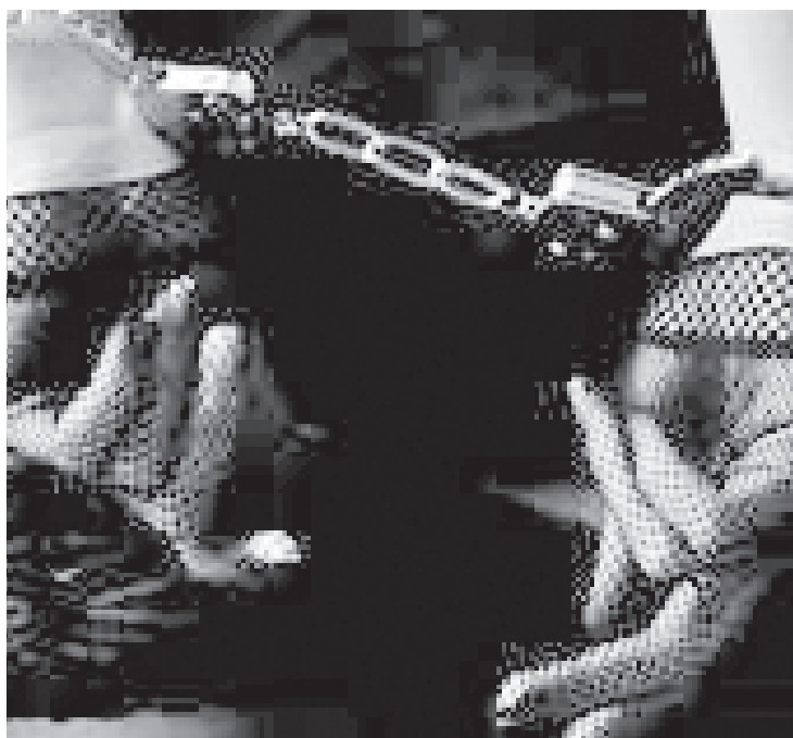
Disputando com os mais variados gêneros, livros eróticos bombam