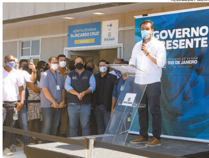
Castro: ‘A pandemia continua e a nossa maior esperança é a vacinação’

“Querida dizer que a pandemia continua aí e a nossa maior esperança é sem dúvida a vacinação[...] A população precisa de dois tipos de vacina no momento. A primeira contra a Covid. A segunda contra a fome. E a única vacina contra a fome é a manutenção dos empregos”, destacou.