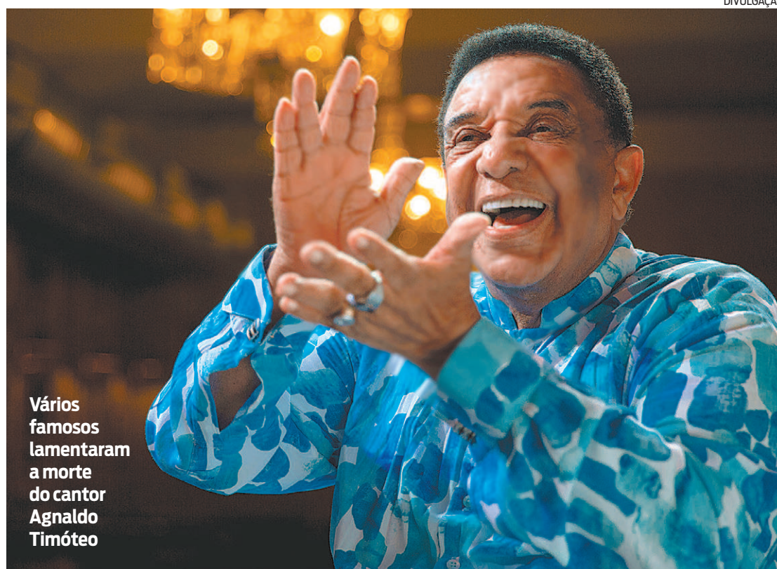
Vários famosos lamentaram a morte do cantor Agnaldo Timóteo

Torcedor do Botafogo, recebeu homenagem do Alvinegro. “Com muita dor, o Botafogo lamenta a morte de Agnaldo Timóteo, cantor e compositor brasileiro, botafoguense apaixonado. O Clube deseja conforto aos amigos e familiares neste momento difícil”. Agnaldo não era um torcedor