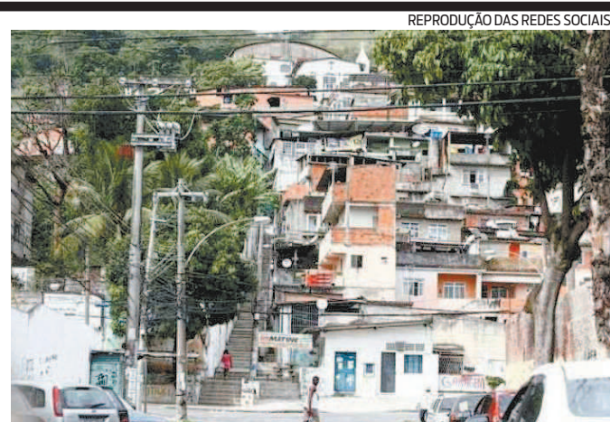
Mapeamento aponta que região é uma das mais afetadas

Ontem, viatura da PM foi atada a tiros ao passar pela Estrada da Guaxindiba, em Guaxindiba (São Gonçalo). Conforme a PM, os criminosos estavam em duas motos quando atiraram contra a equipe do 7º BPM (SG). Os policiais informaram que houve confronto e os bandidos fugiram. Ninguém se feriu. A viatura teve o pneu furado e foi rebocada para o batalhão.