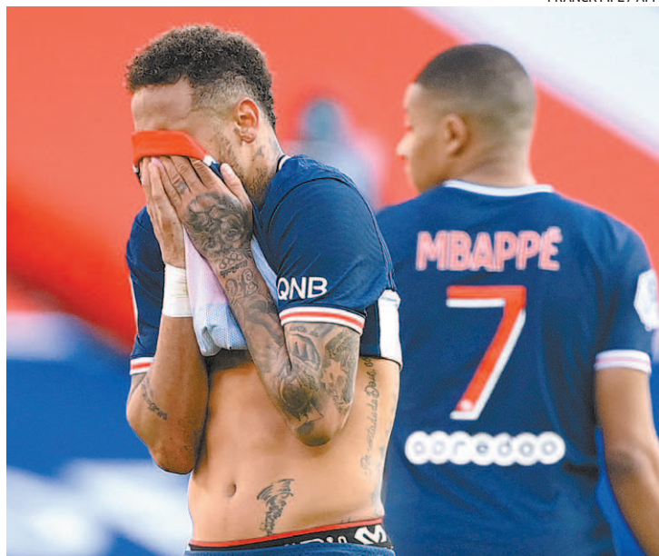
Neymar recebeu o segundo cartão amarelo já no fim do jogo