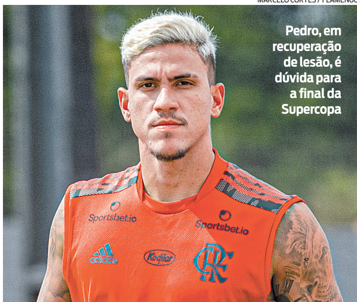
MARCELO CORTES / FLAMENGO

Valor: US$ 14 milhões. Taxa bancária: 6,30. Montante em real: R$ 88,22 milhões. Início do contrato: 01/2021.