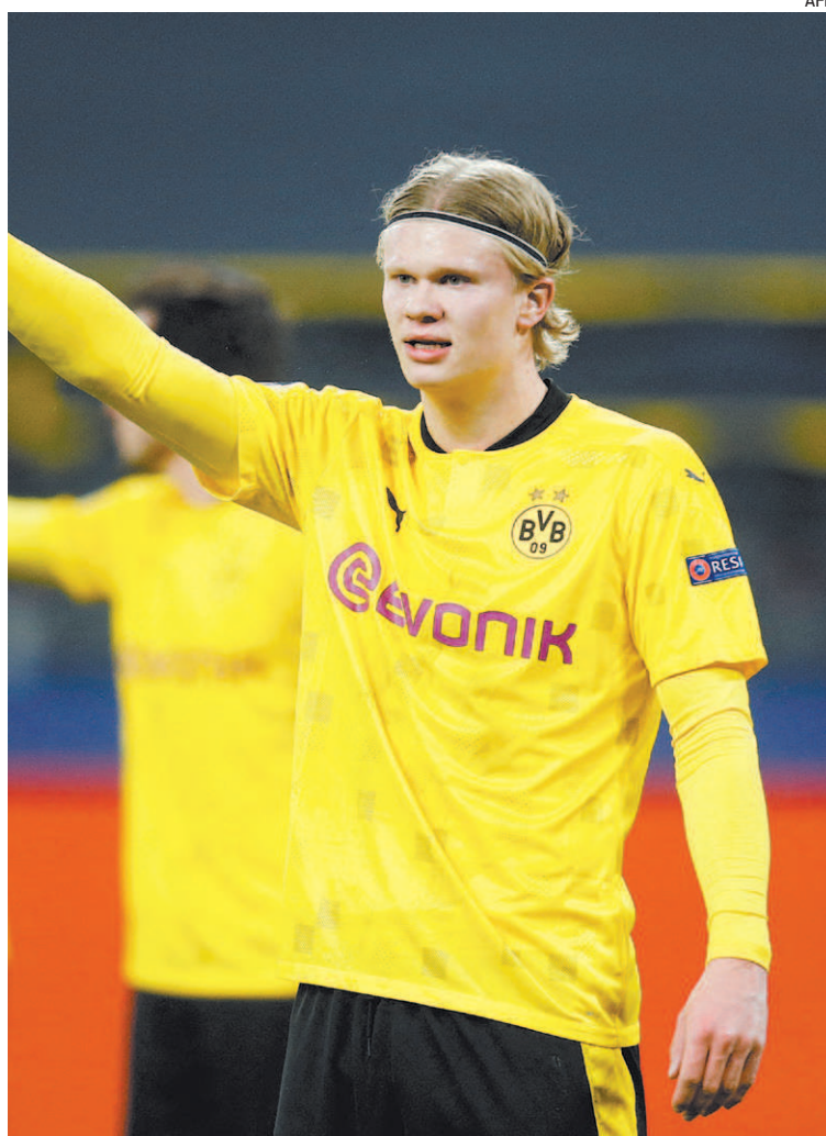
Haaland é o artilheiro da Liga dos Campeões, com 10 gols marcados

Em seguida, o pai e o empresário de Haaland pegaram a ponte-aérea e desembarcaram em Madri para uma reunião com o clube merengue, conforme informações da rádio "Cope" e do diário "As". A ideia dos representantes do jogador