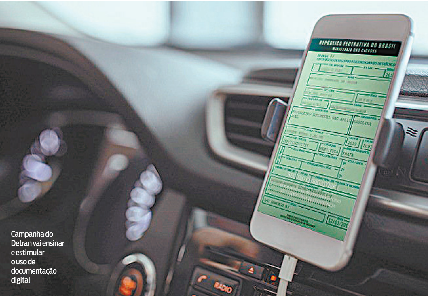
Campanha do Detran vai ensinar e estimular o uso de documentação digital

“Cada vez mais, estamos utilizando ferramentas digitais nos serviços do Detran. RJ. Um dos princípios da nossa administração é que