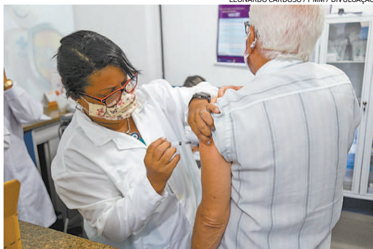
Idosos de 75 anos já foram vacinados no município de Mesquita

Para receber a vacina, será necessário comprovar que é um profissional do serviço de saúde ou apresentar declaração emitida pelo local de trabalho. Além disso, caso se trate de um morador de Mesquita que trabalhe em outra cidade, será necessário também apresentar comprovante de residência. Outra exigência é a apresentação da car-