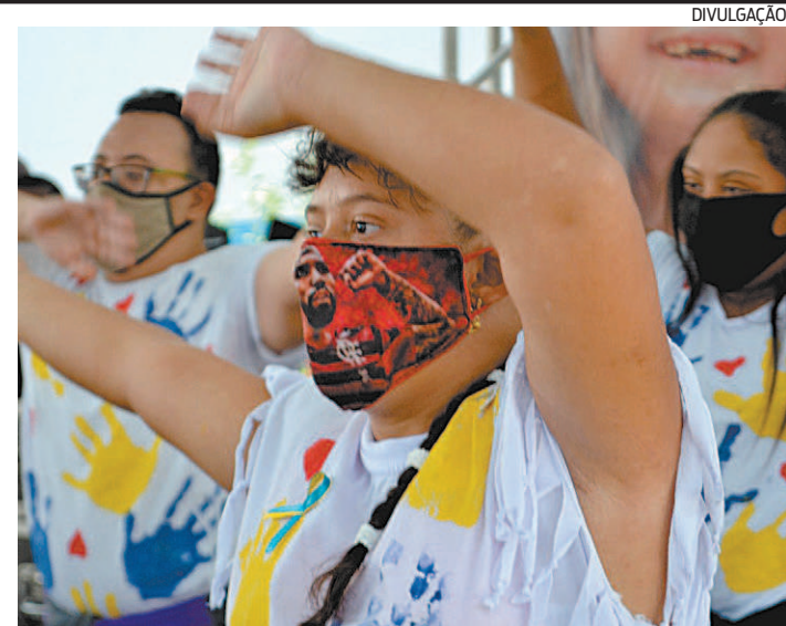
Alunos do Polo de Inclusão e Trabalho da Fundec se apresentaram

A vacinação acontece em dois locais na cidade: na Clínica da Família Jacutinga, na Rua Barão do Rio Branco s/nº, e na Clínica da Família São José, que fica na Avenida União 676, em Santa Terezinha. Em ambas, o horário é de 8h às 17h, de segunda a sexta-feira. É preciso apresentar cartão do SUS, CPF e comprovante de residência para ser vacinado. No caso dos profissionais de saúde, é necessário apresentar também uma declaração que comprove o vínculo ativo do trabalhador com o serviço de atendimento à linha de frente.