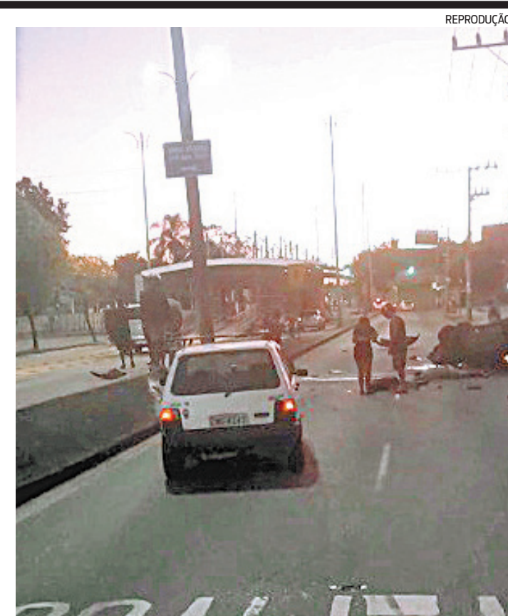
Acidente aconteceu por volta das 5h30 na Av. Cesário de Melo

A equipe foi formada por 150 profissionais, que trabalharam com o apoio de um caminhão compactador e oito caminhões basculantes, duas mini pás, uma pá mecânica, uma varredeira, 58 ceifadeiras e 14 sopradores. Para a realização do serviço de podas, foram mais seis garis, um caminhão cesto de 24m e um caminhão galhada.