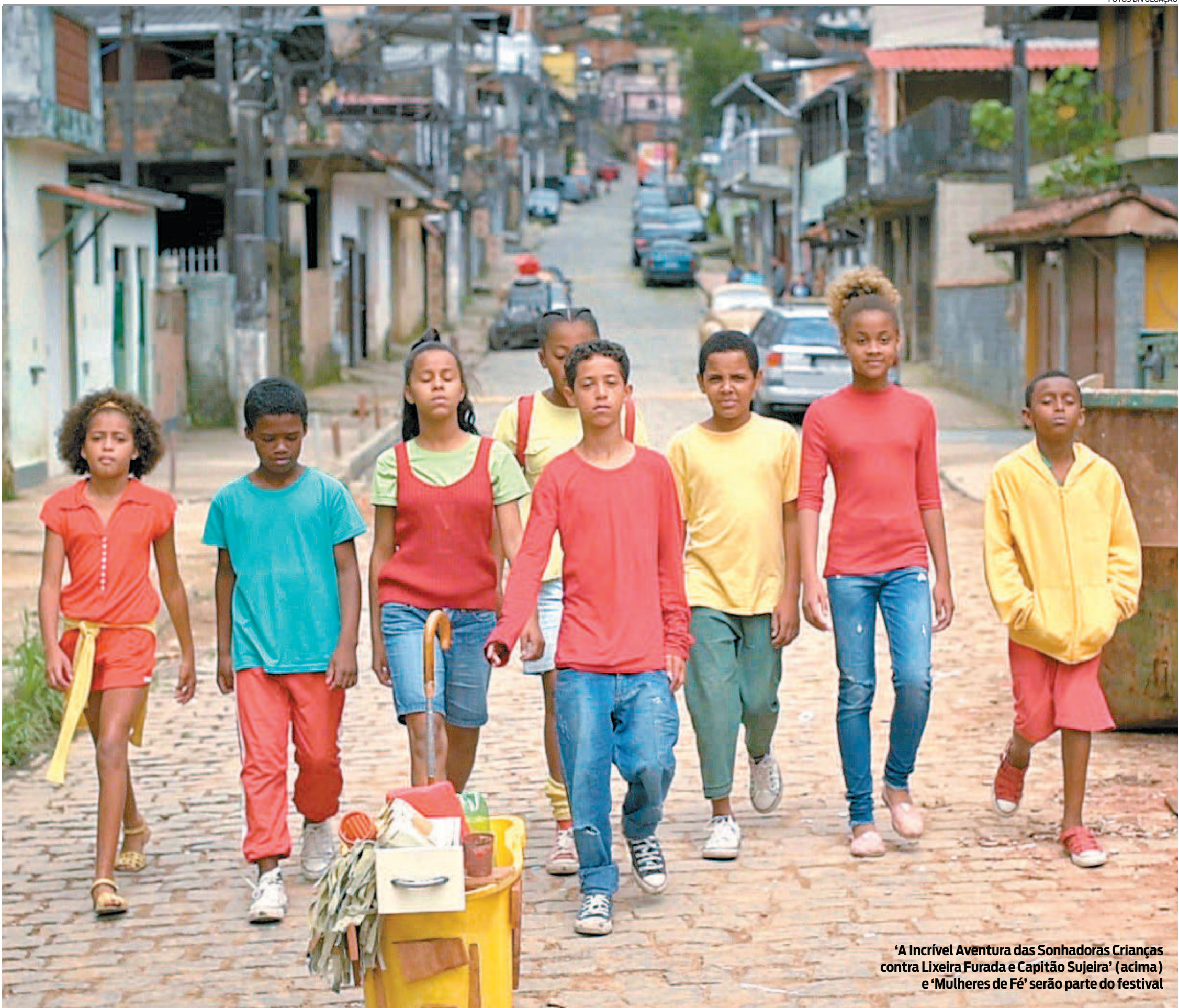
‘A Incrível Aventura das Sonhadoras Crianças contra Lixeira Furada e Capitão Sujeira’ (acima) e ‘Mulheres de Fé’ serão parte do festival