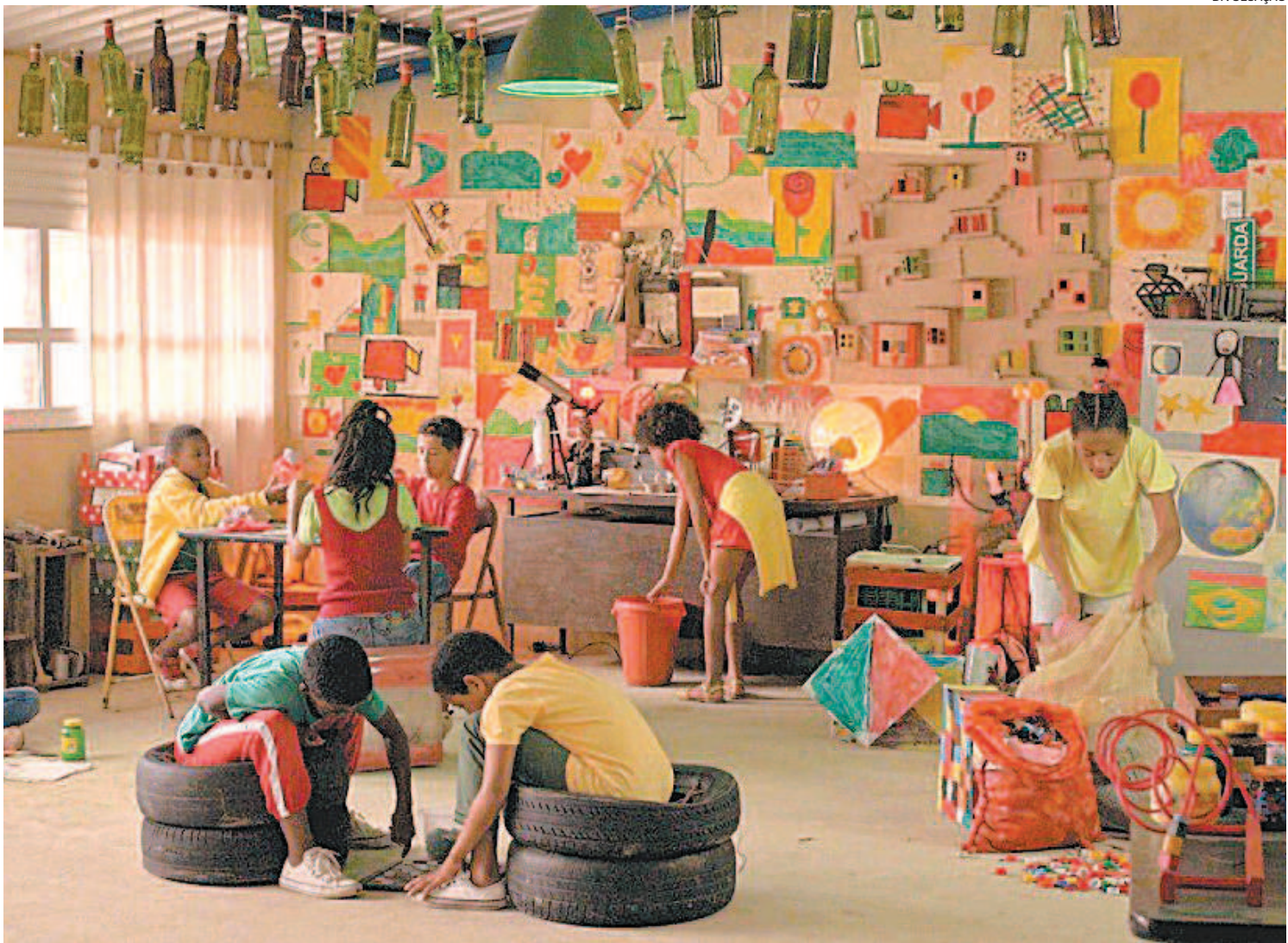
Imagem do filme 'A Incrível Aventura das Sonhadoras Crianças contra Lixeira Furada e Capitão Sujeira', que vai estar no Festival Visões Periféricas

Os amantes da Sétima arte não podem perder essa novidade: começa amanhã a 14ª edição do Festival Visões Periféricas, que vai exibir, de forma gratuita e on-line, 50 filmes de longas-metragens, médias e de curtas-metragens, em seis sessões. O evento, que é uma plataforma de difusão de filmes e desenvolvimento de projetos audiovisuais produzidos nas múltiplas periferias brasileiras, termina no dia 31. Na sessão de abertura do festival, amanhã, às 19h30, será exibido o longa-metragem Anastácias , de Thatiane Almeida, com tradução em libras. A programação deste ano exibirá 4 Mostras Competitivas: Panorâmica , com 5 filmes de filmes de longa-metragem e de média-metragem com duração de, pelo menos, 40 minutos; Fronteiras Imaginárias , com programação de 20 filmes de curta-metragem produzidos por realizadores independentes e coletivos de audiovisual; Cinema da Gema , com 10 filmes de curta-metragem produzidos no Rio de Janeiro; e Visorama , com 8 curtas de até 15 minutos produzidos em cursos de formação audiovisual no Ensino Básico e em projetos do terceiro setor. Os filmes avaliados pelo júri técnico serão premiados com prestação de serviços na