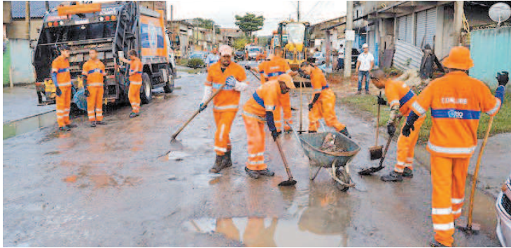
Moradores dos bairros devem deixar o lixo uma hora antes da coleta

A Comlurb iniciou, ontem, alguns ajustes nos dias e horários de coleta nos bairros de Guaratiba e Barra de Guaratiba, na Zona Oeste. Em toda a Ilha de Guaratiba, a coleta domiciliar passa a ser realizada às terças-feiras, quintas e sábados, a partir das 17h. Já no Centro da Pedra de Guaratiba, no Vila Mar e no Piraquê a retirada será às segundas, quartas e sextas, no mesmo horário. Em todos os sub-bairros da Estrada do Magarça e Jardim Maravilha, a coleta será unificada, passando a ser feita às segundas, quartas e sextas, a partir das 6h. Em outros pontos, como a Reta da Pedra, Jardim Guaratiba, Jardim Cinco Marias, Jardim Luana, Brisa, Estrada da Grama, Estrada