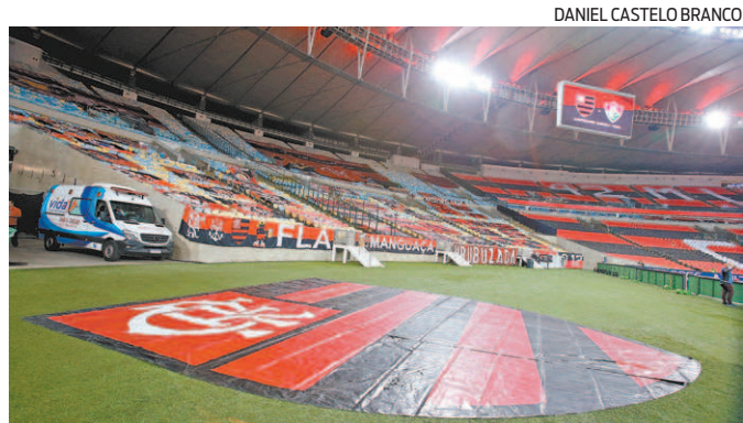
Maracanã sem público no Campeonato Carioca de 2020