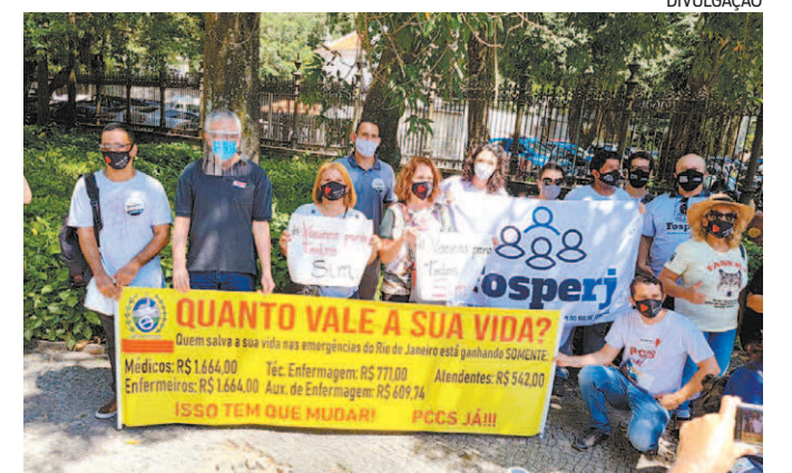
Servidores estaduais protocolaram ofício no Palácio Guanabara

A comissão aguarda, agora, o agendamento do encontro.