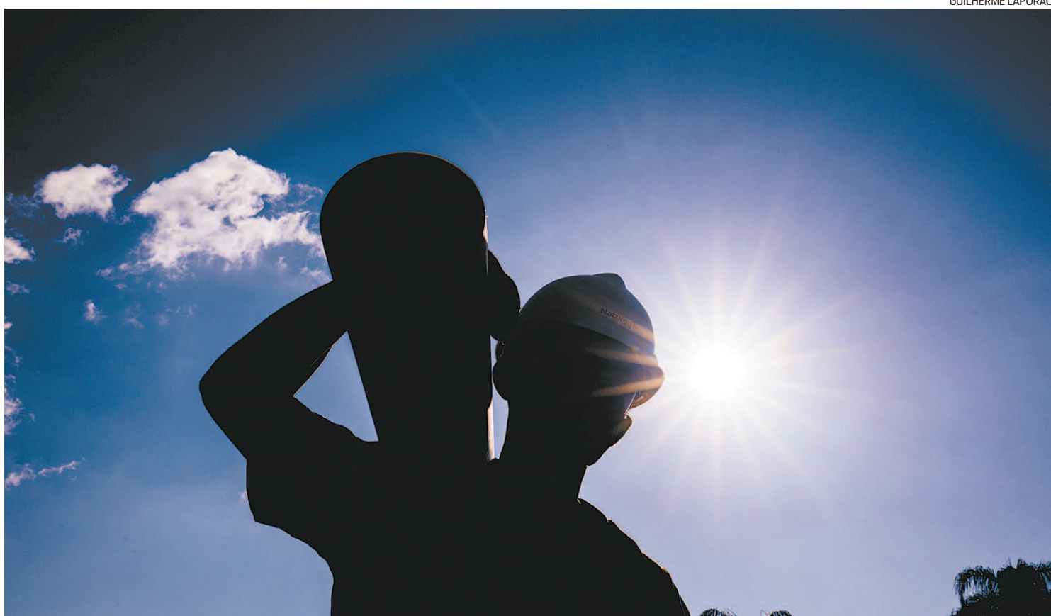
A decisão não teria considerado análises de consultorias e informações técnicas da distribuidora de gás natural do Rio

A decisão da agência não teria considerado os estudos de consultorias especializadas e as informações técnicas apresentadas pela distribuidora de gás natural do Rio de Janeiro, e nem mesmo considerado grande parte do relatório técnico da Universidade Federal Fluminense (UFF), contratada pela própria agência. Especialistas apontaram equívocos de metodologia e até erros matemáticos na decisão do grupo de trabalho da Agenesra. Ainda cabe recurso administrativo.