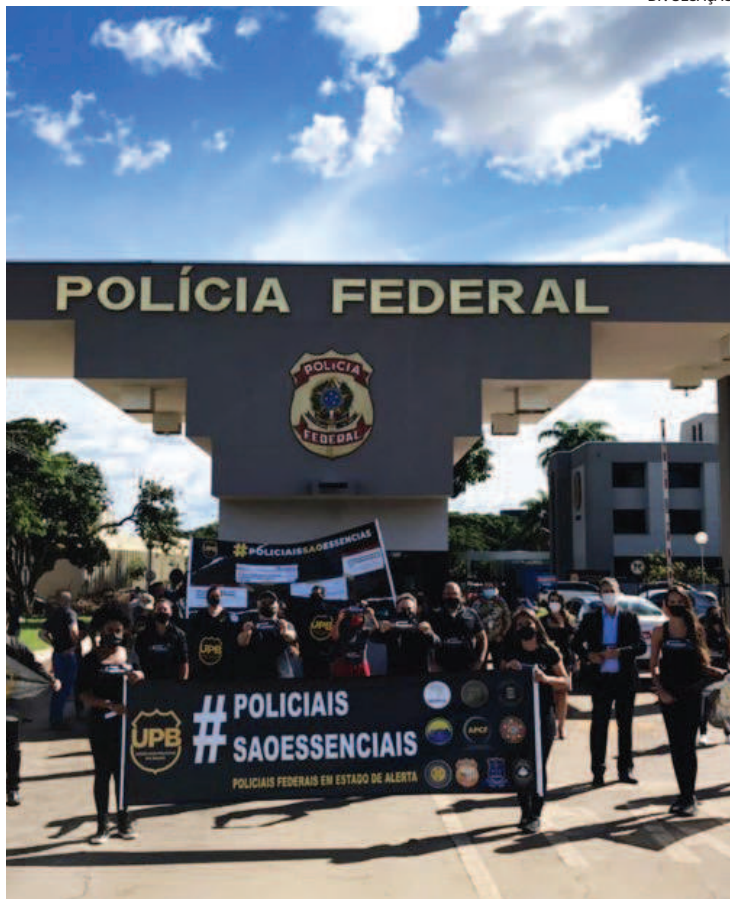
Ato da UPB ocorreu em Brasília (foto) e em diversos estados do país

De acordo com cálculos apontados pelas entidades, a proibição a reajuste poderá valer por 15 anos, levando em conta já 2021 (as reposições salariais já estão vetadas).