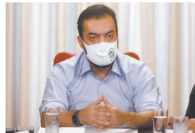
Castro defende medidas restritivas mais flexíveis

licita ainda que o texto tramite em regime de urgência. Castro, inclusive, esteve há pouco com o presidente da Alerj, André Ceciliano (PT), para entregar o projeto. Se aprovado, deve ser sancionado pelo chefe do Executivo ainda hoje dependendo das modificações que forem feitas no texto pelo Legislativo. É possível que a sanção saia publicada em sessão extraordinária do Diário Oficial.