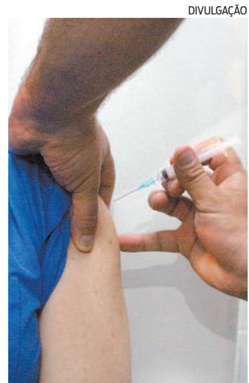
Setor pede vacinação acelerada