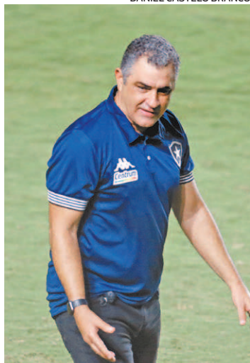
Chamusca: empate frustrante

“A gente fez um segundo tempo muito bom no aspecto de construção de jogadas, neutralizamos muito bem o Vasco até um determinado momento e tivemos muitas possibilidades em transição e contra-ataque. (Empate no fim) deixa a gente frustrado, porque nosso sentimento é pelo tanto que a gente produziu no segundo tempo.