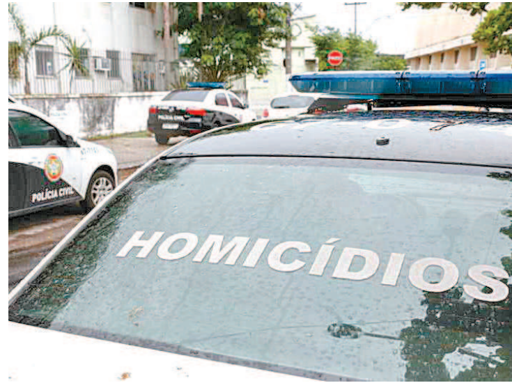
Número de homicídios dolosos foram retratados no estudo do ISP

por intervenção de agente do estado. Em fevereiro, o indicador registrou o menor valor para o mês desde 1991: 409 em 2021 e 502 em 2020, uma diminuição de 10%. Nos dois primeiros meses do ano, as polícias Civil e Militar retiraram de circulação cerca de 22 armas de fogo por dia no estado, contabilizando um total de 1.272 armas. Destas, 93 eram fuzis. Os crimes contra o patrimônio também apresentaram resultados significativos nos dois primeiros meses do ano. Os roubos de rua (roubo