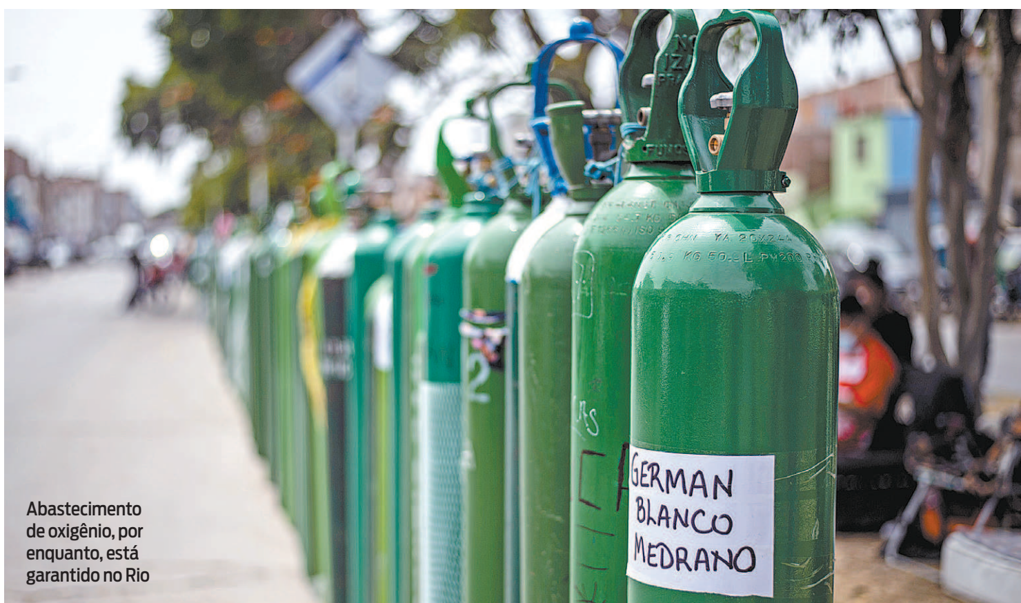
Abastecimento de oxigênio, por enquanto, está garantido no Rio

Estoque de anestésicos, bloqueadores e drogas para manutenção do coma induzido pode se esgotar ainda nesta semana