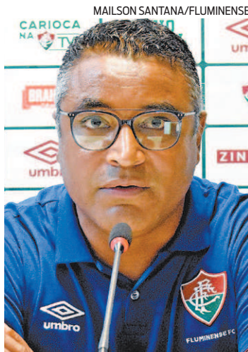
Técnico do Flu gostou do time

"O Paulo (Henrique Ganso) chegando à frente como falso 9 deu uma dinâmica interessante. O que eu pedi no intervalo era que, quando ele não tivesse participando, estivesse dentro da área, e foi assim que conseguiu fazer o gol da vitória. O Campeonato Carioca é muito difícil. Em 70% do jogo tivemos um nível altíssimo. Evidentemente, sabemos que não vamos dominar o adversário sempre", afirmou Roger. O treinador, porém, dis-