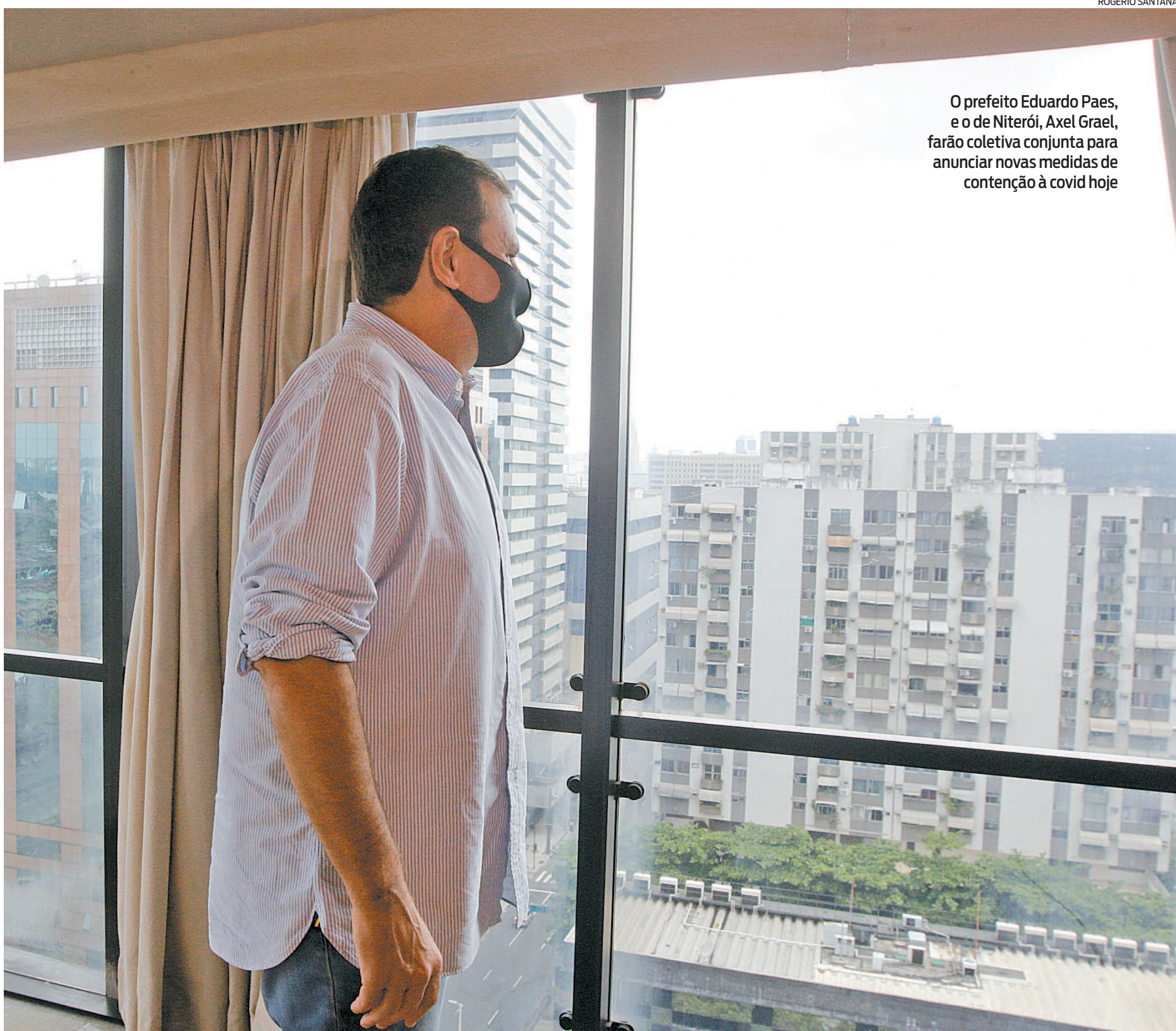
O prefeito Eduardo Paes, e o de Niterói, Axel Graef, farão coletiva conjunta para anunciar novas medidas de contenção à covid hoje

Os dois prefeitos informaram, em nota conjunta, que vão fazer uma reunião virtual com os comitês científicos dos dois municípios hoje de manhã. No início da tarde será realizada uma coletiva no Solar do Jambeiro, em Niterói. Ainda segundo a fonte, “pode ser que na coletiva de hoje as duas cidades adotem medidas mais duras”.