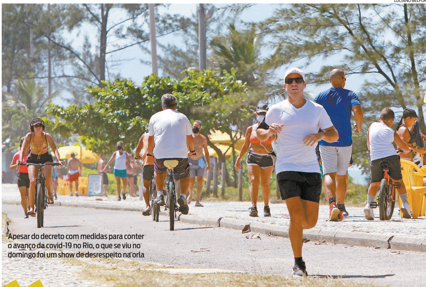
Apesar do decreto com medidas para conter o avanço da covid-19 no Rio, o que se viu no domingo foi um show de desrespeito na orla

Apenas entre a manhã de sábado e ontem foram registradas 804 autuações, entre multas e interdições a estabelecimentos, não utilização de máscaras, aglomerações, infrações de trânsito, rebuques, encerramento de feiras, apreensões de mercado-