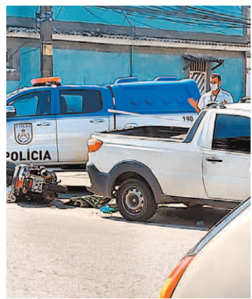
Crime ocorreu no sábado