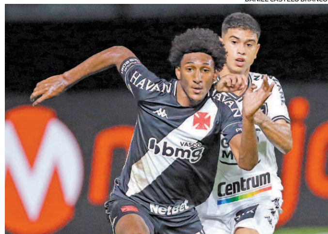
Duelo entre Vasco e Botafogo pelo último Brasileiro