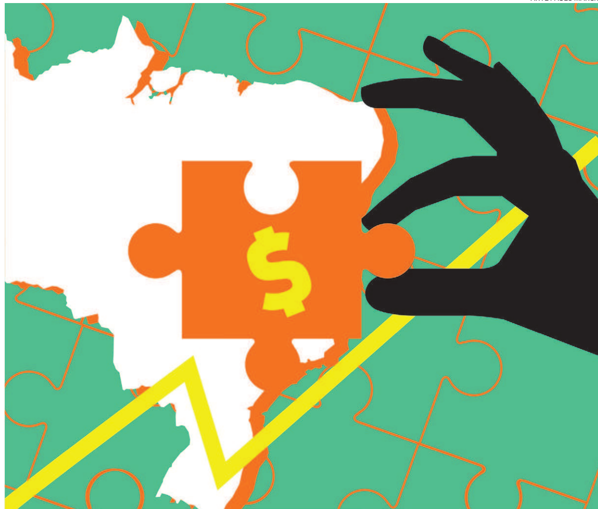
ARTE PAULO MÁRCIO

“As oportunidades para atuar na infraestrutura são amplas, mas, por aqui, puxado pela vertente pública, o investimento entrou em queda livre até 1990”