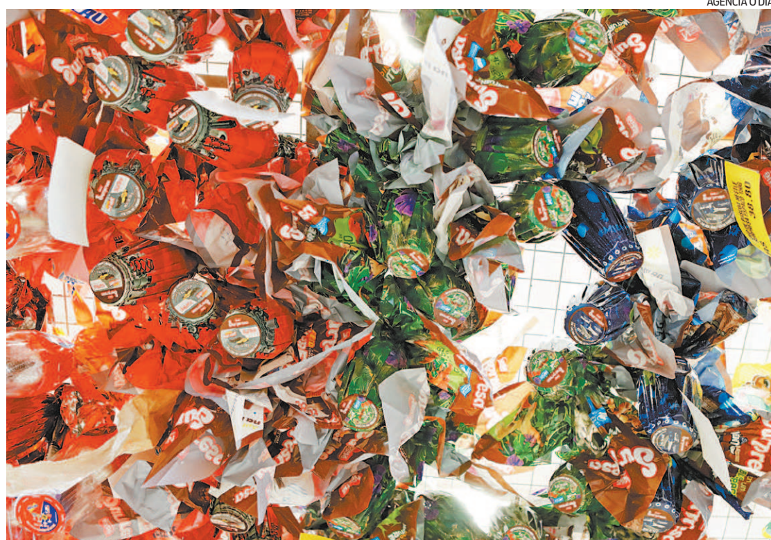
Páscoa: comércio adota cautela com a chegada do feriado no meio da pandemia da covid-19

Reportagem da estagiária Maria Clara Matturo , sob supervisão de Marina Cardoso