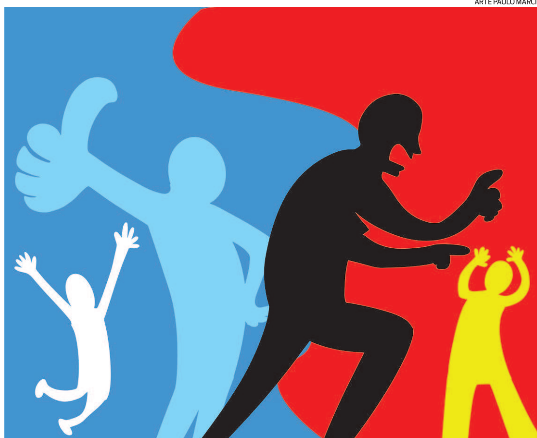
ARTE PAULO MÁRCIO

De forma estranha, a polarização é estimulada pelas mídias sociais. Estamos atirando um no outro. Estamos atirando naqueles que achamos que estão errados com postagens, tweets, fotos, acusações, comentários. Fo-