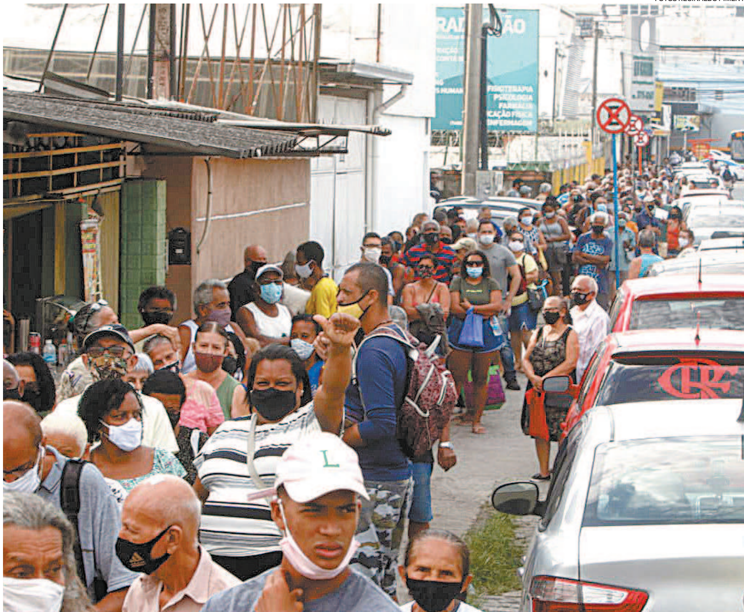
Idosos enfrentaram aglomeração e longas filas para conseguir tomar a primeira e a segunda dose da vacina contra a covid-19 em Belford Roxo

Sobre a lotação no posto de saúde Neuza Brizola, a prefeitura disse que este problema foi influenciado pela unidade estar no ponto central do município, que faz limite com outras cidades, como Nova Iguaçu, Mesquita e São João de Meriti, além de ficar nas proximidades da