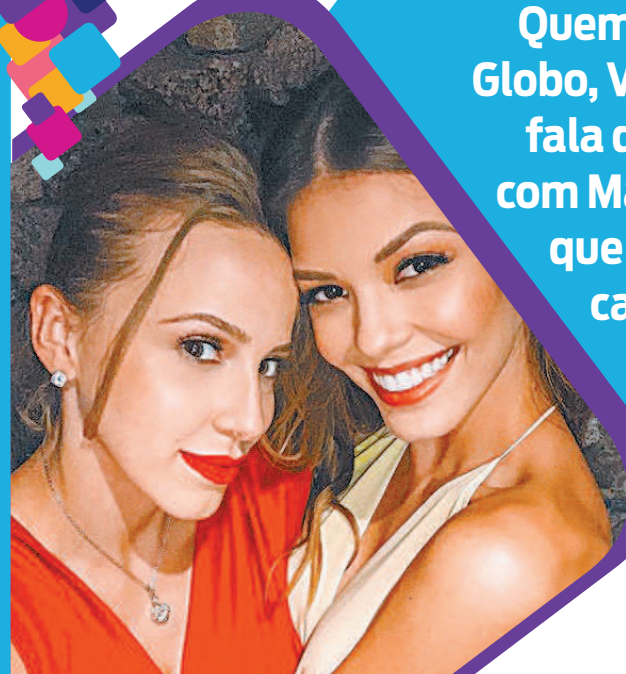
Vitória Strada e Marcella Rica: casamento sem data definida. "Esperar a situação normalizar", diz Vitória

Prestes a voltar ao ar em 'Salve-se Quem Puder', na Globo, Vitória Strada fala do noivado com Marcella Rica, que a pediu em casamento