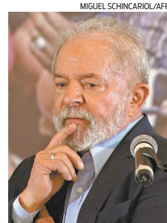
Lula entrou com ação e ganhou