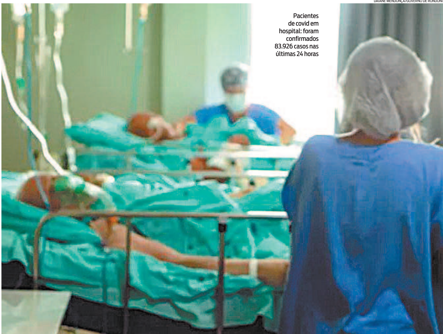
Pacientes de covid em hospital: foram confirmados 83.926 casos nas últimas 24 horas

A nova fase ocorrerá pelos próximos 15 dias e permite o funcionamento apenas de atividades consideradas essenciais pelo governo, além da implantação de barreiras sanitárias e toque de recolher em todo o estado entre as 20h e as 5h.