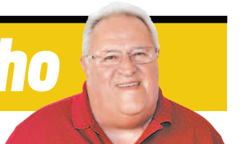
ALEXANDRE VIDAL / FLAMENGO