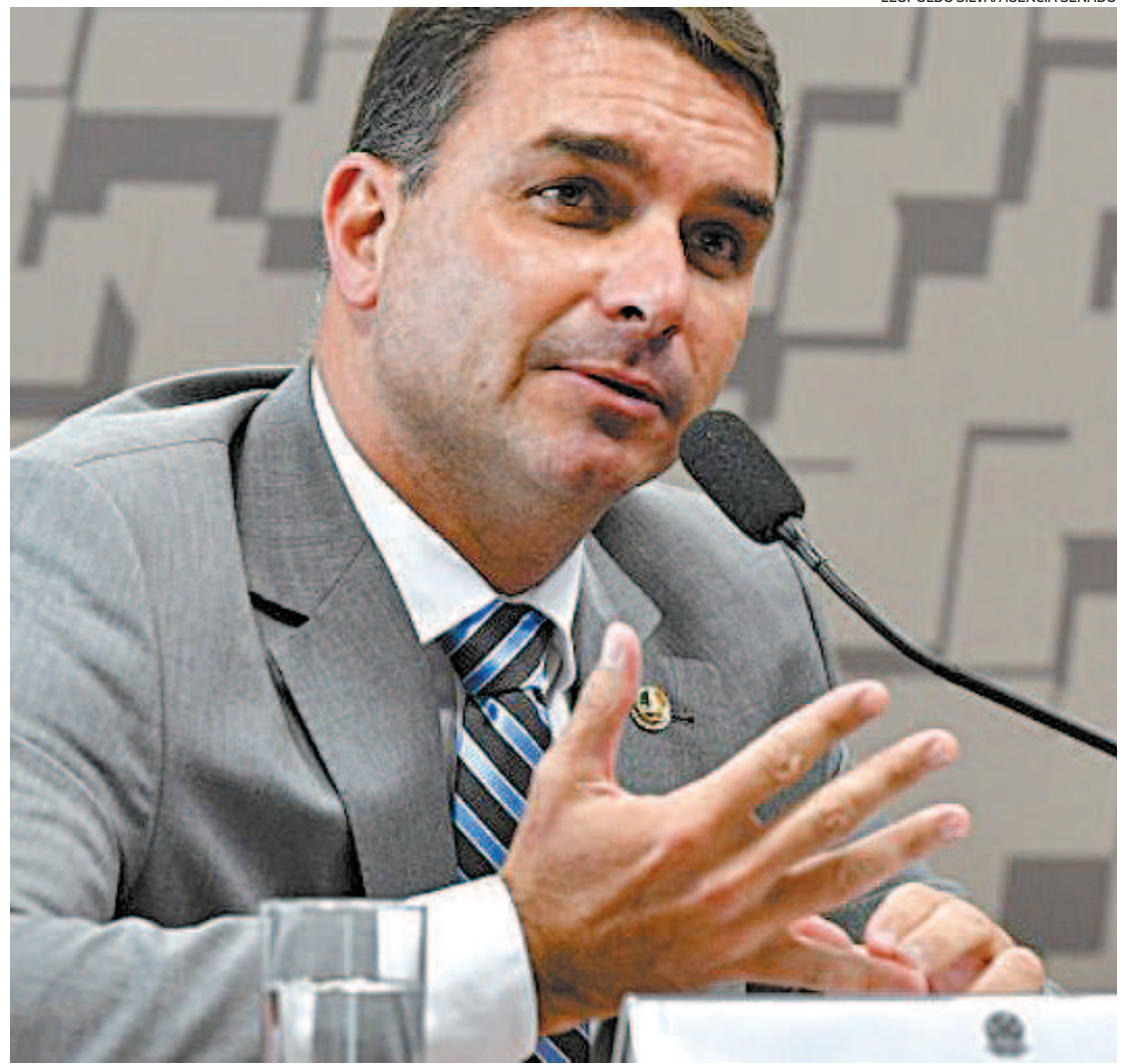
Filho 03 de Bolsonaro sofreu derrota no Superior Tribunal de Justiça, que validou o uso do relatório do Coaf

Mas com a decisão de ontem do STJ, os atos do foram validados. Ou seja, o compartilhamento de informações pelo Coaf com o Ministério Público do Rio e as decisões tomadas pelo juiz desde o início das investigações estão valendo.