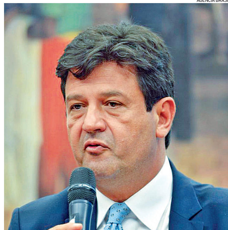
Ex-ministro Mandetta diz que ‘se presidente não mudar, nada muda’