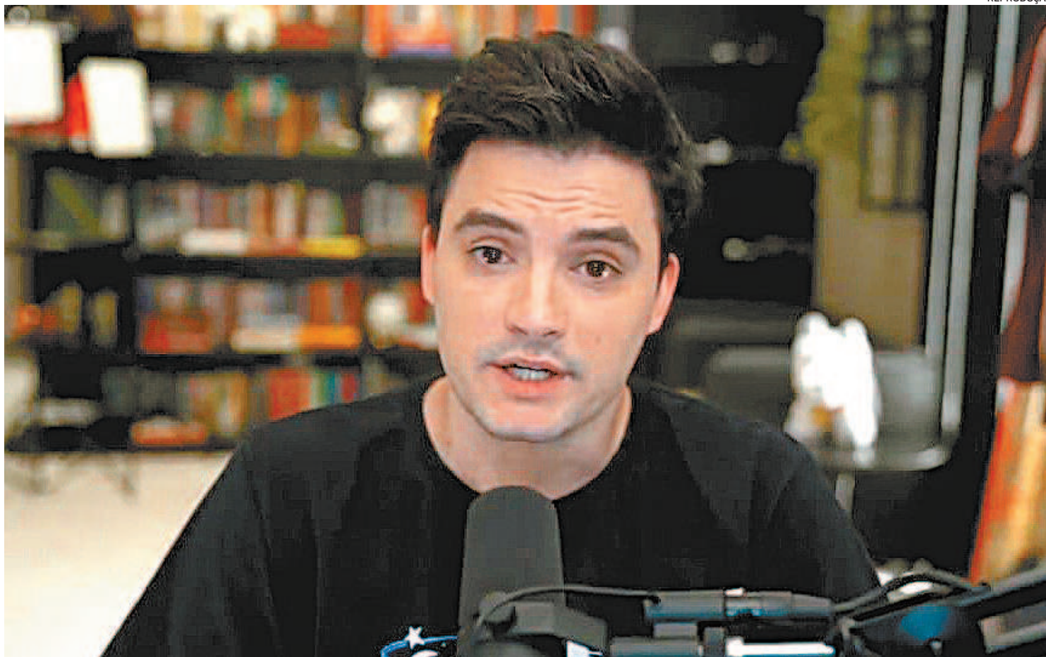
Especialistas afirmam que, no contexto de enfrentamento à covid, as afirmações de Felipe Neto não ferem a Lei de Segurança Nacional