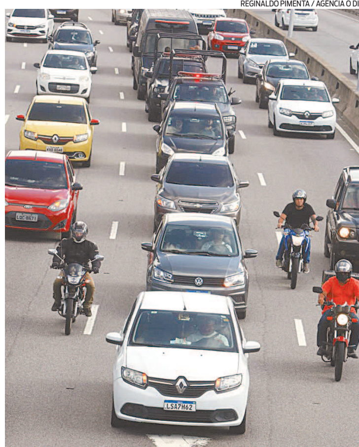
Decreto da prefeitura com a cobrança entra em vigor em 30 dias

A Rio Ônibus defendeu que regulamentação dos transportes públicos é fundamental para a segurança e organização da mobilidade urbana. A entidade diz que em várias regiões do mundo o poder público destina parte dos impostos relacionados às corridas por aplicativos a investimentos nos transportes coletivos e redução do preço de passagens.