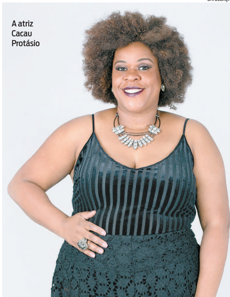
A atriz Cacau Protásio