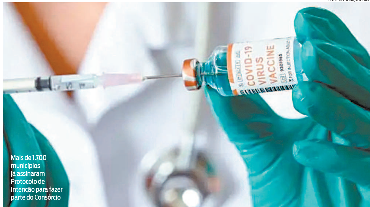
Mais de 1.700 municípios já assinaram Protocolo de Intenção para fazer parte do Consórcio

Além dos imunizantes, o Consórcio poderá adquirir de maneira autônoma medicamentos, insumos e equipamentos na área da saúde. Na semana passada, segundo a Frente Nacional de Prefeitos, mais de 1.700 municípios já haviam assinado Protocolo de Intenção para fazer parte do Consórcio.