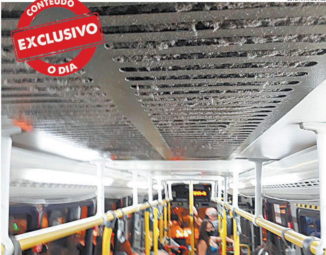
Linhas de ônibus estão operando sem manutenção e limpeza pela cidade, justo no meio da pandemia

No Twitter, um passageiro que utilizava a linha 821, em Campo Grande, na Zona Oeste, afirmou ter desistido do transporte público e agora faz seu trajeto a pé, preferindo andar cinco quilômetros do que pegar ônibus devido à lotação, desconforto e calor. “Meu di-