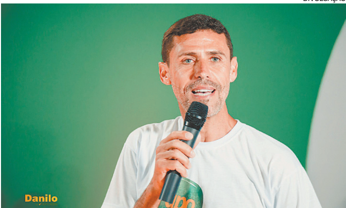
Danilo era investigado por homicídio e extorsão, entre outros crimes

Reportagem do estagiário Jorge Costa , sob supervisão de Thiago Antunes