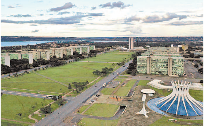
Funcionalismo público reforçará ato nacional contra o governo