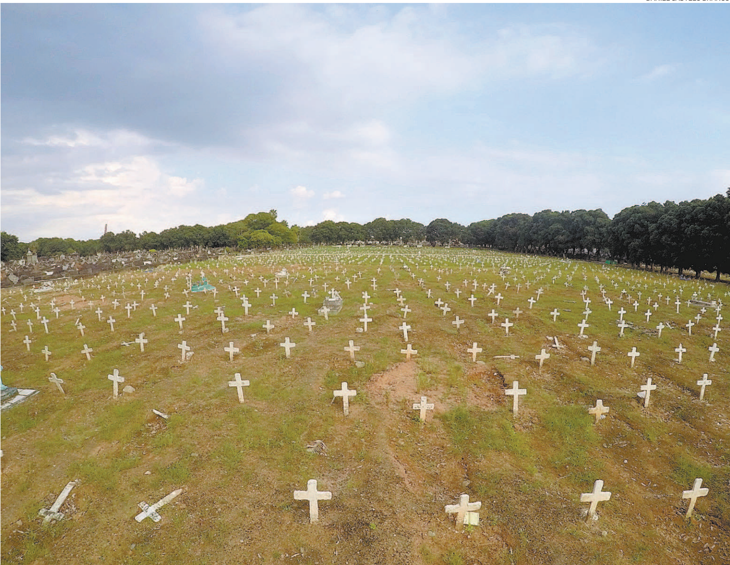
Com aumento do número de casos de covid e taxa de ocupação de leitos em níveis altíssimos, Brasil registra novo recorde diário de óbitos

O ranking de número de mortes segue liderado pelo estado de São Paulo, que tem 62.570 óbitos causados pela covid-19. O Rio de Janeiro continua em segundo lugar, com 33.893 mortes, seguido por Minas Gerais (19.824), Rio Grande do Sul (14.087) e Paraná (13.060). Desde o início de junho, o