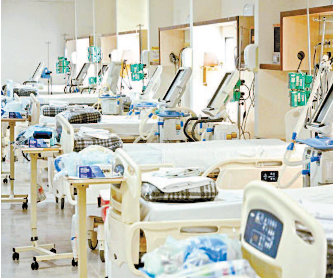
Taxa de ocupação de UTIs está acima de 90% em cidades como Porto Velho, Rio Branco e Fortaleza

tais brasileiras estão com a taxa de ocupação no patamar considerado zona de alerta crítico, com mais de 80% dos leitos ocupados. Na maior parte dessas cidades, a ocupação passou dos 90%. Belém e Maceió, apesar de estarem na zona de alerta intermediário, apresentam ocupação de UTIs acima de 70%. Estavam na zona de alerta crítico segundo dados coletados em 8 de março: Porto