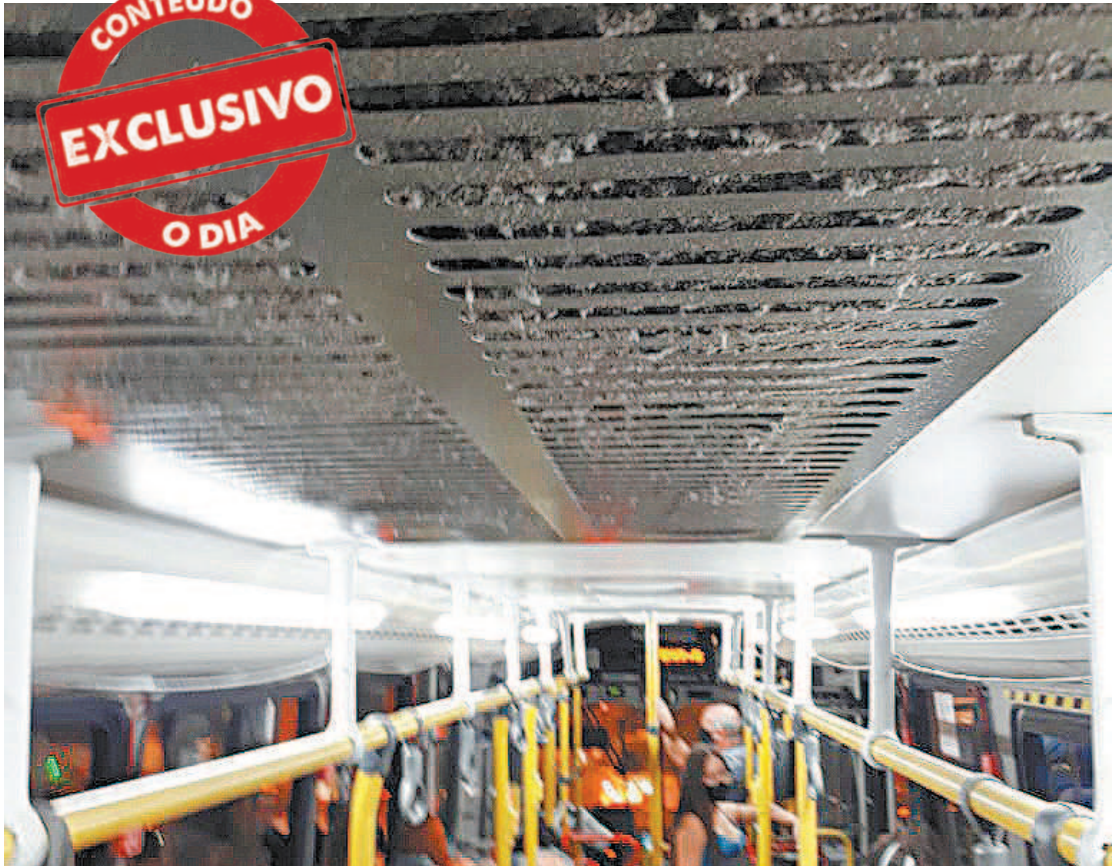
Linhas de ônibus estão operando sem manutenção e limpeza pela cidade, justo no meio da pandemia

No Twitter, um passageiro que utilizava a linha 821, em Campo Grande, na Zona Oeste, afirmou ter desistido do transporte público e agora faz seu trajeto a pé, preferindo andar cinco quilômetros do que pegar ônibus devido à lotação, desconforto e calor. “Meu di-