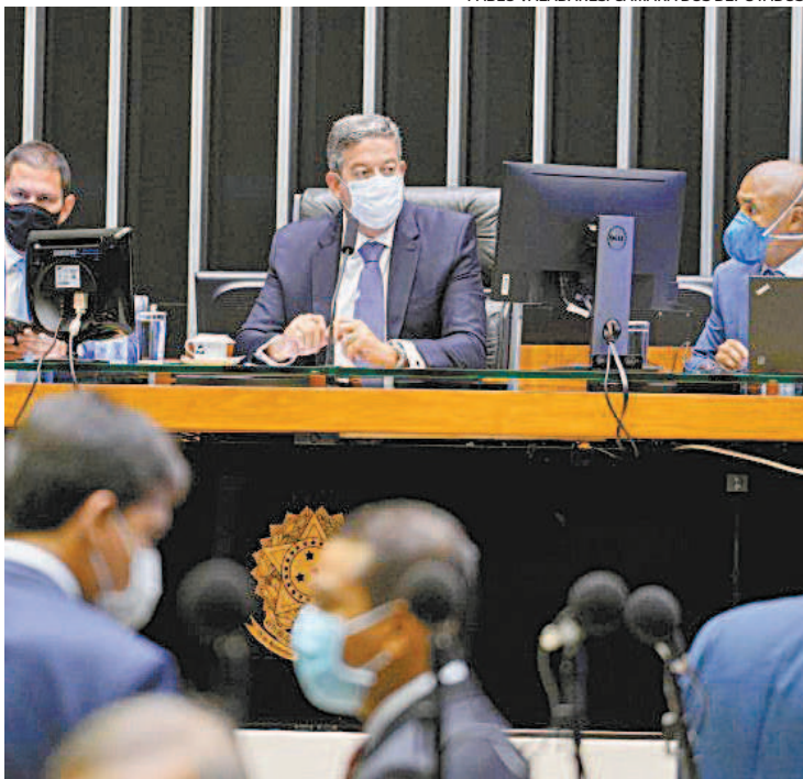
Câmara analisou destaques À PEC Emergencial ao longo do dia

Os deputados rejeitaram destaque do Psol, que pretendia acabar com a restrição para aumentos salariais. Já o impedimento de progressões funcionais foi extraído do texto como uma saída encontrada pelo líder do governo, Ricardo Barros (PP-PR), diante da possibilidade de a Casa aprovar destaque do PT que suprimiria todos os mecanismos de ajuste. A medida também foi fruto de acordo entre os partidos após articulações do setor público.