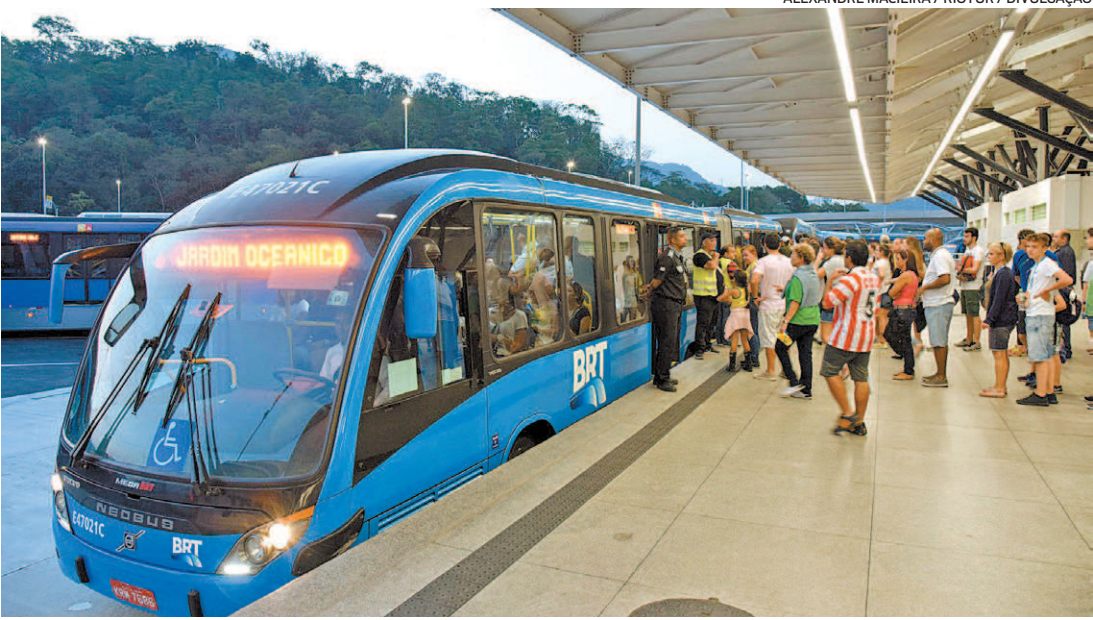
BRT Rio: direção da concessionária fechou acordo para pagar indenização de 100 funcionários demitidos

“Pelo acordo, ficou definido que os funcionários irão receber os valores devidos em 10 parcelas, sendo que cada uma não poderá ser inferior ao valor do salário de cada trabalhador ao ser dispensado. Diante da dificuldade exposta pela empresa, acredito que essa tenha sido a melhor saída encontrada para que esses profissionais tenham condições de honrar com seus compromissos, levar o sustento de suas fa-