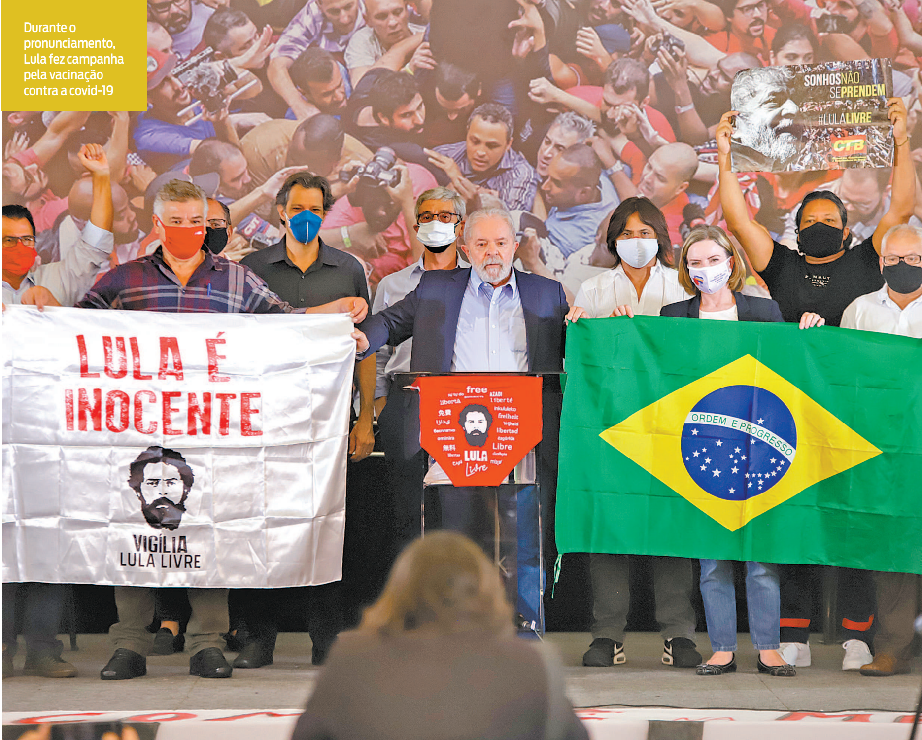
Durante o pronunciamento, Lula fez campanha pela vacinação contra a covid-19

As medidas para facilitar posse de armas estiveram na mira de Lula. Segundo ele, Forças Armadas e polícia precisavam de armas novas, não a população. Sobre o auxílio emergencial, Lula afirmou que “enquanto o governo não cuida de emprego, salário e renda, é preciso ter salário emergencial para que as pessoas não morram de fome”. Reforçou a dificuldade dos brasileiros e disse que era feliz quando via um trabalhador dizendo que iria “comprar uma picanha para comer tomando uma cerveja”. “Esse país não tem governo, não tem ministro da Saúde, não tem ministro da Economia, tem um fanfarrão”.