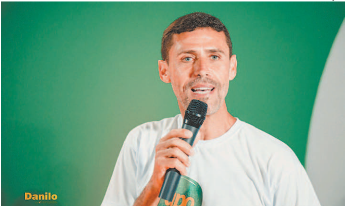
Danilo era investigado por homicídio e extorsão, entre outros crimes

Reportagem do estagiário Jorge Costa , sob supervisão de Thiago Antunes