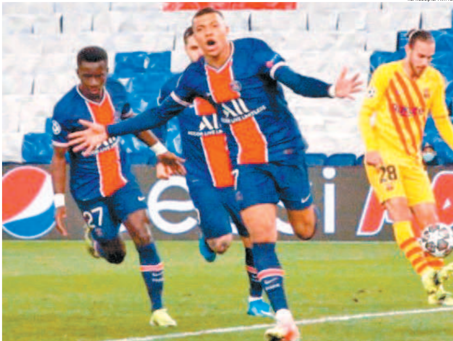
Mbappé vibra após marcar o gol do PSG, no Parque dos Príncipes, e manter o time francês sonhando com a conquista do inédito título europeu

A vaga do Liverpool foi assegurada ontem também, após o time inglês bater o RB Leipzig, por 2 a 0, com gols de Salah e Mané, na Puskas Arena, repetindo o placar do primeiro