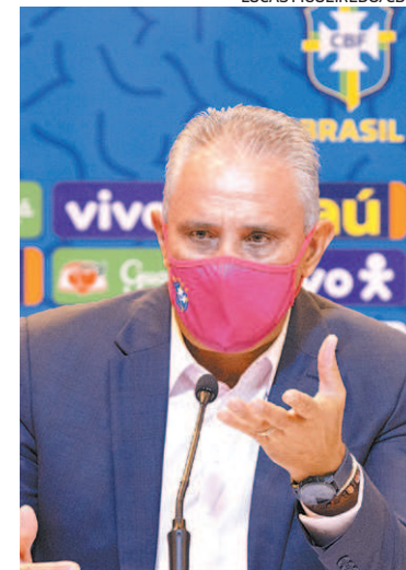
Tite: pandemia gera indefinições

ma persiste, os clubes europeus não querem ceder jogadores e têm aval da Fifa. Decisão que mutila as equipes. Fora isso, existem restrições para a entrada das delegações em alguns países, como a própria Colômbia, uma das anfitriãs, o que inviabilizaria a disputa. O cancelamento da competição só não foi decidido em razão dos compromissos comerciais com patrocinadores e detentores de direitos de transmissão. A Copa América subiu no telhado.