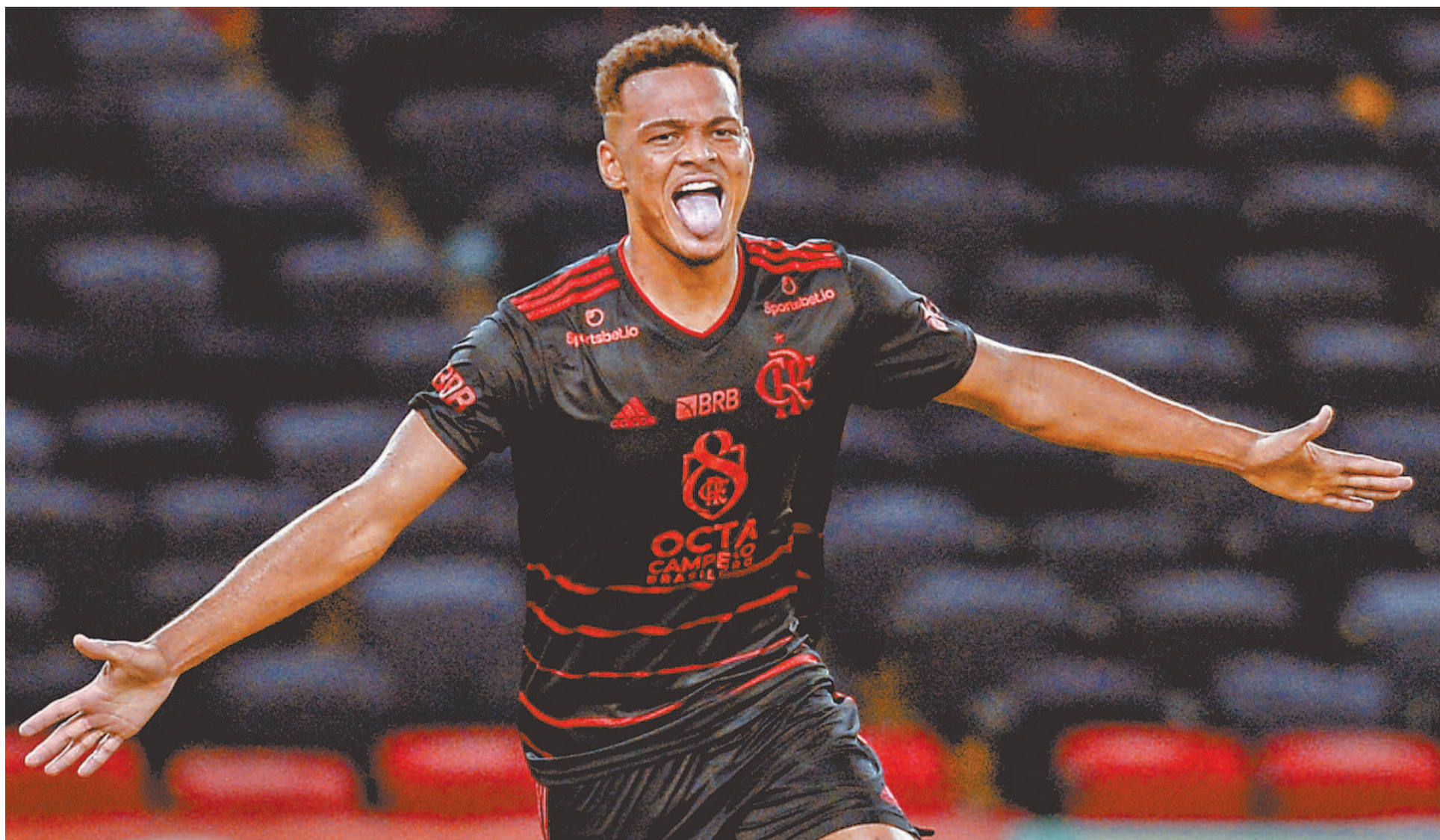
MARCELO CORTES / FLAMENGO