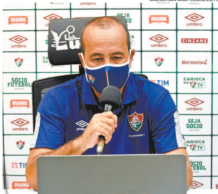
Aílton criticou a atuação do Fluminense: 'Atuação para se esquecer'