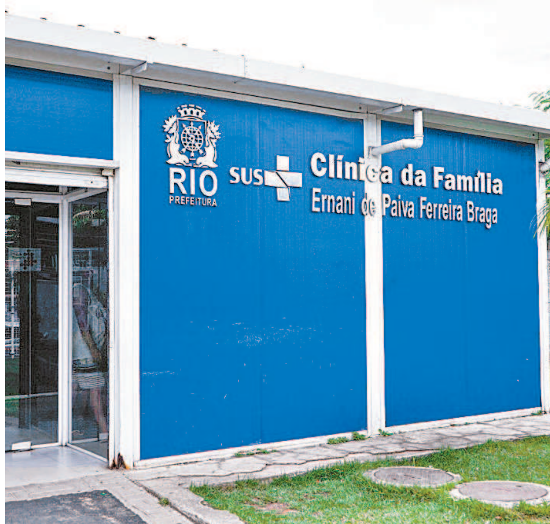
Unidade de saúde passa por reforma e se torna polo de vacinação para moradores de diversos bairros